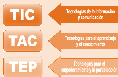
Figura 1. Tres visiones de aplicación de las TIC

Aspectos como los comentados me llevaron en su momento (Cabero, 2014a) a señalar que la incorporación educativa de estos instrumentos tecnológicos podríamos hacerla desde tres posiciones (véase figura 1). Posiciones que implican, por una parte, darle un sentido y aplicación específica a la enseñanza, destacando en unas su visión transmisora y en otras su posición creadora, y por otra, que orientan la epistemología desde la que debemos llevar a cabo la formación y el perfeccionamiento del profesorado en estos elementos curriculares.