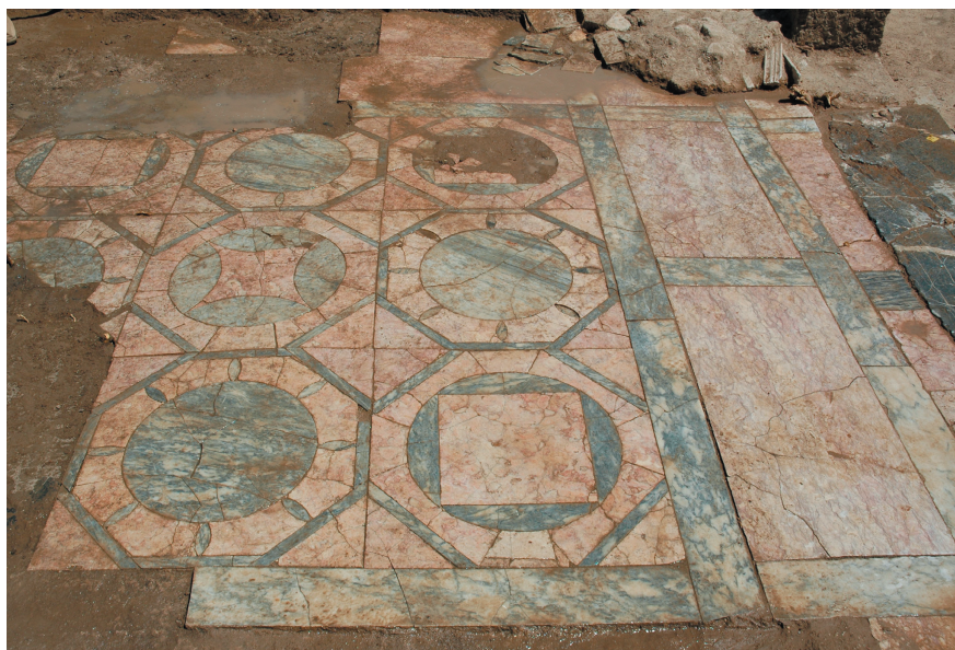
Fig. 3. Detalle del pavimento en opus sectile en el acceso al edificio.