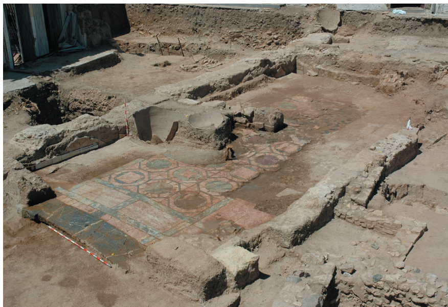
FIG. 2. Vista general del edificio tras su excavación (septiembre 2006).