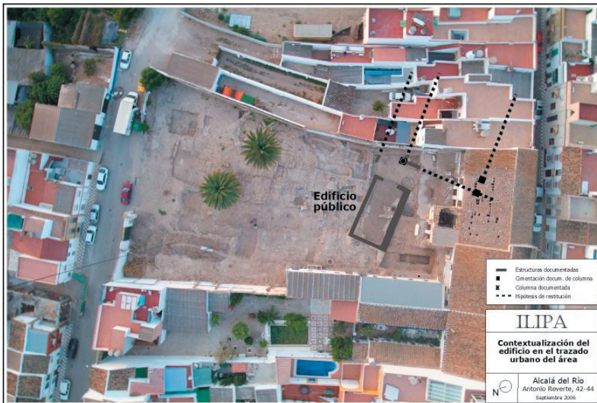
FIG. 1. Localización del edificio público analizado en el contexto de las estructuras excavadas en el solar de la calle Antonio Reverte, 42-44.

del Emperador. De confirmarse la datación aquí propuesta para el pavimento del edificio ilipense, sería preciso cuestionar la afirmación que vinculaba el desarrollo de las técnicas del trabajo del mármol con la presencia masiva de los mármoles importados, en muchas ocasiones, incluso, explicado por la llegada, con ellos, de artifices especializados también foráneos. De hecho, inmediatamente con anterioridad a este fenómeno, es decir, a fines de época republicana, comienzos de época imperial, se sitúa el horizonte constructivo presente en muchas ciudades hispanas asociado al empleo de piedras locales, con acabado estucado, justificado, precisamente, por la incapacidad tanto de tipo tecnológico como de accesibilidad a los materiales. No obstante, en el proyecto del foro de Ilipa , nos encontramos, al parecer, con ambas tradiciones de forma contemporánea. Es posible que se trate de un fenómeno un tanto particular propio de estas ciudades del valle del Guadalquivir con una posición privilegiada e inmejorable para los intercambios y el acceso a materiales y, eventualmente, nuevas tradiciones decorativas