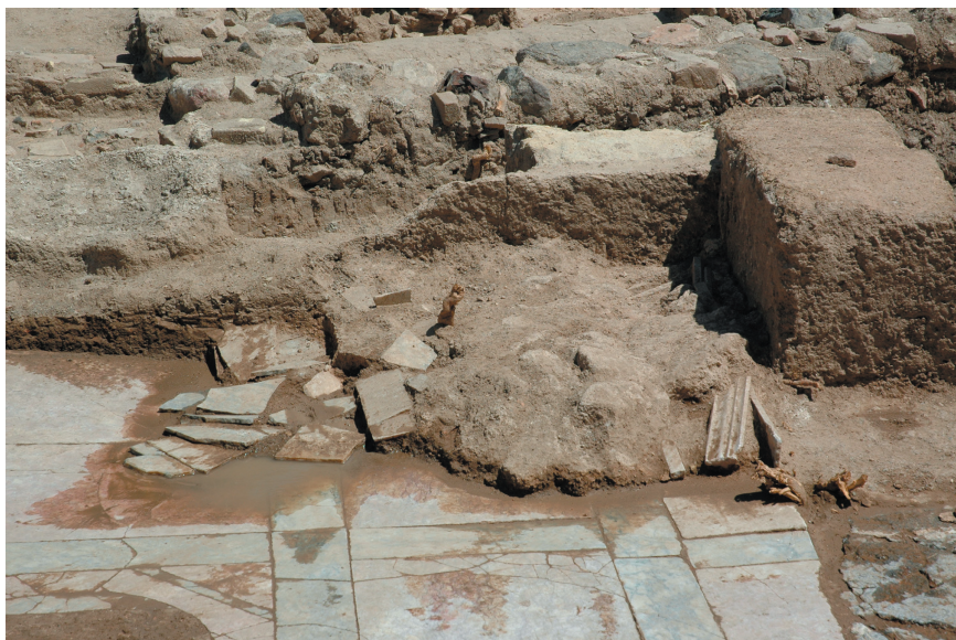
FIG. 5. Derrumbe de la decoración parietal en el ángulo noreste del edificio.