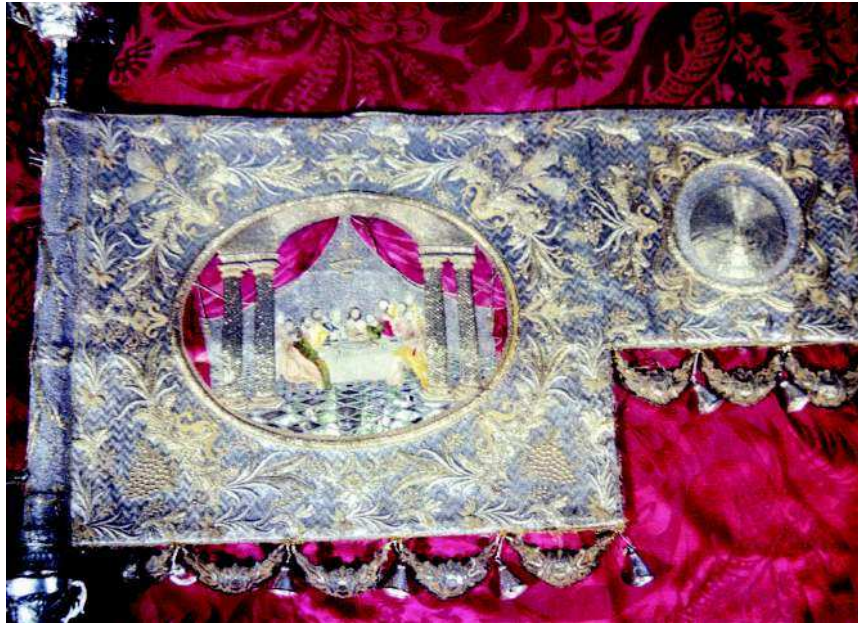
8. Juan Bautista Carrasco y Araraz. Guión Sacramental . 1816.