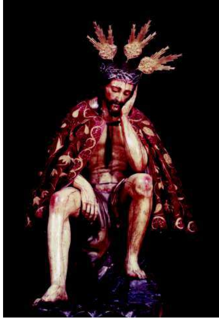
4. Anónimo sevillano. Muceta del Cristo de la Humildad y Paciencia . 1721.