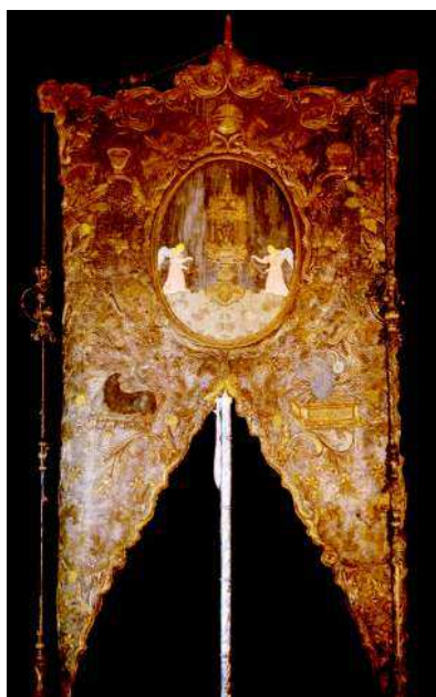
7. Juan Bautista Carrasco y Alaraz. Simpecado Sacramental. 1815.