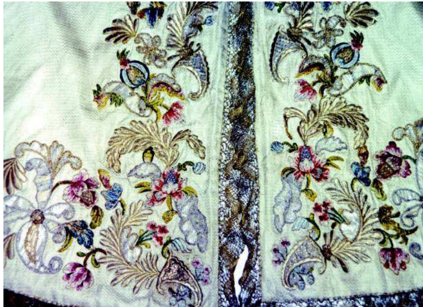
11. Anónimo sevillano. Capa corta. Tercer cuarto del siglo XIX.