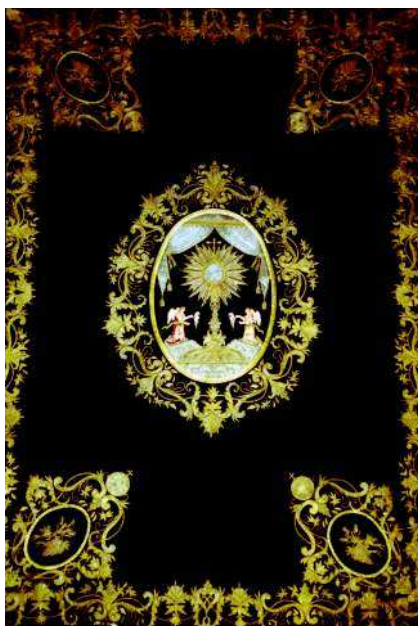
6. Juan Bautista Carrasco y Alaraz. Paño mortuorio. 1812.