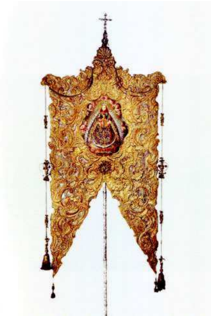
5. Julián de Paradela y Lopo. Simpecado de Nuestra Señora de las Aguas . 1761.