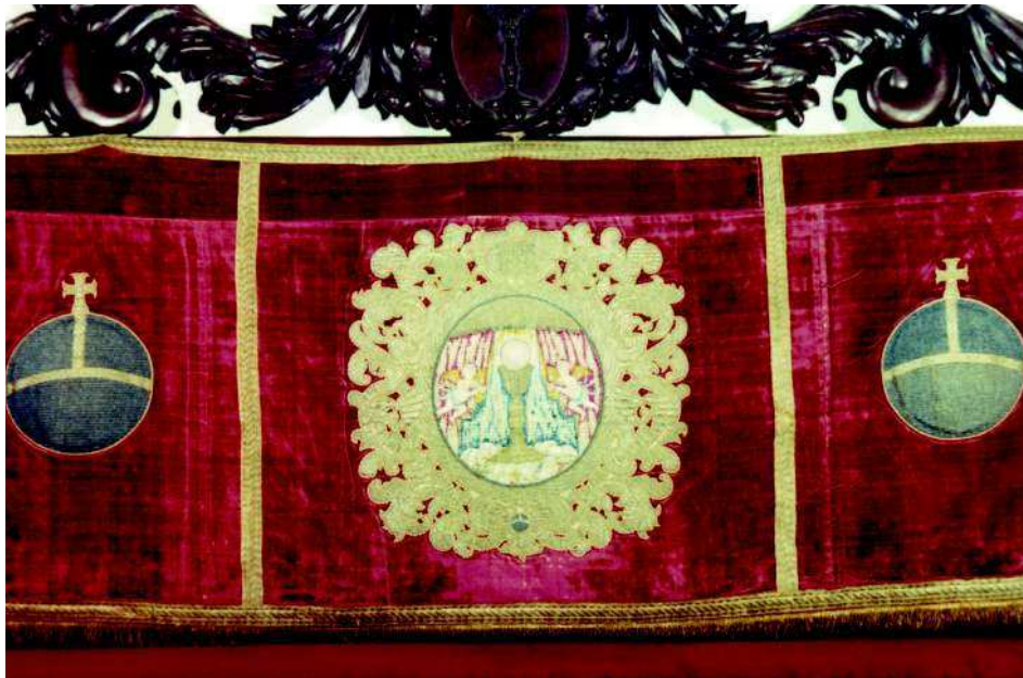
3. Anónimo sevillano. Paño de sobremesa. 1721.