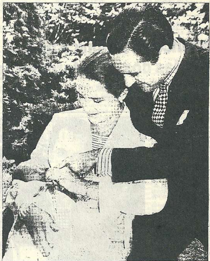
Felipe Juan Froilán de Marichalar y Borbón

Páginas 11 a 14 / Editorial en la página 8