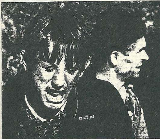
Un joven kosovar llora al identificar a un familiar entre los cuerpos amortazonados en una zanja en Raçak.

El ejemplo del fiscal Kenneth Starr, el hombre que acusa al presidente Clinton, ha cambiado en Europa, se lamenta el vicepresidente de la Comisión Europea, Manuel Marín, en una entrevista con EL PAÍS. En Alemania y en algún que otro país europeo, muchos políticos han emprendido una ofensiva contra la Comisión Europea y contra el mismo tras el descubrimiento de corrupción. "Si una mera cortina de humo para tener intereses políticos nacionales a corto plazo", denuncia Marín, quien también critica la "antagonía" con Alemania. Páginas 2 y 3