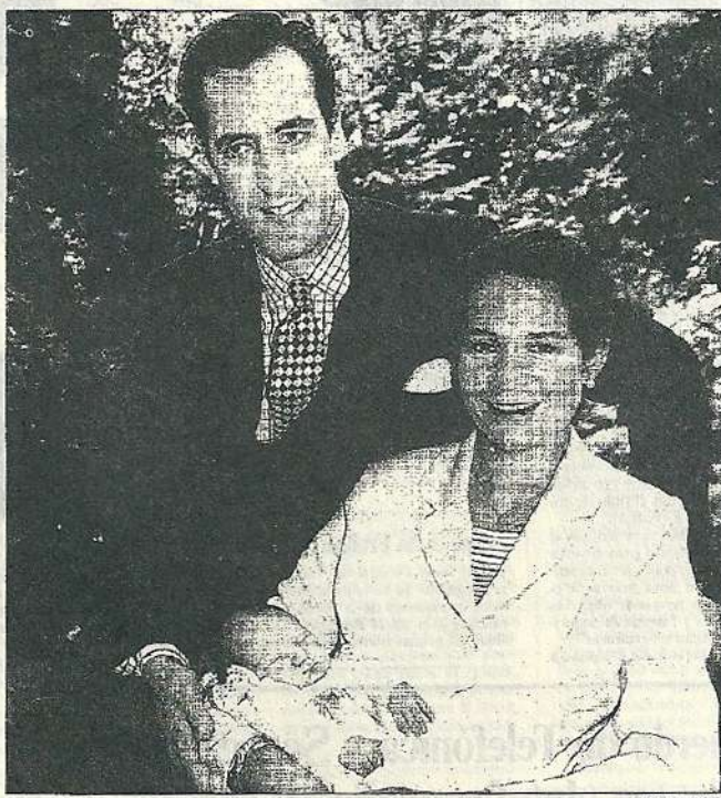
Los Duques de Lugo posan por primera vez para los fotógrafos, junto a su hijo.