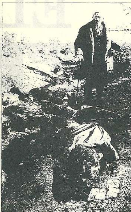
Un hombre observa los 23 cadáveres amontonados en una zanja.

La OSCE, llegada a la provincia serbia para verificar el alto el fuego en vigor desde octubre, se ha convertido en una misión apagafuegos que acude a cada nuevo foco de combate para intentar detenerlo. Una fuerza de 1.500 hombres de la OTAN está desplegada en la vecina Macedonia eslavica para evacuar en caso de peligro a los observadores de la OSCE, que van desarmados. El presidente de Yugoslavia, Slobodan Milosevic, ya alertó de que la entrada de los observadores en Kosovo sería interpretada como una "agresión", y como tal sería respondida por el Ejército yugoslavo. La misión de la OSCE está sometida a permanentes acusaciones, tanto de las autoridades serbias como de la guerrilla, por su supuesta "parcialidad", lo que, según los analistas, no contribuye precisamente a su aceptación por parte de los dos pueblos enfrentados. El Tribunal Penal Internacional para la ex Yugoslavia anunció ayer que ha iniciado una investigación sobre los asesinatos. Además, el líder moderado de los albaneses de Kosovo, Ibrahim Rugova, pidió una "intervención urgente" de la OTAN. "Sólo una intervención internacional contundente puede parar la máquina militar de Belgrado y procurar las condiciones para el inicio de una solución política", manifestó.