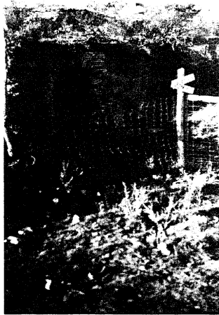
Una cueva que fue habitada en el siglo XVIII por los colonos, conservada actualmente en Carmen de Patagones.

alquiladas 9 o vendidas 10 . Algunas fueron mejoradas por sus dueños con la incorporación de nuevas habitaciones, cocina o aleros.