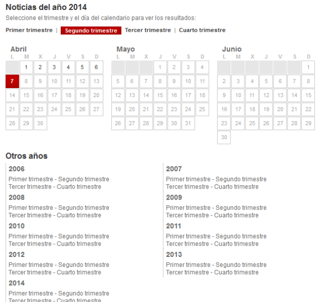
Figura 2. Alcance temporal de la hemeroteca digital