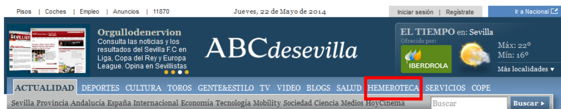
Figura 1. Acceso a la hemeroteca en ABC de Sevilla

Análisis: En las páginas de los diarios digitales la ubicación para poder acceder puede tener diferentes configuraciones. Normalmente, tiene visible su apariencia en el portal Web pero no se descarta que el acceso sea complicado.