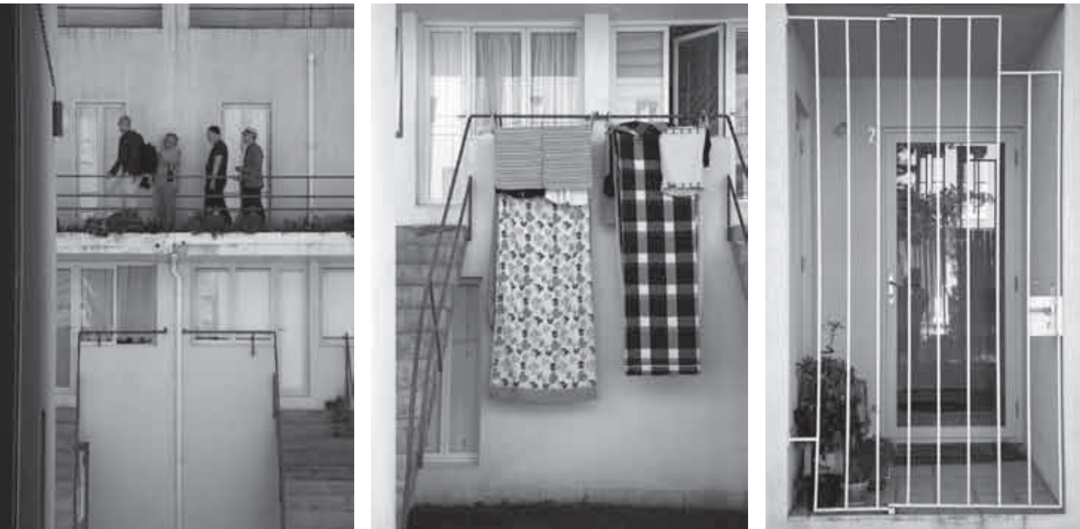
2. Serie de fotografías del barrio de viviendas sociales en Bouça, Oporto. Álvaro Siza, 1973-2006.