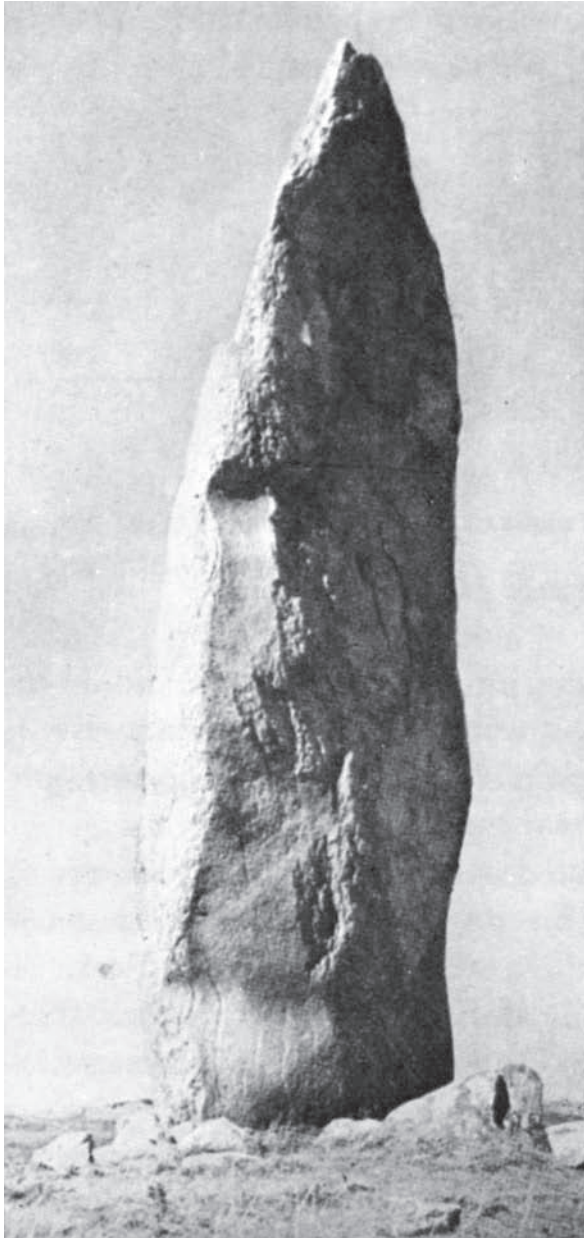
3. Menhir en la Bretaña francesa. En este área se encuentra, caído y fragmentado, el gran menhir de Locmariaquer que alcanzaba más de 22 metros de altura y sobrepasaba las 300 toneladas.

concepto de representación. Aquí postulamos que la utilidad genuina de la arquitectura consiste, precisamente, en construir lugares, en construir el mundo como un lugar hecho de lugares . Pero este proceso, que es dinámico –histórico–, contrasta con el carácter principal de la arquitectura, que es el de ser conservadora . Y en este antagonismo entre dinamismo y conservación encuentra la arquitectura la plenitud de su sentido.