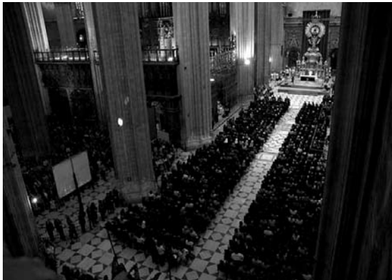
Catedral de Sevilla. Misa funeral por su SS. Juan Pablo II en abril de 2005.

vidrieras de Enrique Alemán, dos esculturas del retablo de la Inmaculada de Montañés, consolidaciones del patrimonio textil, pinturas sobre tabla de Antón Pérez de mediados del siglo XVI y la fuente de Paiva.