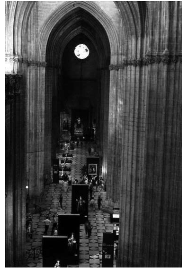
Catedral de Sevilla. Vista general de la exposición Magna Hispalensis. El Universo de una Iglesia , mayo-octubre 1992.

El éxito de la exposición, las inversiones realizadas y la experiencia adquirida permitió al Cabildo adaptar estas pautas de gestión en recursos culturales con las necesidades propias de la Catedral de Sevilla. El diseño de la gestión cultural de la Catedral tuvo en cuenta la absoluta necesidad de coordinar y compaginar la naturaleza primigenia del templo con la restauración, la conservación y mantenimiento del inmueble y sus colecciones, incentivar la investigación en sus archivos y bibliotecas, difundir y promocionar su patrimonio en jornadas de estudio, promover convenios de colaboración y, entre otros, acoger actividades culturales, musicales o académicas organizadas por otras instituciones. Además, como primer templo de la Iglesia de Sevilla se dio cabida a celebraciones de carácter extraordinario promovidas por comunidades eclesiales y asociaciones de la Archidiócesis. La Magna Hispalensis fue clave en la historia de la Catedral, porque la dotó de nuevos recorridos internos para