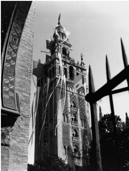
Catedral de Sevilla. Giralda engalanada con motivo de la visita de SS. Juan Pablo II el 5 de noviembre de 1985.

En la misma época la protección del patrimonio quedó reflejada en la sustitución y réplica de numerosos bienes ubicados en el exterior y perímetro de los monumentos. En marzo de 1985 la Catedral, a instancias de la Academia de Santa Isabel de Hungría, sustituyó los aldabones almohades de la puerta de Perdón por réplicas realizadas por Fernando Marmolejo y un año después se preservó la Virgen de los Olmos con otra réplica pasando los originales al interior del templo 28 .