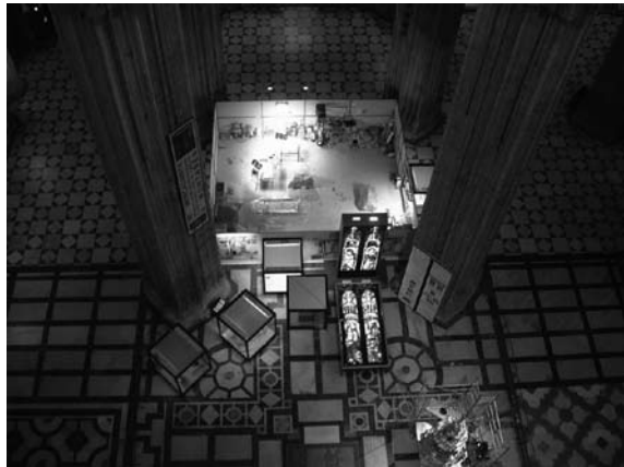
Catedral de Sevilla. Vista de la exposición De Mercadante a Montañés. Restauraciones recientes patrocinadas por el Cabildo, realizada en el trascoro de la Catedral de Sevilla en 2003-2004.

Complemento de estas actividades culturales, de las publicaciones del Cabildo y del programa de difusión han sido las “exposiciones del trascoro” y otras muestras como la titulada “El Almirante en la catedral”, dedicada a la vinculación de Cristóbal Colón y, especialmente, de su hijo Hernando Colón con la Catedral del siglo XVI. Las muestras del trascoro tienen como objetivo incentivar el patrimonio de la Catedral con micro muestras monográficas del patrimonio textil, orfebrería, instrumentos y patrimonio musical, así como dar a conocer las restauraciones de sus bienes muebles. Entre estas últimas debo mencionar por su interés la titulada “De Mercadante a Montañés” que permitió seguir directamente los trabajos de restauración del sepulcro del cardenal Juan de Cervantes, ya que el módulo taller quedó rodeado de otras restauraciones recientes en las