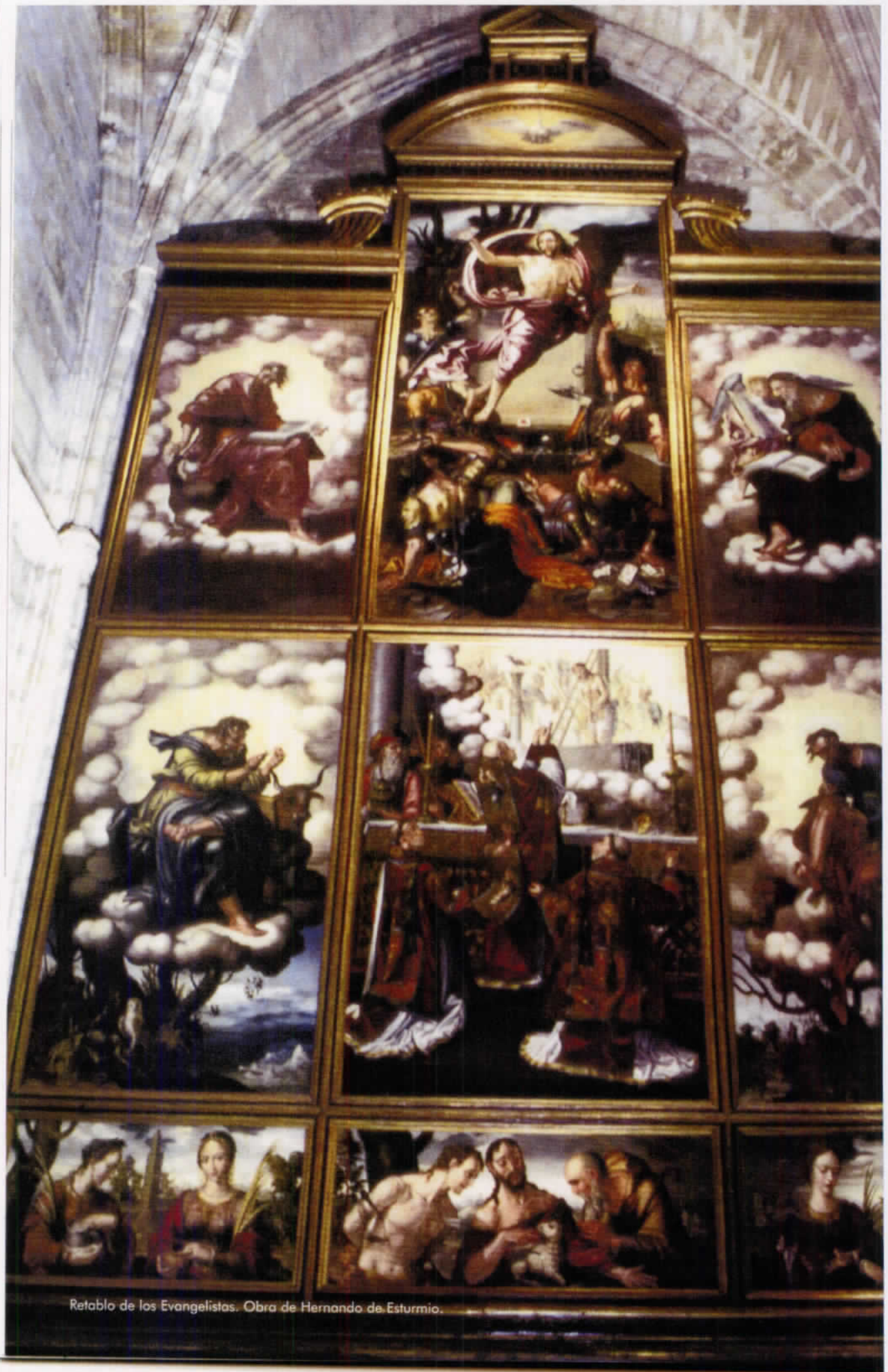
Retablo de los Evangelistas. Obra de Hernando de Esturmio.