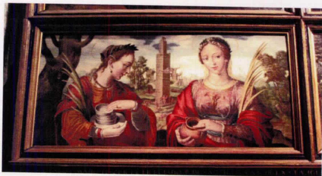
Detalle de una de las dos tablas situadas en los extremos del banco del Retablo de los evangelistas, de Hernando de Esturmio.

gen diez pinturas sobre tabla cuya iconografía y condiciones técnicas de ejecución refleja magníficamente el contrato firmado en mayo de 1553. La obra es capital en la producción manierista de este pintor afincado en Sevilla durante dos décadas y evidencia un empleo certero de los modelos italianos de influencia miguelangelesca y de sus maestros holandeses en la depurada representación del paisaje, especialmente en las escenografías arquitectónicas de las dos tablas situadas en los extremos del banco; Santa Bárbara y Santa Catalina, Santa Justa y Santa Rufina.