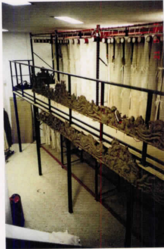
Tejidos 2001. Almacén general.