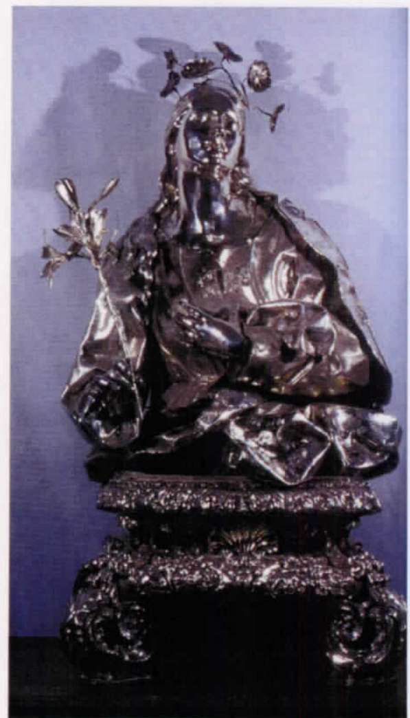
Antes y después de la restauración de la imagen de Santa Rosalía.

nicos y especialistas, la intervención aportó nuevas perspectivas para la comprensión de este pintor y su obra. Los exámenes reflectográficos, el análisis de los pigmentos, de las veladuras, permitieron conocer, entre otros, los dibujos subyacentes en las tablas de la predela y la cuadrícula preparatoria en la ejecución pictórica de los cuatro evangelistas 2 . El desmontaje del retablo deparó una interesante información sobre la hornacina originaria del testero gótico de esta capilla y del revestimiento cerámico de su altar. El Cabildo realizó además otras obras de conservación preventiva que paliaron los problemas de humedad existentes.