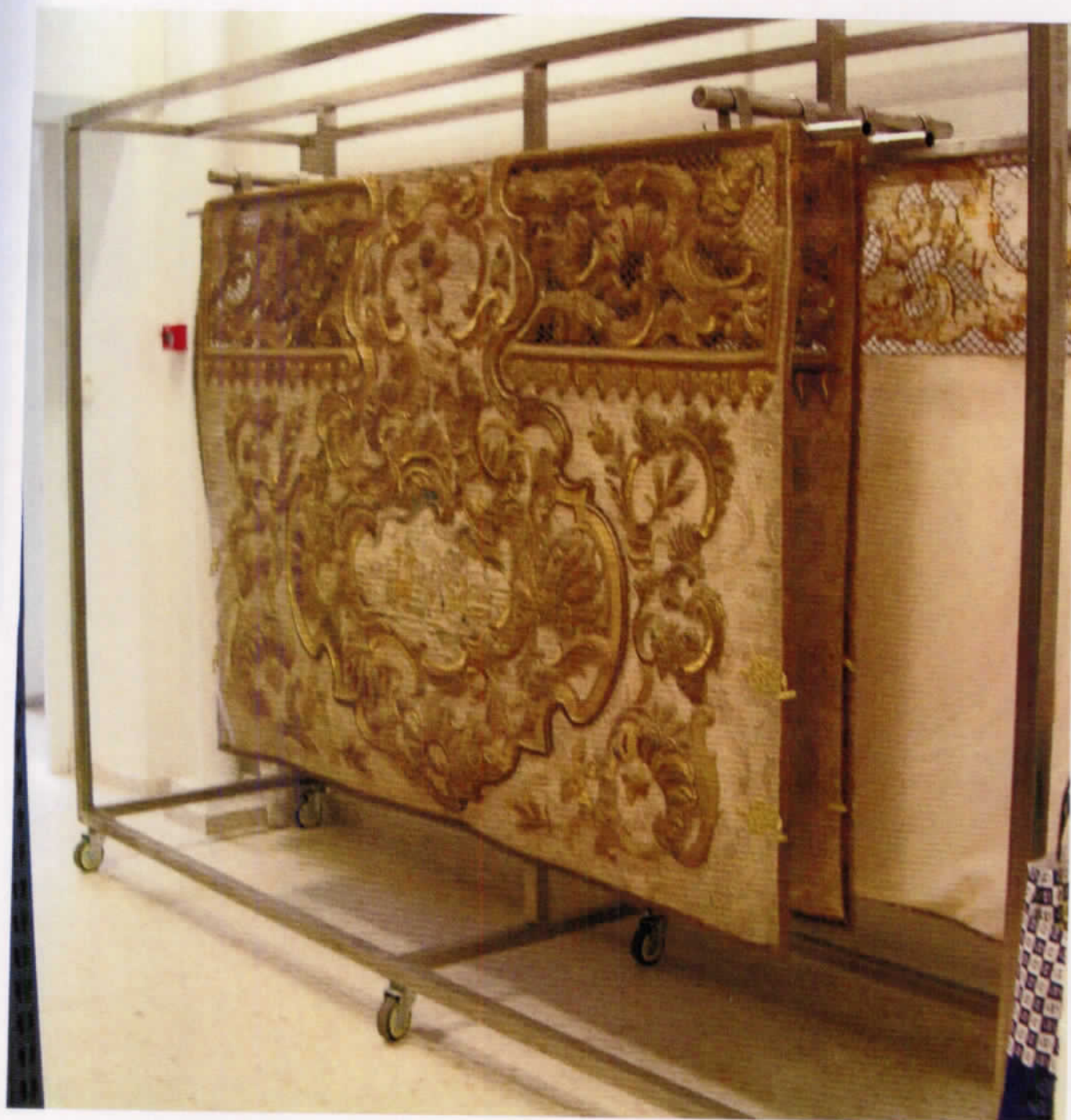
Tejidos 2003. Cesta de Paso del Corpus.

ejemplo, los tratamientos de realizados en varias capas pluviales. El manto azul de salida de la Virgen de los Reyes fue restaurado en colaboración con la Asociación de Fieles en 1904 y, recientemente, un convenio firmado con el Ministerio de Defensa llevará a cabo