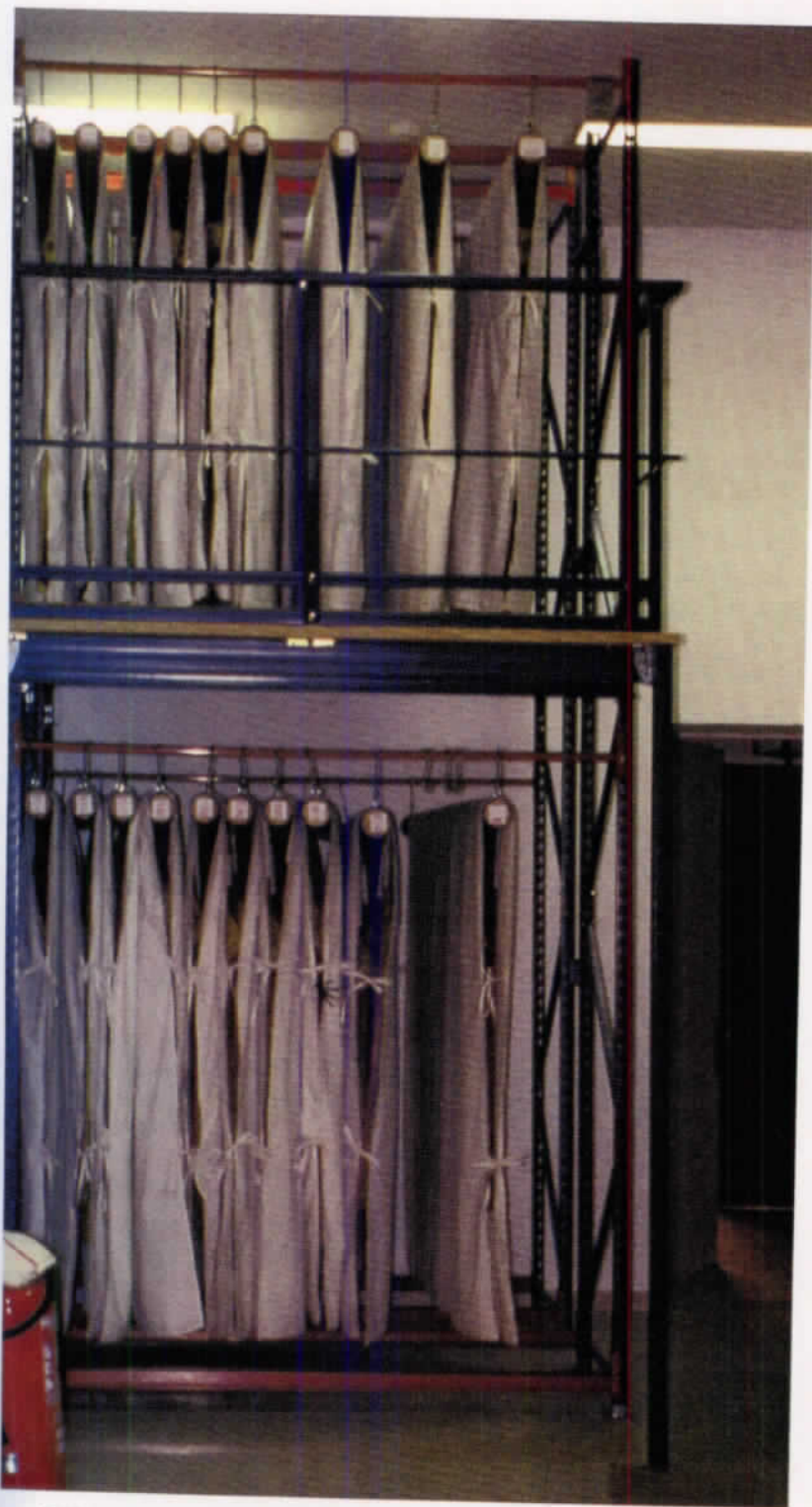
Tejidos de San Miguel a doble altura.

to, fue colocada como relleno interior del monumento; los restos óseos estudiados y clasificados, y luego depositados dentro de urna de madera, rotulada con la inscripción: "Juan de Cervantes (+1453). Apertura de la sepultura 18 de septiembre de 2003, cierre de la sepultura 15 de abril de 2004".