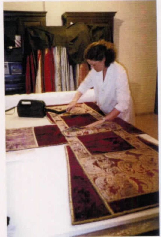
Trabajando en la limpieza de textiles.

que permitieron ver la existencia de líneas rectoras para los trazados reguladores de todos los elementos arquitectónicos y decorativos, semejantes a los constatados en otras obras de la misma época y a las montañas localizadas en los doseletes de la Puerta del Nacimiento y del Baptisterio de la Catedral de Sevilla. El sepulcro originariamente estuvo policromado, parcialmente, al igual que otras obras contemporáneas, ya que se encontraron restos de pigmento azul y pan de oro en el rico paño que cubre el túmulo y cuyos bordados talló, magníficamente, Lorenzo Mercadante 3 .