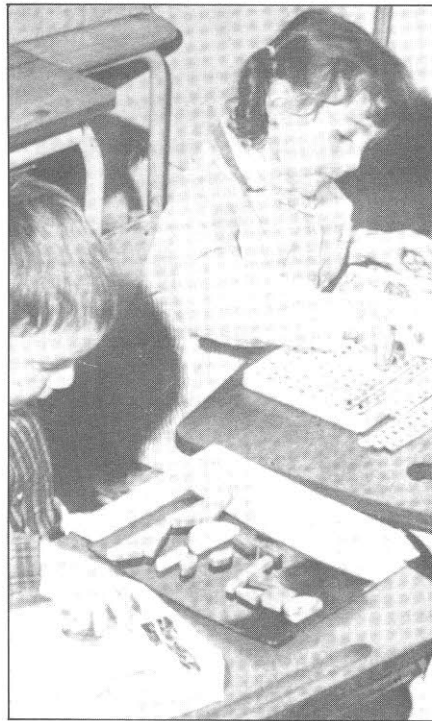
Hay que disponer de juegos reeducativos especiales.

No hay grupo control, es el mismo grupo experimental el que hace de control de sí mismo.