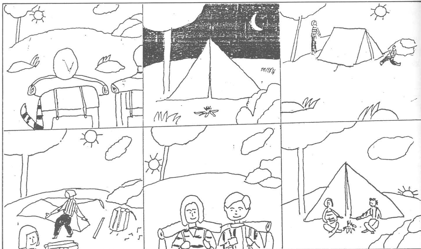
Fíjate bien. Es una historia desordenada. Debes ordenarla y contar lo que sucede.