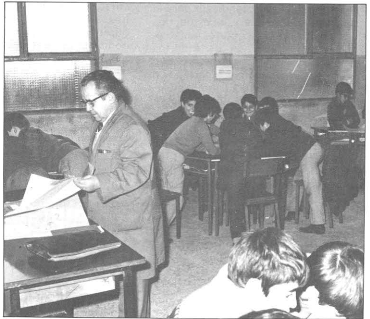
El profesor de apoyo debe entenderse como un especialista en recuperación escolar.

Los gabinetes psicopedagógicos municipales organizan clases de apoyo al ciclo inicial y medio y, clases de reeducación específica del lenguaje (dislexia, ... etc.), con alumnos del ciclo medio y superior.