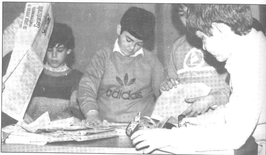
El grupo será poco numeroso y mixto con alumnos de buen rendimiento.

— Que cada alumno de ciclo medio e inicial, con dificultades, dominen lo