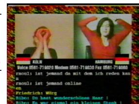
Piazza Virtuale , Van Gogh TV-Pontoon European Medialab Art

Sí sería nuevo, sin embargo, el ciclo que generan los medios, el que suscita una manera de organizar nuestra forma de conocer y experimentar el mundo a través de las imágenes. Una experimentación donde el pensamiento sería sustituido por proyecciones e identificaciones, el presente por pasado, y la sensación de pensamiento veloz desmantelada por el descubrimiento de una estructura (no reflexiva) repleta de ideas preconcebidas. Nueva esta forma de pensamiento que irradia la cultura visual, en cuyo contexto se producen tanto televisión como Internet, y en cuya trama hemos de plantear toda reflexión contemporánea sobre la televisión.