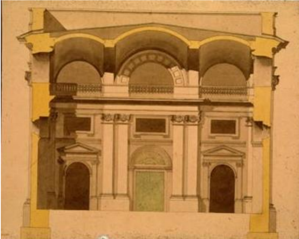
Imagen 5. Alzado de la tribuna de los pies, de 1786