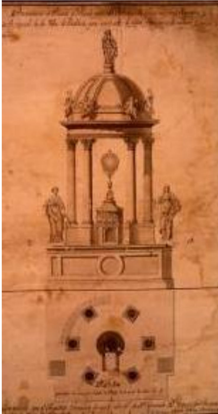
Imagen 6. Proyecto de tabernáculo para la capilla mayor, de 1816