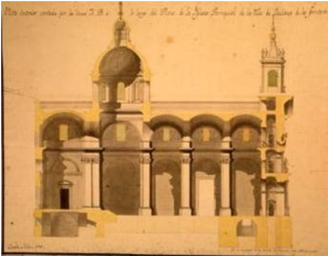
Imagen 3. Sección longitudinal, de 1786