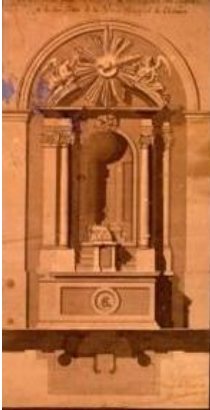
Imagen 7. Proyecto de retablo para las capillas, de 1816