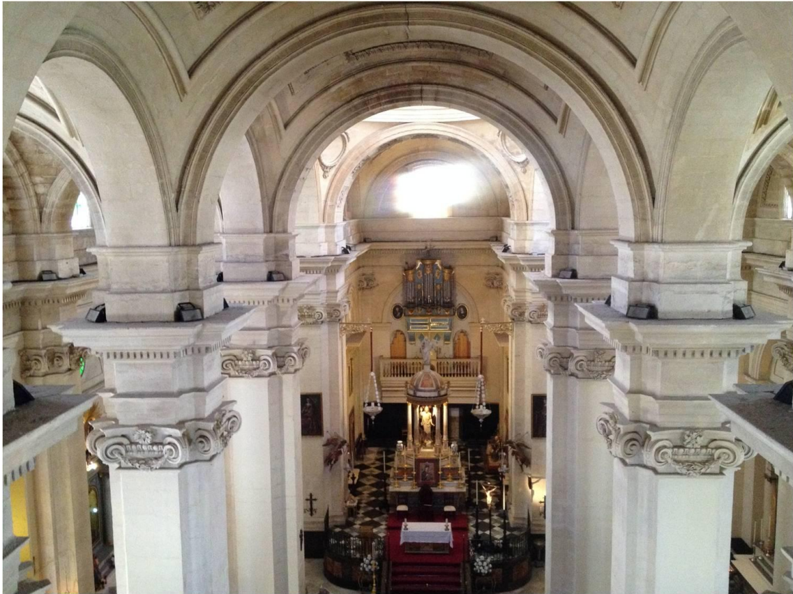
Imagen 4. Nave central con pilares y bóvedas