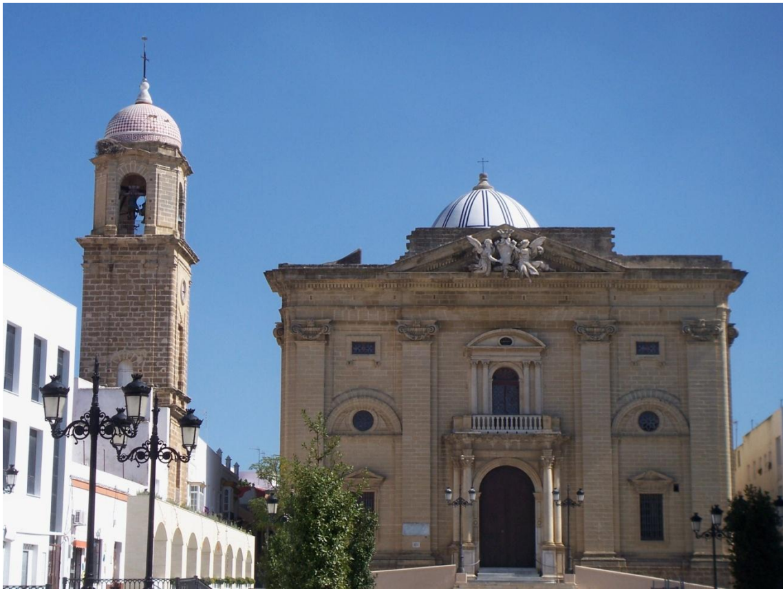
Imagen 1. Fachada principal y Torre del Reloj