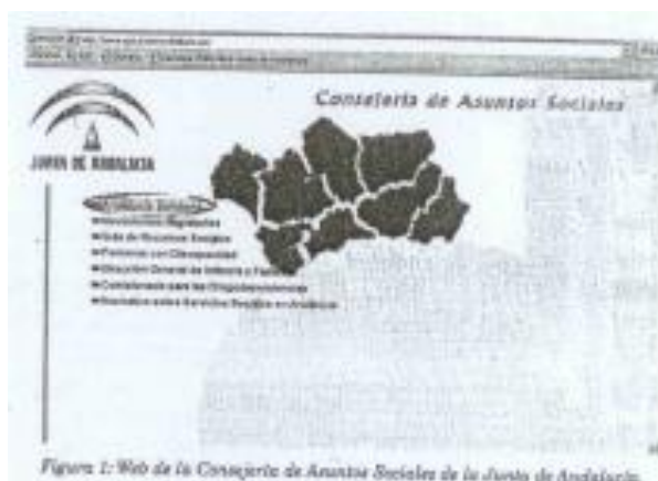
Figura 1: Web de la Consejería de Asuntos Sociales de la Junta de Andalucía.

A través de esta web, podemos tener acceso a otras, con las que seguir completando nuestra información, como ejemplo incluimos en la figura 2, el acceso a la página Andalucía Solidaria