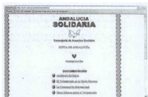
Figura 2: Andalucía Solidaria.

Url, en la que podemos encontrar, además de enlaces a otras páginas que tienen relación con el tema, información acerca del movimiento “Andalucía Solidaria”, el tema del voluntariado en la unión europea y cooperación internacional.