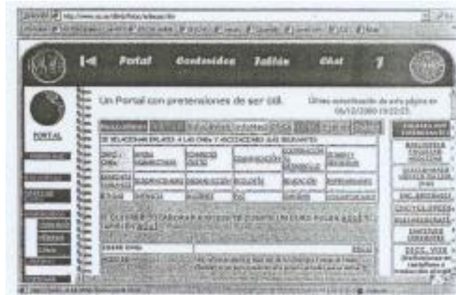
Figura 3: Url: http://www.us.es/dfmb/fisioc/portal.htm

En la Figura 3, presentamos un ejemplo de página, creada por iniciativa personal, concretamente una web de profesores de la Facultad de Medicina de la Universidad de Sevilla, en la que además de los temas relacionados con su especialidad, incluyen aspectos relacionados con el voluntariado.