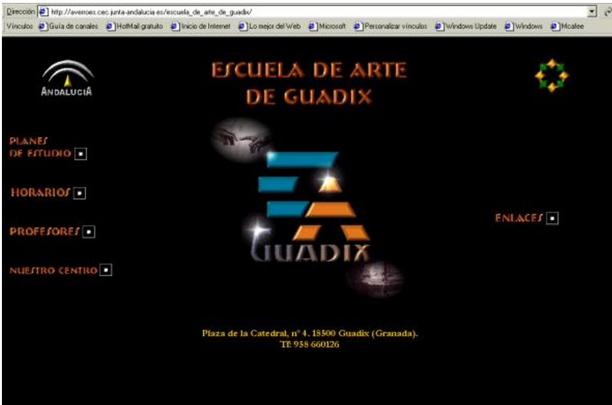
Figura 9. http://averroes.cec.junta-andalucía.es/escuela_de_arte_de_quadix/