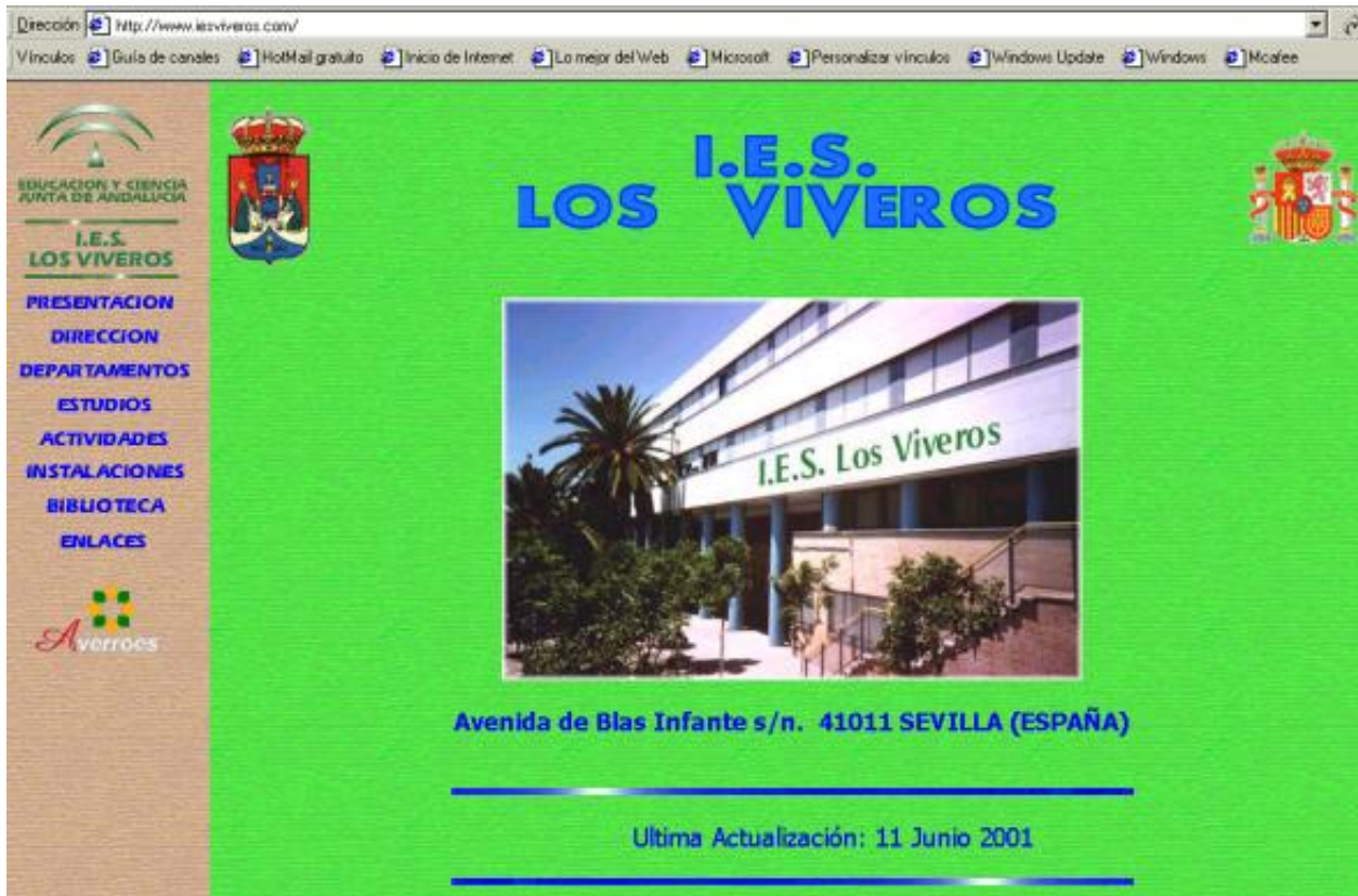
Figura 6. http://iesviveros.com