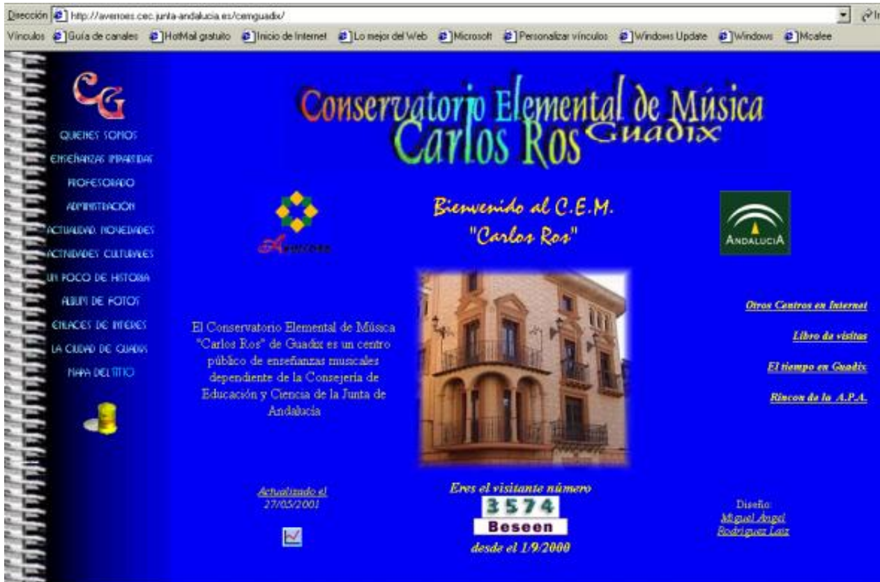
Figura 8. http://averroes.cec.junta-andalucía.es/cemquadix/