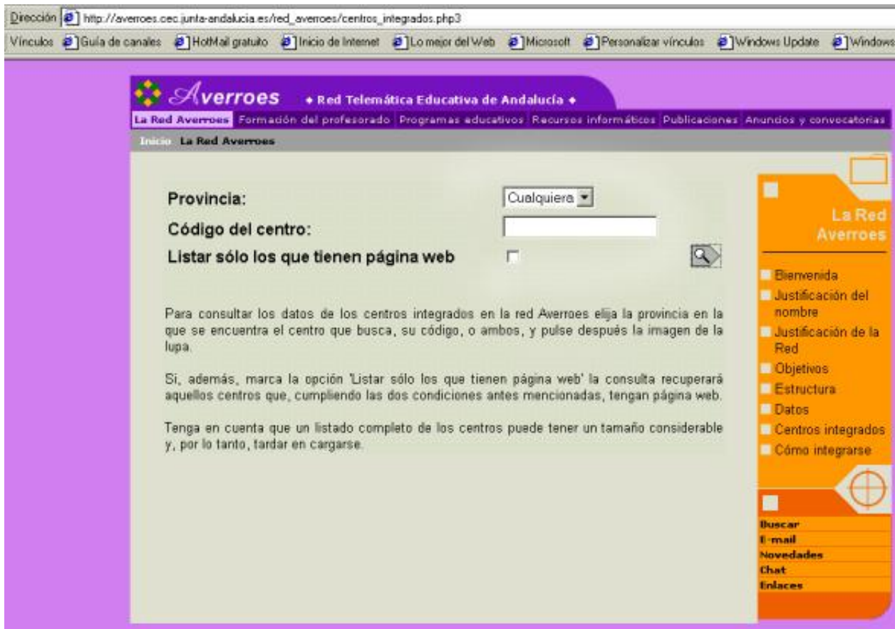
Figura 4. http://averroes.cec.junta-andalucía.es/red_averroes/

pero si lo que buscamos, es un centro en concreto, también nos ofrece la posibilidad de acceder a través del buscador, en el que podemos acceder a la búsqueda bien introduciendo el código del centro, bien la provincia en la que se encuentra.