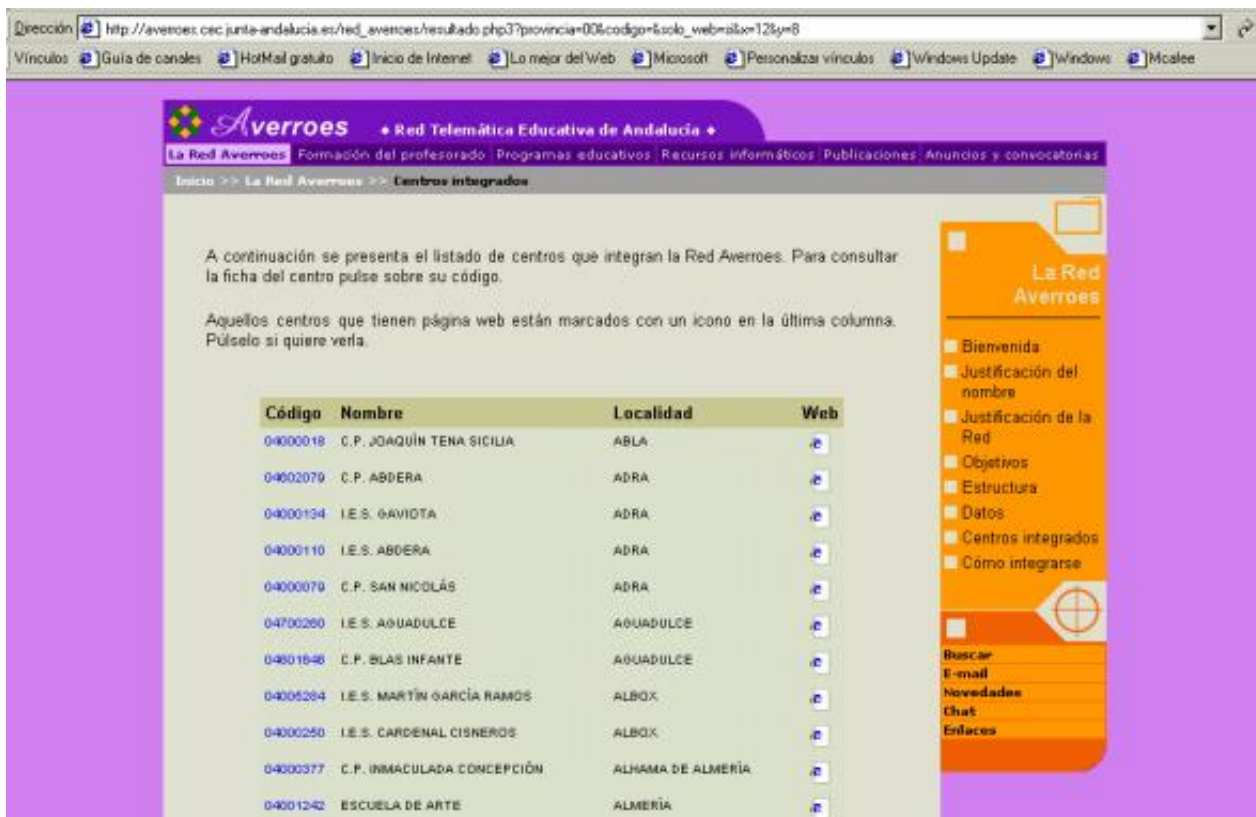
Figura 5. http://averroes.cec.junta-andalucía.es/red_averroes/centros_integrados.php3

pero si lo que buscamos, es un centro en concreto, también nos ofrece la posibilidad de acceder a través del buscador, en el que podemos acceder a la búsqueda bien introduciendo el código del centro, bien la provincia en la que se encuentra.