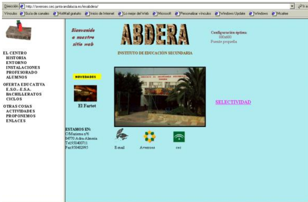
Figura 7. http://averroes.cec.junta-andalucia.es/iesabdera/