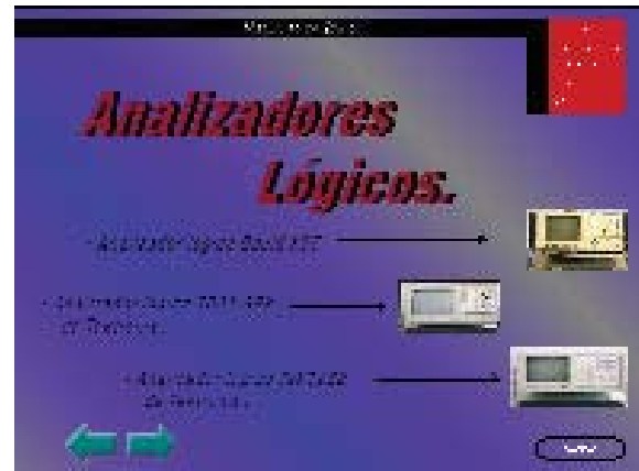
Figura 4: Manuales de Equipo.