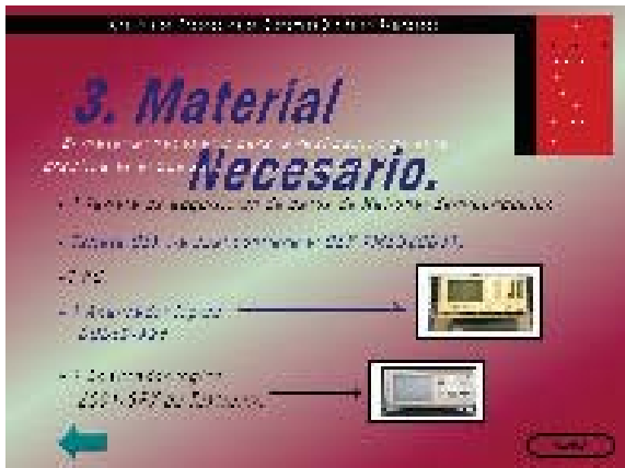
Figura 3: Pantalla práctica 5.