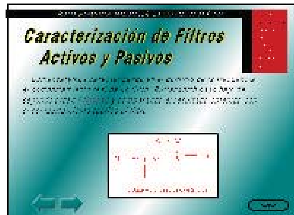
Figura 2: Pantalla de la práctica 3.