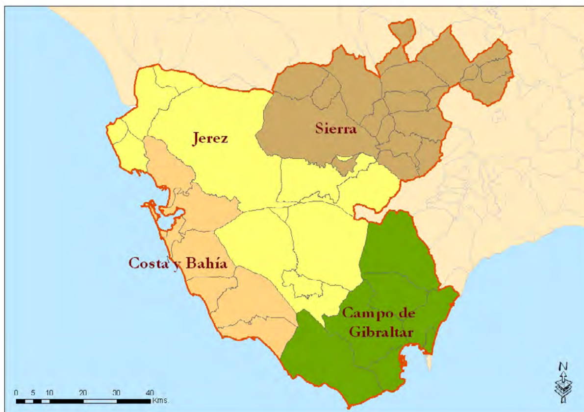
Mapa 2. Delimitación de la propuesta del Plan Director Territorial de Coordinación de Andalucía de 1978.