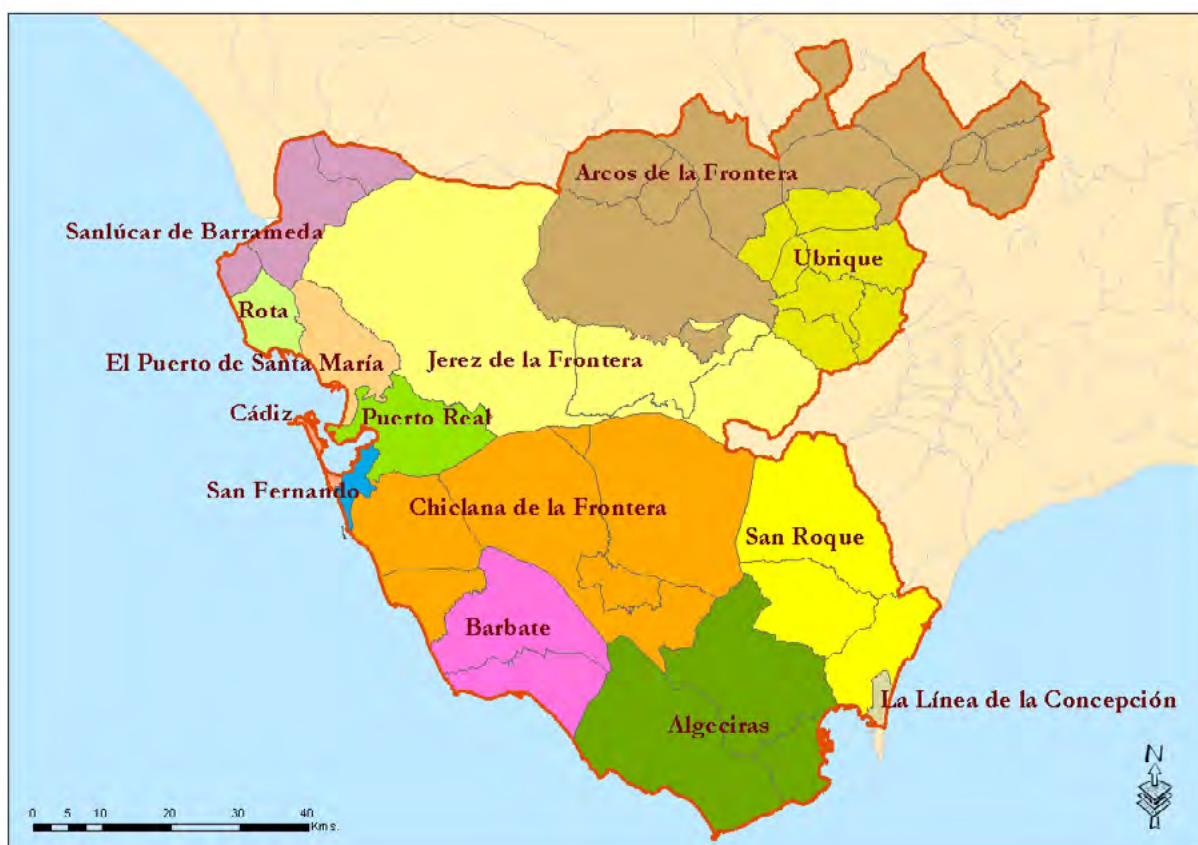
Mapa 9. Delimitación de los partidos judiciales en Cádiz.