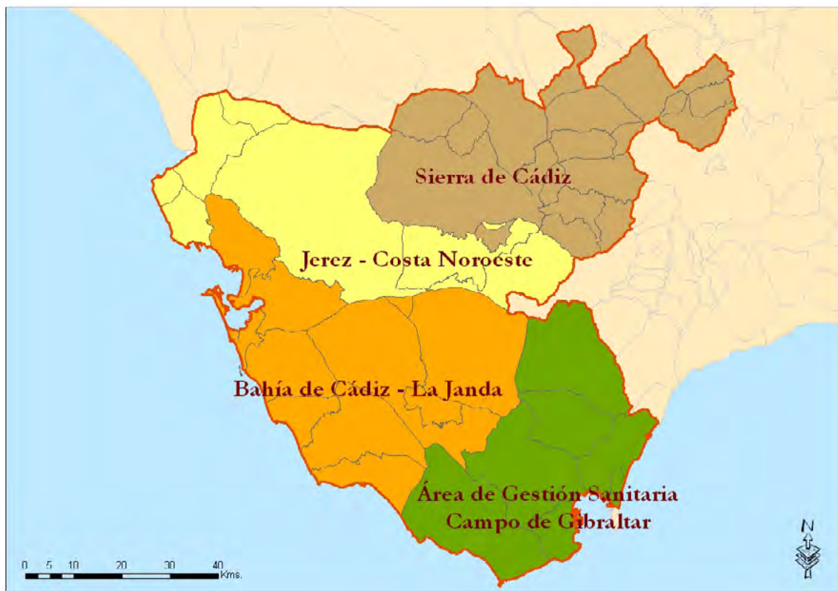
Mapa 11. Delimitación de los distritos de atención primaria.