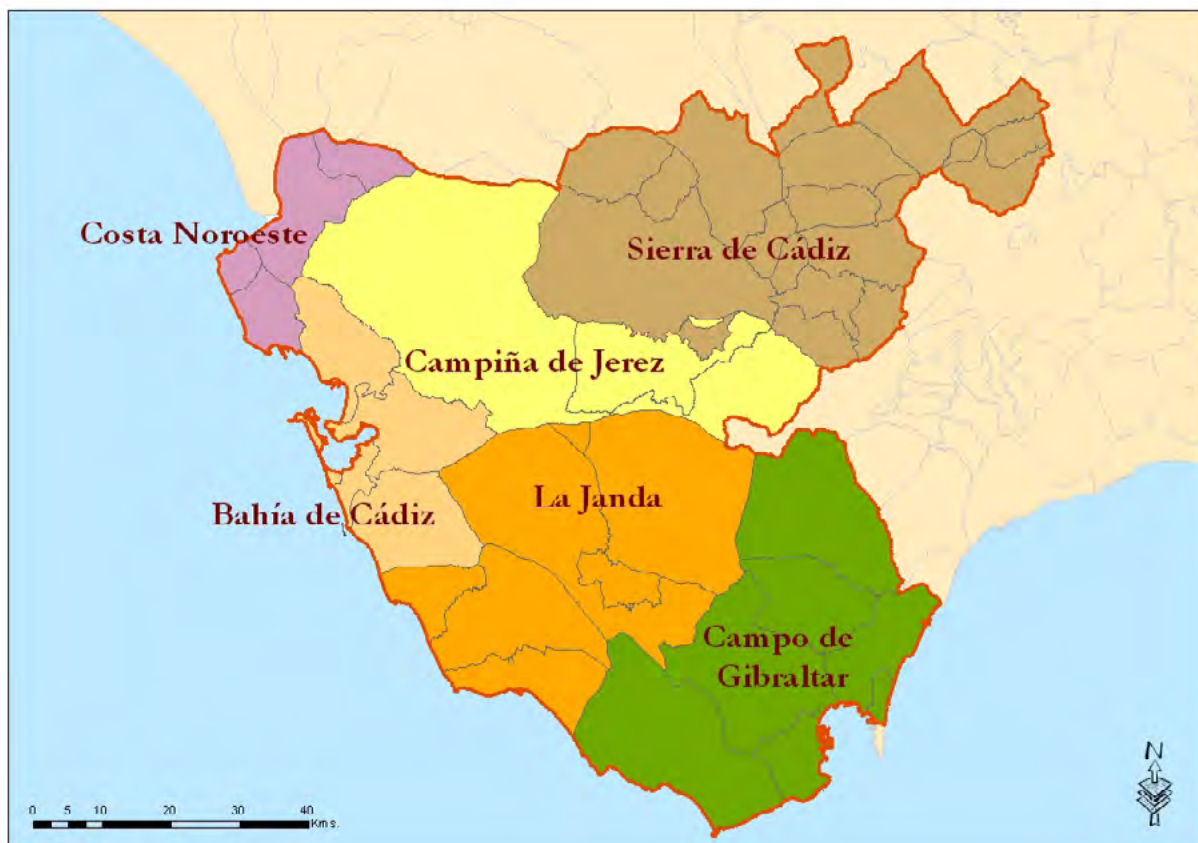
Mapa 7. Delimitación del Informe de Desarrollo Territorial de Andalucía (IDTA) y según Conocer Andalucía GEA XXI .