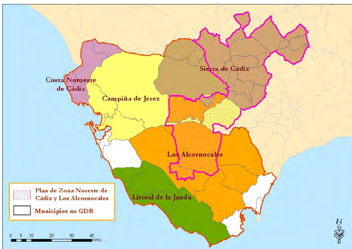
Mapa 17. Delimitación de los grupos de desarrollo rural.