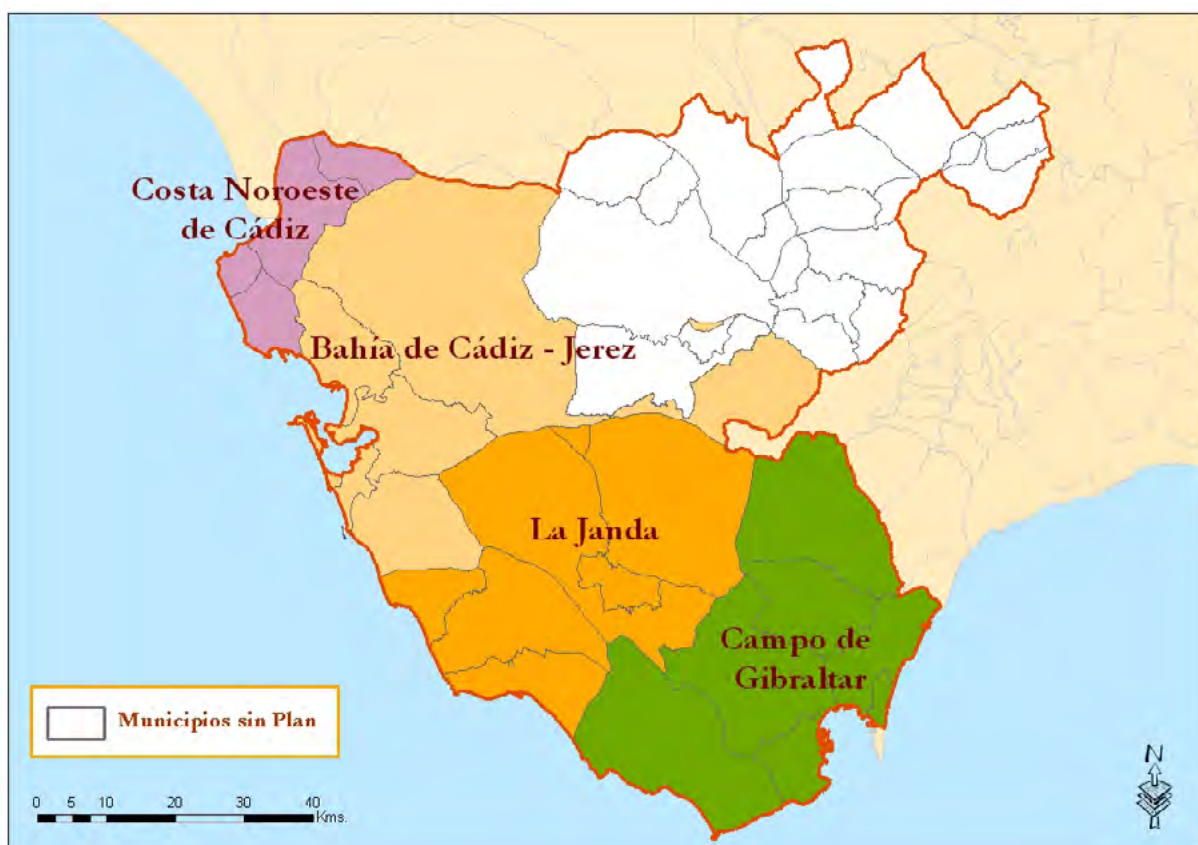
Mapa 19. Delimitación de los planes de ordenación del territorio de ámbito subregional.