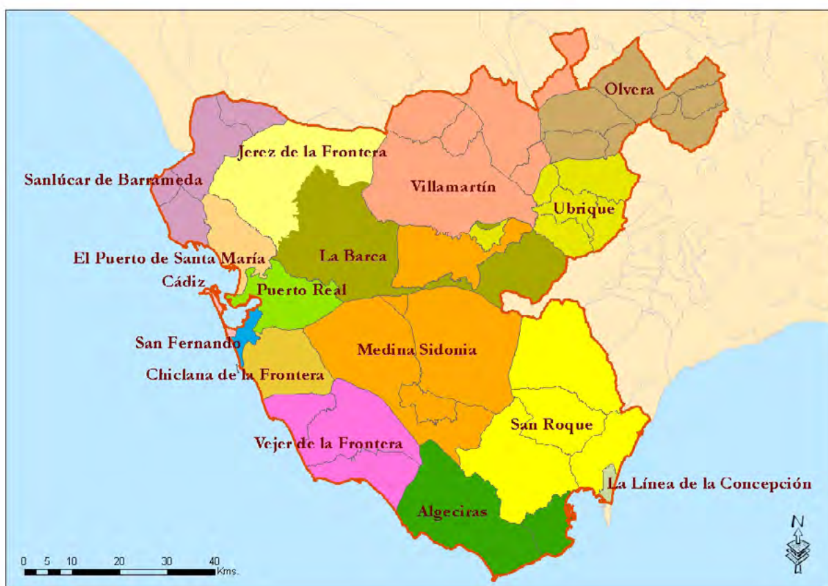
Mapa 14. Delimitación de las unidades territoriales de empleo, desarrollo local y tecnológico.