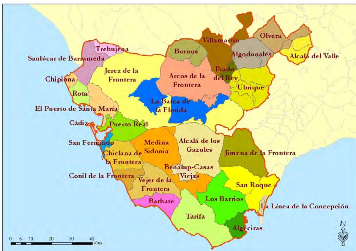
Mapa 10. Delimitación del mapa escolar.

Fuente: Elaboración propia a partir de Datos Espaciales de Referencia de Andalucía (DERA, 2013).