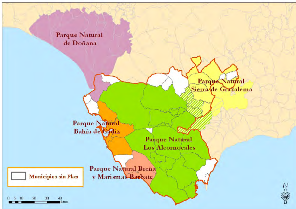
Mapa 18. Delimitación de las áreas de influencia de los planes de desarrollo sostenible.