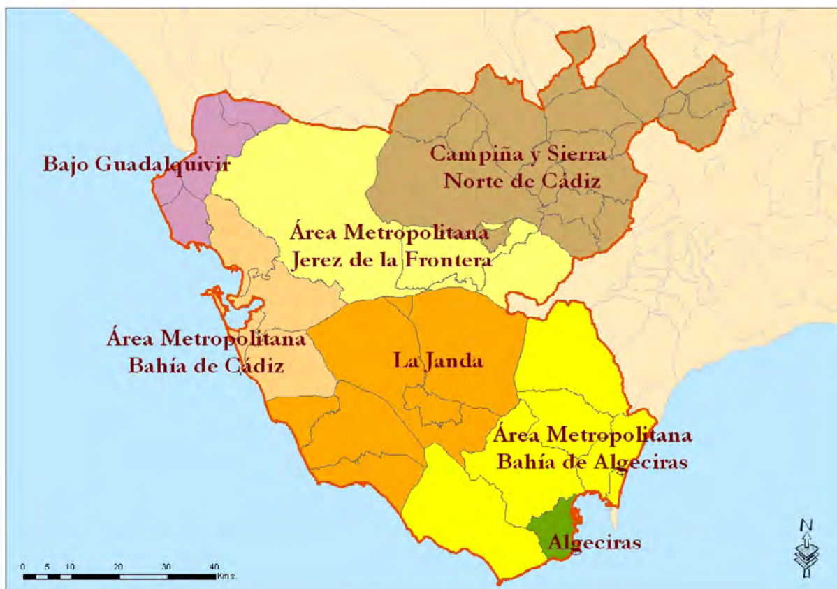
Mapa 16. Delimitación de las demarcaciones deportivas.