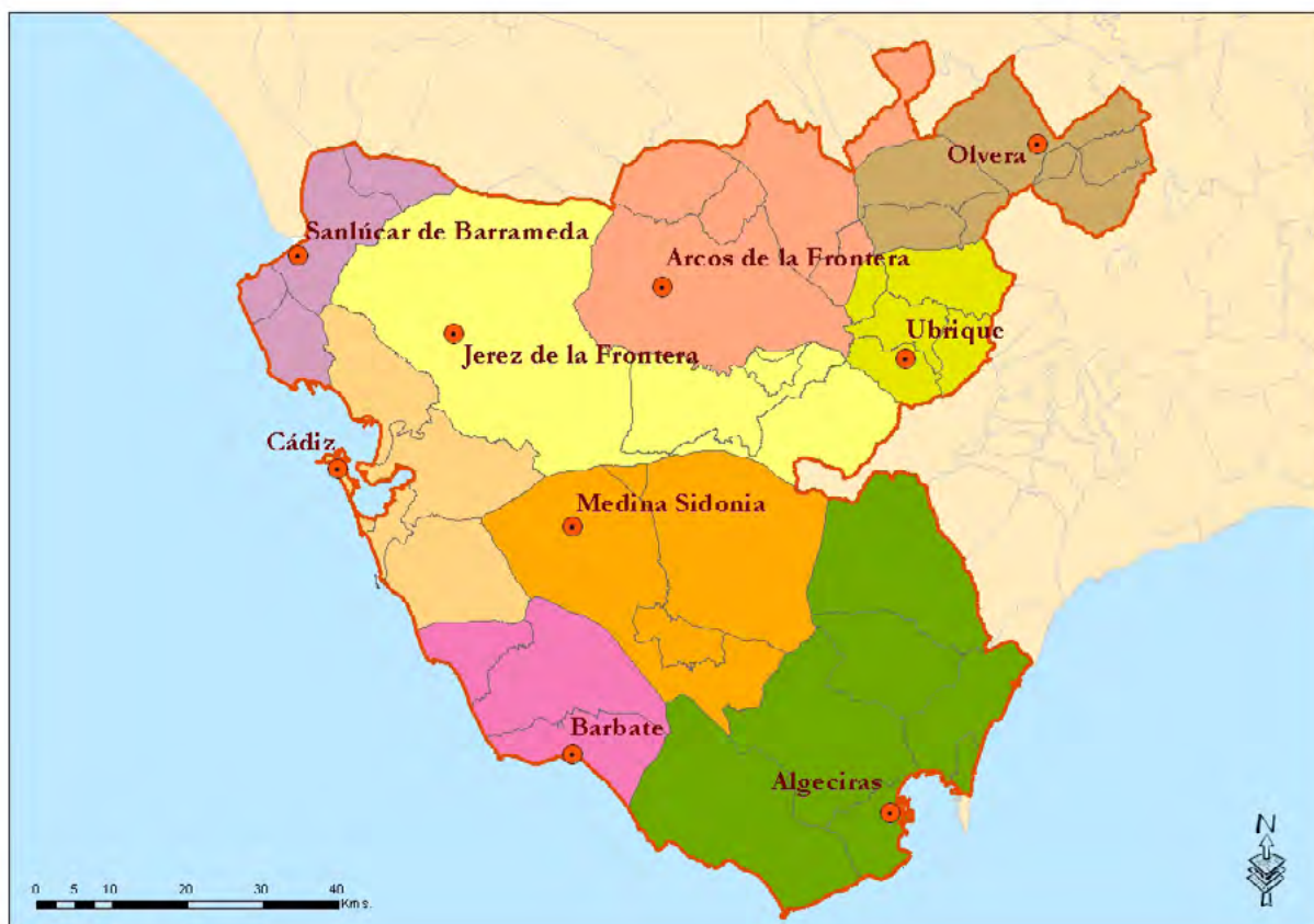
Mapa 6. Delimitación de las Bases para la Ordenación del Territorio de Andalucía de 1990.