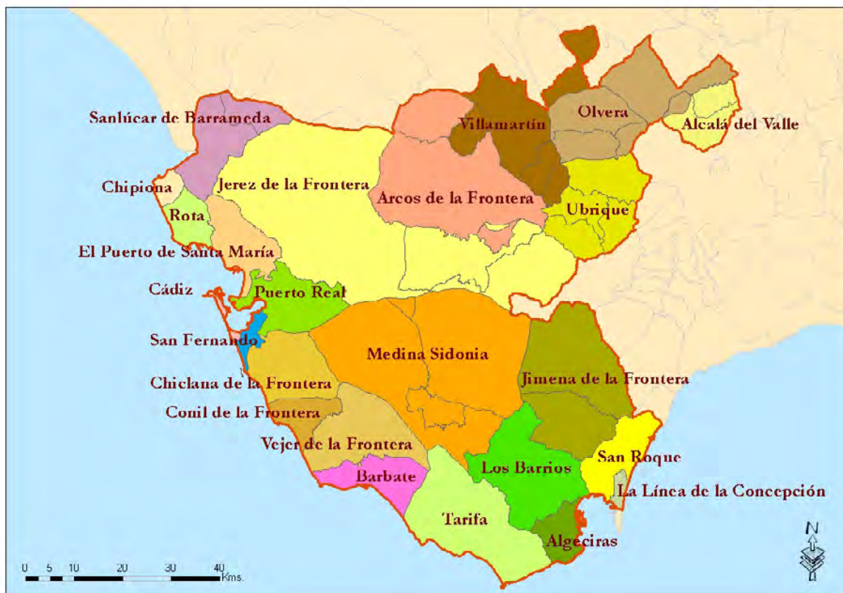
Mapa 12. Delimitación de las zonas básicas de salud.