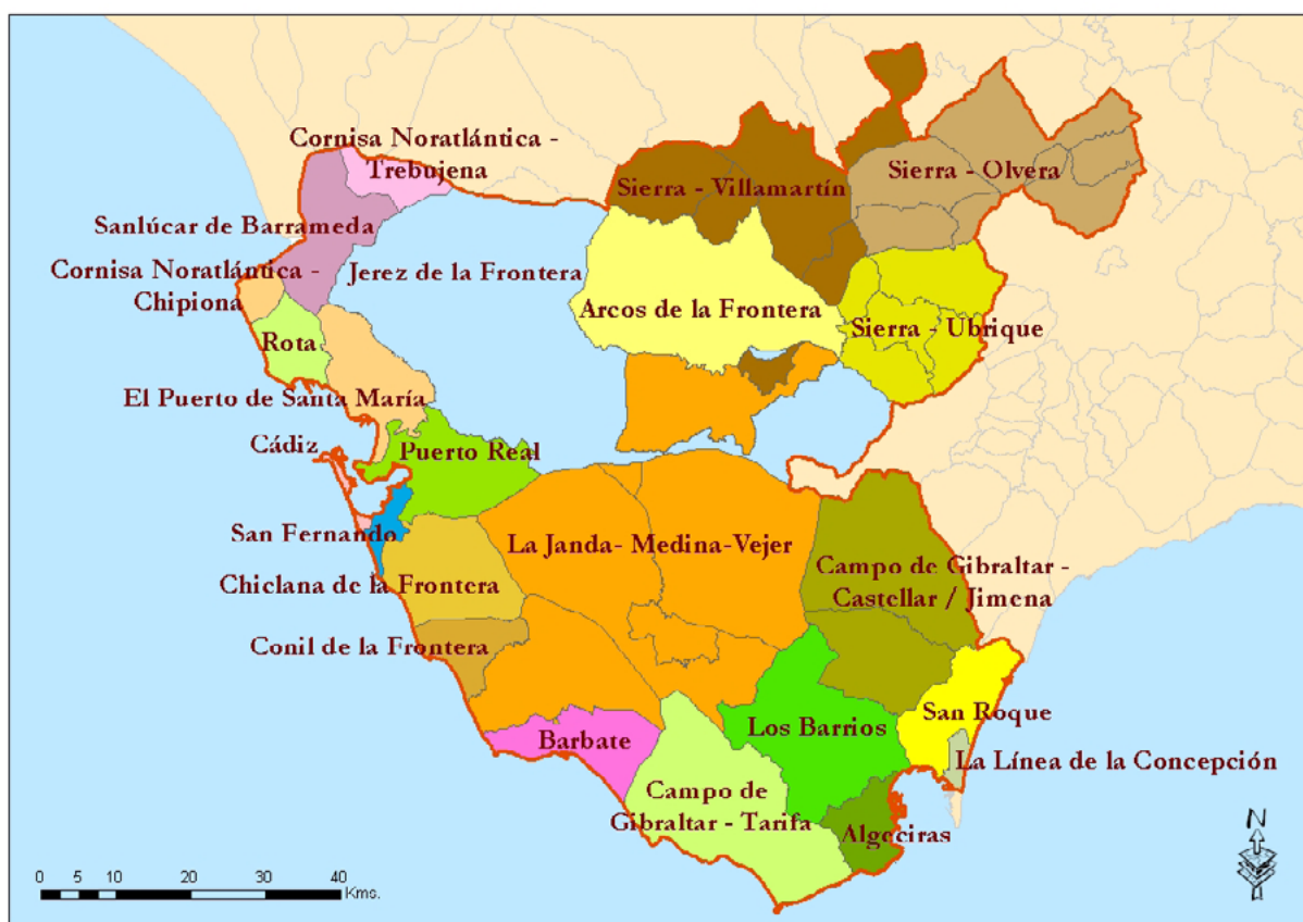
Mapa 13. Delimitación de las zonas de trabajo social.