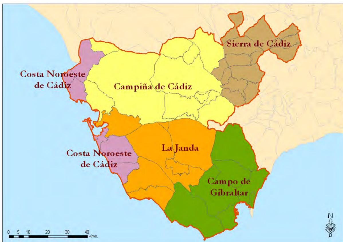
Mapa 3. Delimitación de las comarcas agrarias de 1978.