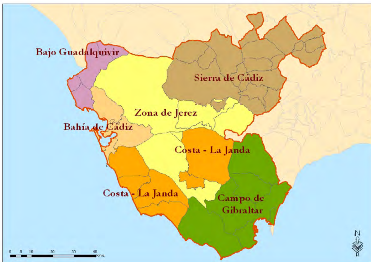
Mapa 15. Delimitación de las áreas territoriales de empleo.