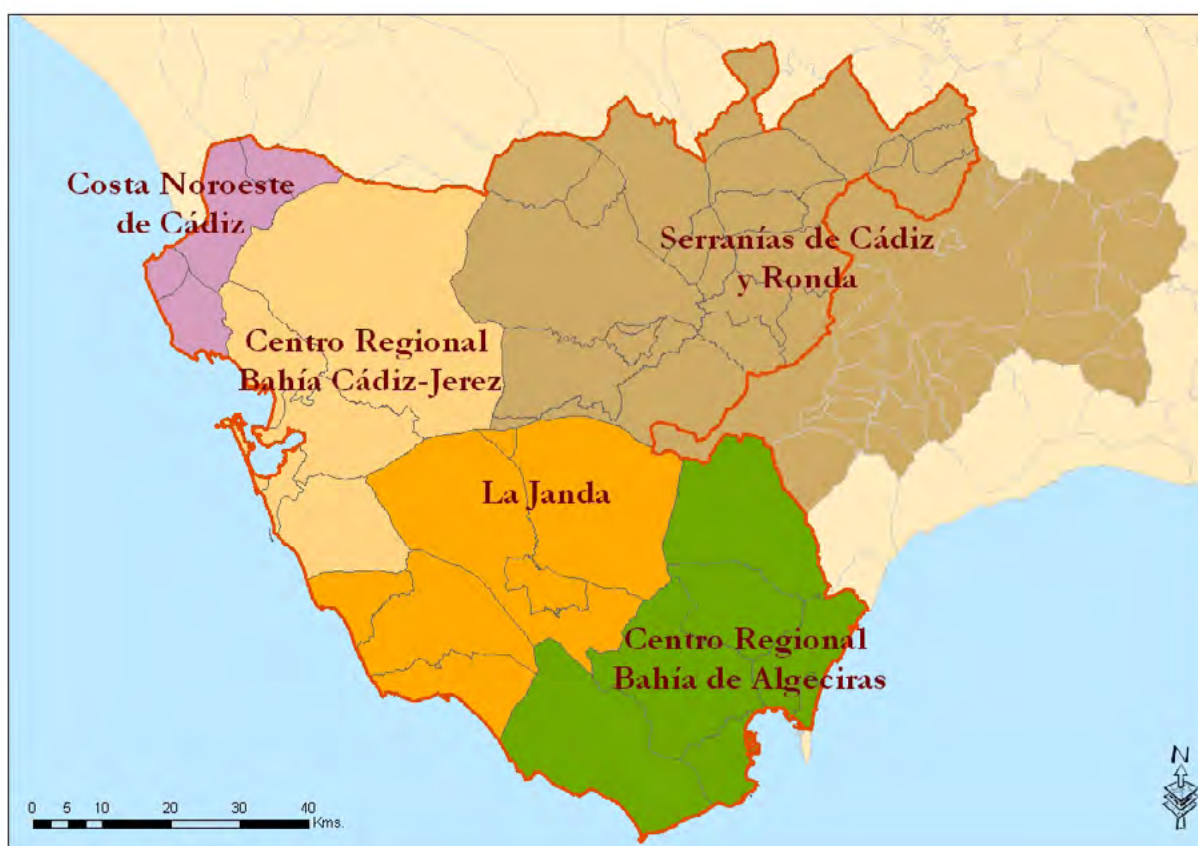
Mapa 8. Delimitación del Plan de Ordenación del Territorio de Andalucía de 2006.