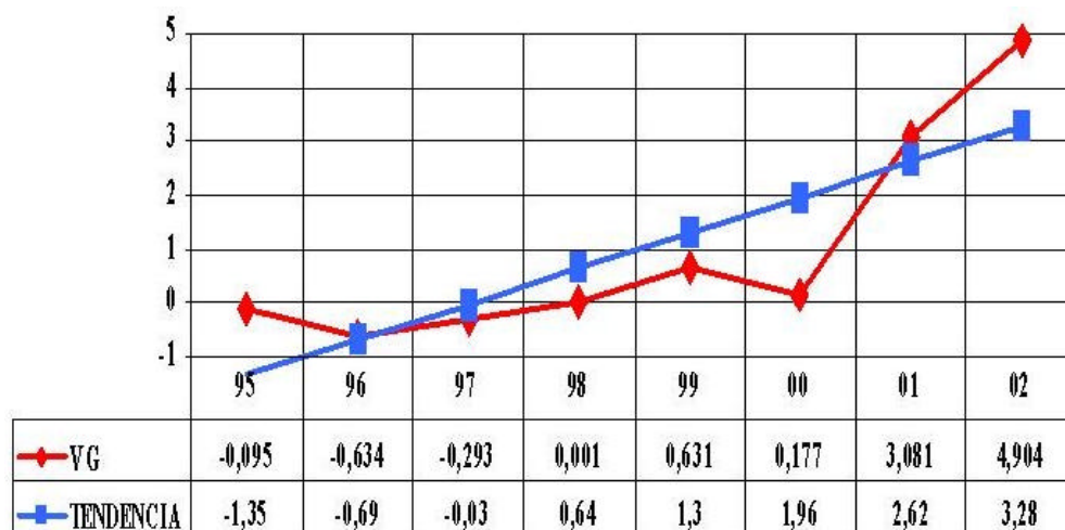
Figura 2. Evolución de las medias de los valores genéticos directos para el peso a los 180 días de los terneros Retintos. (Evolution of the average direct genetic values for weight at 180 days of age for Retinta calves).

Para poder aproximarnos a una estimación de la proyección económica de la mejora de la raza bovina en la cabaña ganadera podríamos analizar los