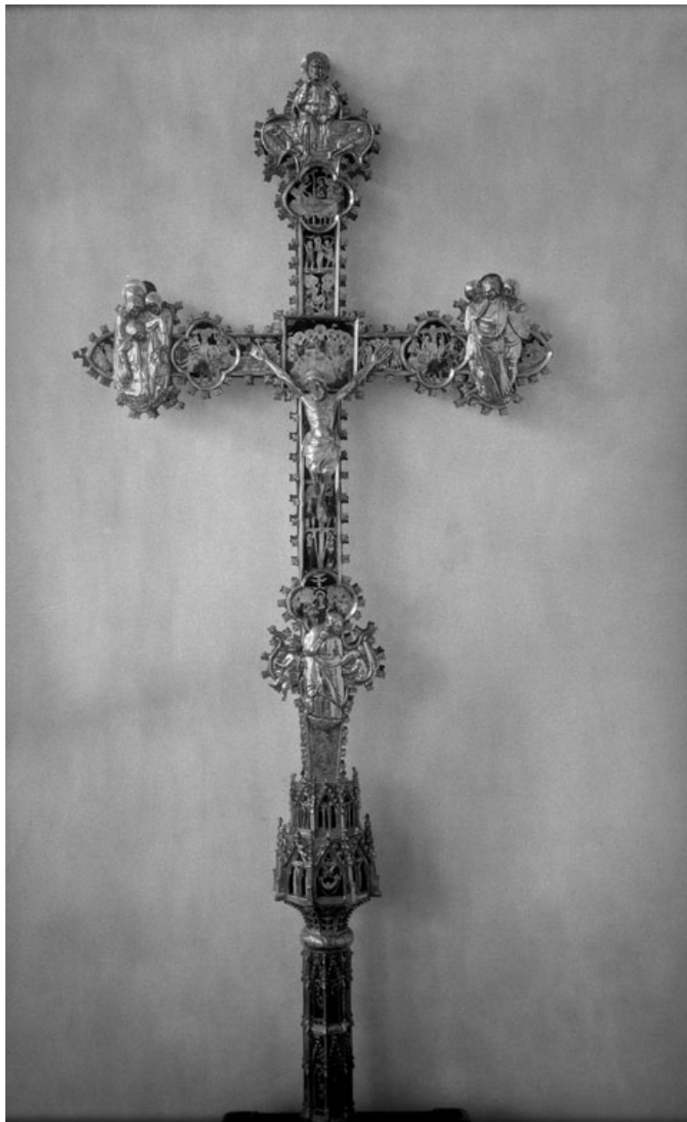
Figura 1. Atribuida a Pere Bernés. Cruz de la colegiata de Xàtiva (c. 1380).