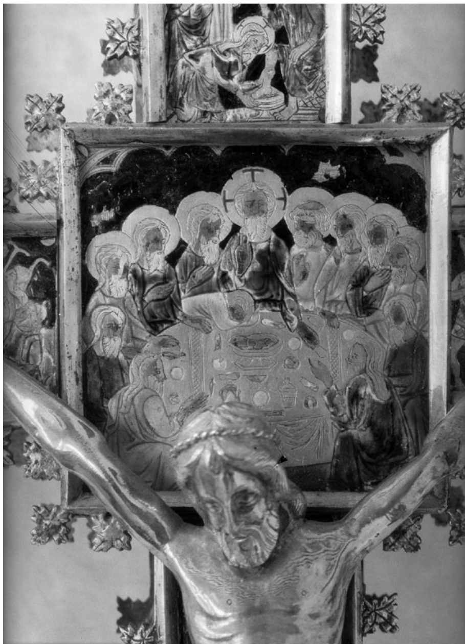
Figura 9. Atribuido a Pere Bernés, Última Cena de la Cruz de Xàtiva (c. 1380).