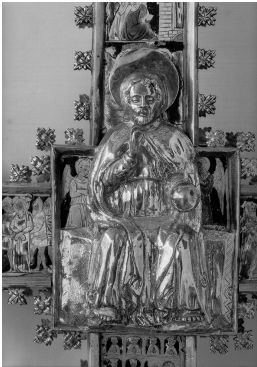
Figura 3. Atribuido a Pere Bernés: Pantocrátor de la Cruz de Xàtiva (c. 1380).