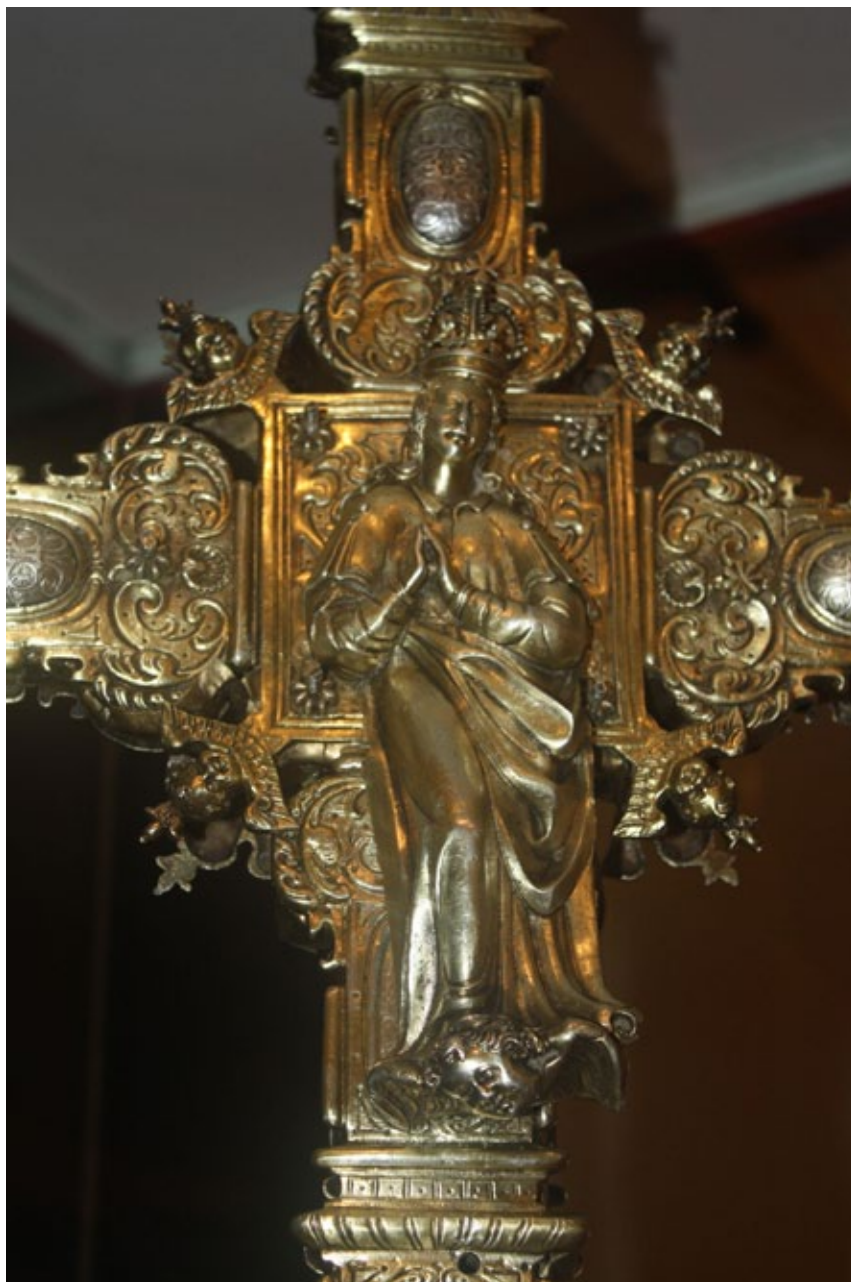
Figura 6. Anónimo, Asunción de la Cruz de Denia (1625).