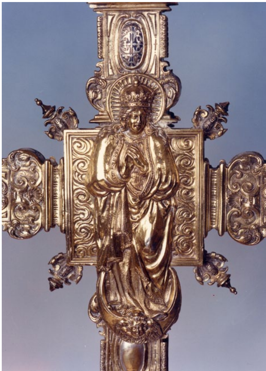
Figura 7. Simó de Toledo, Asunción de la Cruz de Carcaixent (1645).