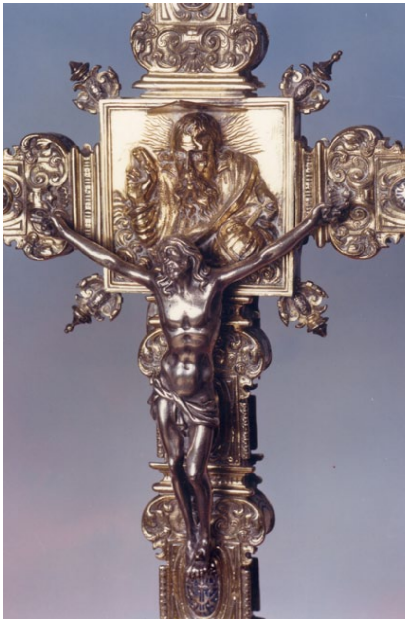
Figura 4. Simó de Toledo, Padre Eterno y Crucificado de la Cruz de Carcaixent (1645).