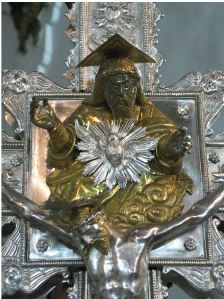
Figura 5. Anónimo, Trono de Gracia de la Cruz de la Parroquia del Pilar y San Lorenzo de Valencia (c. 1625).