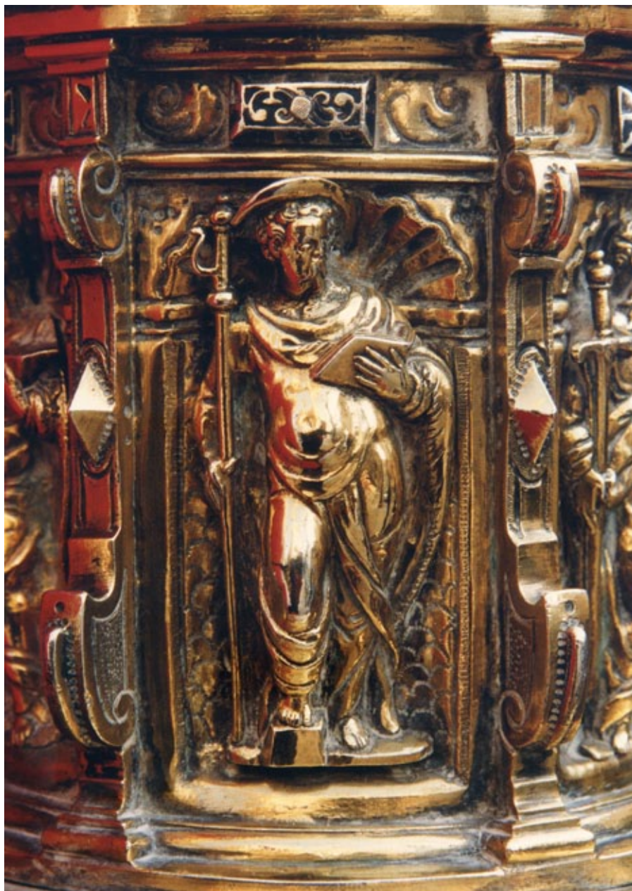
Figura 8. Simó de Toledo, Santiago el Mayor de la Cruz de Carcaixent (1645).