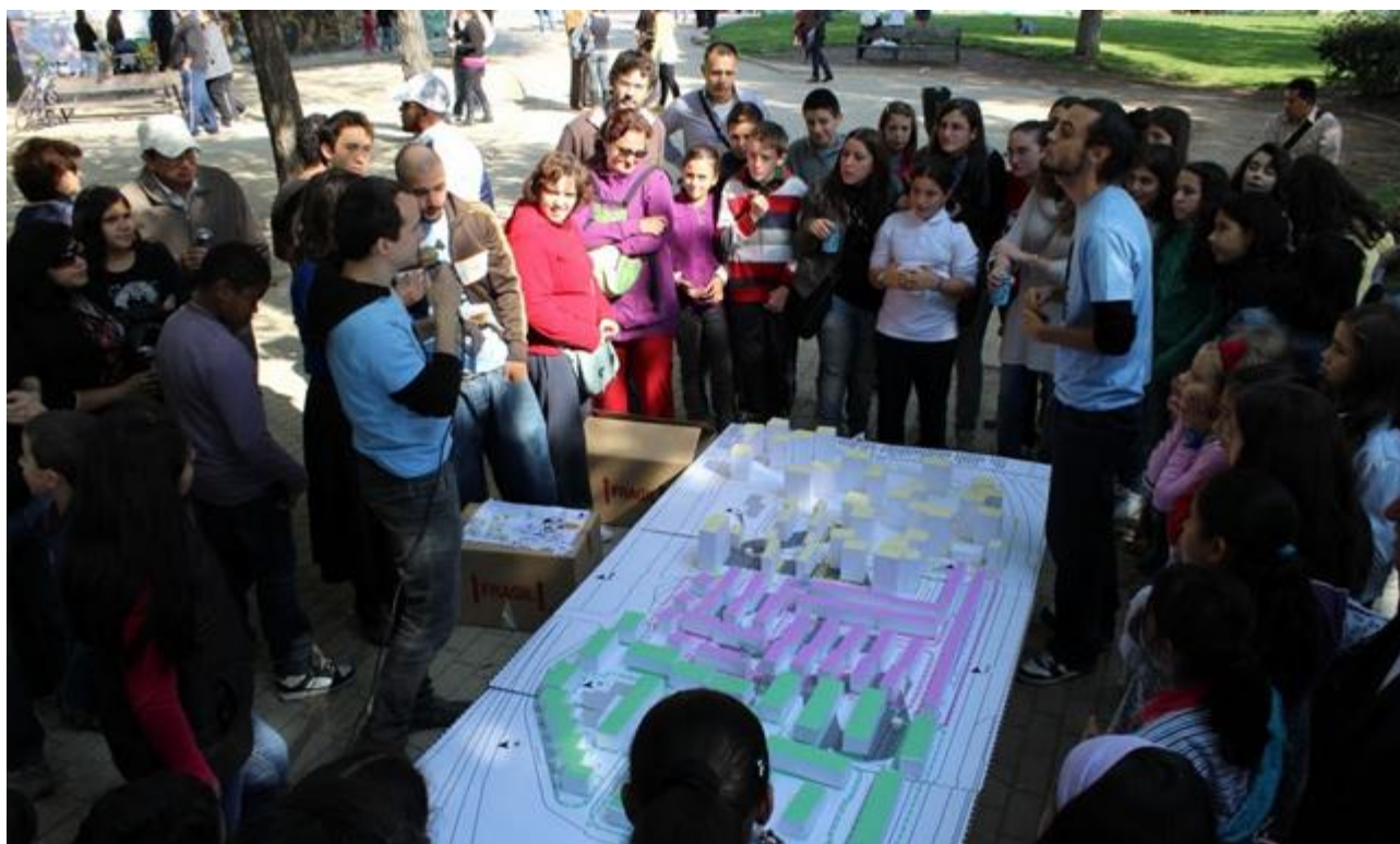
Figura 5. Imagen de la “Fiestación” durante el desarrollo del juego de mesa gigante “Trivial de VdB”, una actividad lúdico-pedagógica sobre estrategias para la regeneración urbana del barrio.

momento, los aspectos de difusión y ciudadanía habían resultado prioritarios y necesarios: constituían la base sobre la que empezar a construir. Una vez asentados los cimientos y tras la recogida de información a través de las actividades realizadas, las reuniones posteriores permiten consensuar las líneas estratégicas básicas sobre las que discurrirá el proyecto. La necesidad de potenciar el uso del espacio público, hecho que la “Fiestación” había dejado patente, desemboca en la línea estratégica de intervención en los espacios interbloque, una de las principales deficiencias del tejido, y al mismo tiempo, el gran potencial del barrio. La mejora en el ámbito de la diversidad de actividades, como solución a su condición de barrio dormitorio, conforma la línea estratégica de reactivación económica. Finalmente, la situación de aislamiento que sufre con respecto a su entorno próximo plantea la estrategia de bordes urbanos como otra de las necesidades primarias.