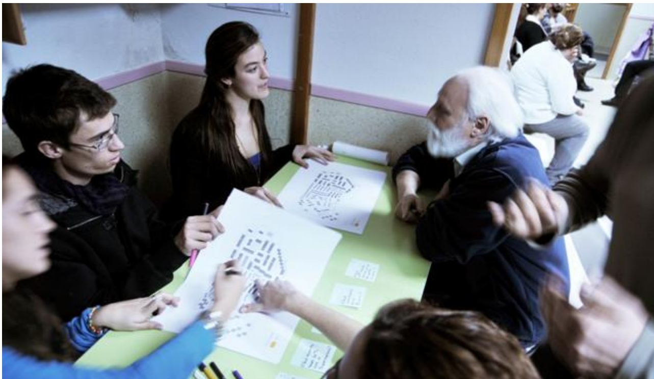
Figura 1. “Facilitadores del diseño ciudadano”. Taller de diseño colaborativo entre vecinos del barrio Virgen de Begoña (Madrid) y alumnos del Instituto Europeo di Design.

La teoría de juegos, un área de las matemáticas aplicadas a los procesos de toma de decisión, abrió la puerta a opciones que van más allá de los sistemas basados en la competencia entre participantes. Los llamados juegos cooperativos o de suma no cero favorecen dinámicas en las que la ganancia de unos no implica la pérdida de otros. De esta manera, el concepto de diseño colaborativo plantea procesos de creación en los que varios agentes trabajan juntos en pos de metas comunes, combinando los conocimientos y los recursos de todos ellos. Al operar de esta manera se trata de incentivar y aprovechar la inteligencia colectiva cotidiana para la optimización de los diseños generados. Al mismo tiempo, las dinámicas colaborativas se constituyen a día de hoy como mecanismos más adaptables y resilientes que los tradicionales procesos de decisión jerarquizados; esto permite dar respuestas más eficaces e innovadoras, especialmente en situaciones en las que los implicados son múltiples y heterogéneos (Figura 1).