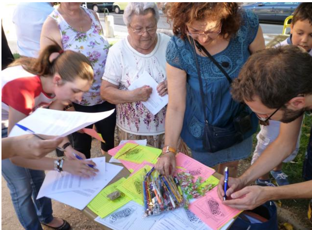
Figura 4. Taller “Recuerdos y Deseos”.

El proceso de acercamiento y generación de confianza de la primera etapa debe ser complementado con acciones propositivas, capaces de dar respuesta a las necesidades identificadas hasta el momento. La etapa de empoderamiento se inicia a través del taller vecinal “Recuerdos y Deseos” (Figura 4), dinámica participativa que dirige la mirada simultáneamente a la realidad pasada y a las oportunidades futuras, combinando las potencialidades de uno y otro.