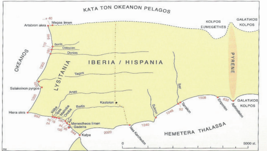
Fig. 2.1. La Penisola Iberica secondo Artemidoro