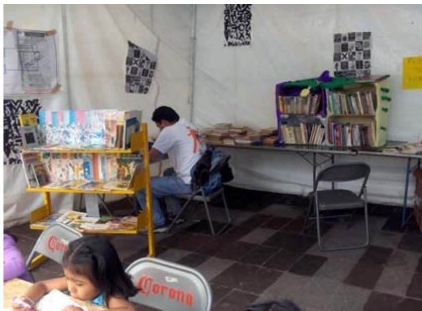
Libro club ubicado en la Avda. Juárez correspondiente a la delegación de Iztacalco.

En suma, se trataba de la construcción de una ciudad dentro de la ciudad. Para que las estrategias artísticas proliferaran, era necesario establecer los mínimos de convivencia. En esa convivencia se reforzaban las ideas de comunidad, en contra del tratamiento de la noticia que se daba en los principales medios de comunicación.