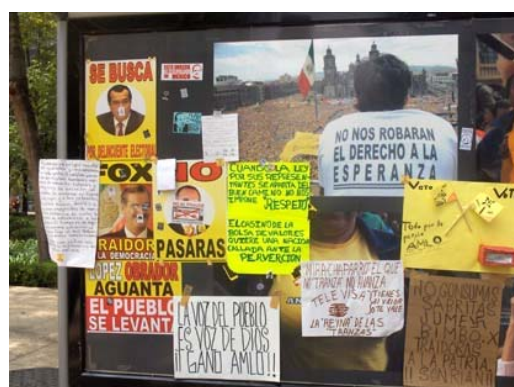
Adhesión de nuevas aportaciones sobre los soportes de la exposición fotográfica Voto x voto, foto x foto .