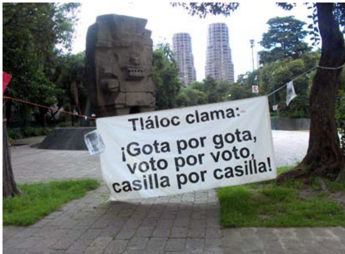
Pancarta en el acceso al Museo Nacional del Antropología, ante la escultura del dios de la lluvia, Tlaloc.