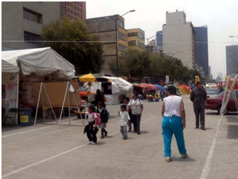
Vista de la Avda. Juárez, con algunas de las tiendas de El Plantón montadas alrededor de una de las zonas de más prestigio comercial del país.