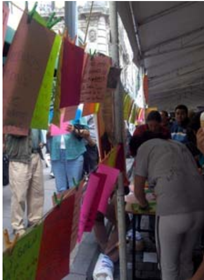
Vista parcial de Tiende para que nos entiendan . Calle Madero.

En este orden de cosas, la violencia venía de fuera, de los medios, no estaba ubicada en el Plantón. En el Plantón había muchas mujeres y niños, se trataba continuamente con valores femeninos, de cuidado al otro, de defensa, de resistencia. En la madrugada del 5 de agosto, la camioneta de lujo de un ciudadano panista atravesó la Zona de Reforma, embistió contra una docena de tiendas de campaña, destrozando parte de la infraestructura de lonas y dejando heridos. Este acto de locura fue ‘artísticamente’ reciclado, y los destrozos se dejaron tal cual quedaron. Eso sí, una inscripción sobre uno de los objetos daba muestras de los signos de este ‘arte casual’: “Monumento a la intolerancia de un ‘pacífico’ panista”, rezaba sobre los restos del destrozo.