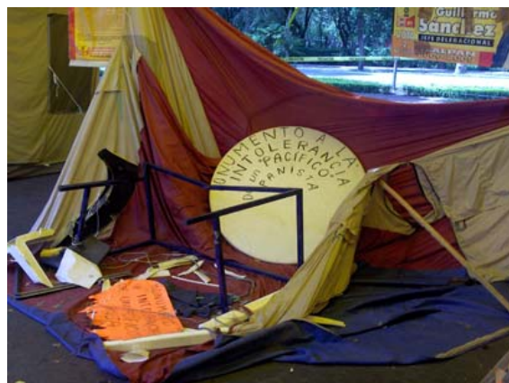
Obra de arte casual a partir de los destrozos de un automóvil sobre el Paseo de Reforma, titulada Monumento a la intolerancia de un ‘pacífico’ panista .