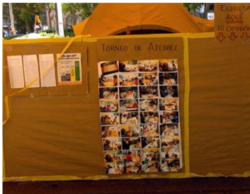
Memoria del Plantón: fotos de uno de los torneos de ajedrez y espacio de expresión.

Pronto se hizo necesario tener conciencia de su propia memoria y de su forma de proyectarse conjuntamente al futuro, y comenzaron a surgir actividades en las que se recordaban fotográficamente otras actividades del pasado. Se creaban públicamente sus propios ‘álbumes de foto colectivos’ o se hacían homenajes a participantes anónimos de El Plantón (como en la exposición “Líderes y lideresas”).