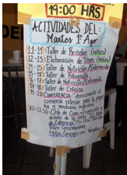
Cartelera de una delegación del DF. en los primeros momentos de El Plantón.