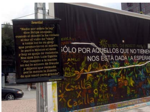
Panel de la exposición De las obligaciones de la razón: al mayoreo y al menudeo, tras la agresión y la posterior modificación de los participantes en la resistencia civil pacífica.

El descontento primigenio se manifestó a principios de julio, en una exposición en defensa del voto ciudadano, organizada por Carlos Monsiváis titulada De las obligaciones de la razón: al mayoreo y al menudeo . Distintos soportes plásticos se colocaron en la avenida Juárez. Se habían impreso las obras de artistas plásticos y diseñadores, se mostraban frases de escritores, chistes de humoristas gráficos, etc. Pero una noche, esos carteles urbanos fueron rasgados, cuestión que se vivió en el conjunto de gente preocupada por el fin de su voto como una nueva apertura de la herida. Obras que ya habían surgido de las heridas del pasado, se convertían en el soporte de nuevas heridas. Pero la respuesta fue curiosa. Esos paneles fueron restaurados (a menudo burdamente) por gente anónima. Otros fueron ‘completados’ con escritos y dibujos, de modo que hoy por hoy puede decirse que se convirtió en una exposición emblemática de la resistencia civil pacífica. Más allá de lo que los artistas pudieron haber generado para esta exposición, las obras comenzaron a comportarse como lo que Lévy llama un ‘objeto-vínculo’, algo que supera la idea de objeto de arte, algo que va actualizándose según la participación de cada usuario, que experimenta mutaciones constantes, y que vive sistémicamente, siendo contexto y viéndose modificado por el contexto (Lévy, 1999: 116).