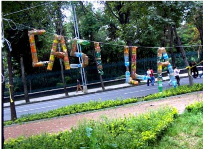
Fragmento del 'Voto x voto, casilla x casilla' que fue resultado de actividades de reciclaje de residuos en El Plantón.