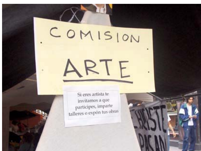
Comisión de arte. Calle Madero.

En los primeros días del Plantón las actividades aún no estaban muy organizadas, pues se realizaban continuas convocatorias y se animaba a la gente a participar, a coger un micrófono, a solucionar problemas tecnológicos, a organizar torneos de ajedrez, de fútbol, etc. Las actividades surgieron por pura necesidad. Veinticuatro horas bajo unas lonas eran muchas horas para no hacer nada. Además los niños se encontraban en periodo de vacaciones escolares, con lo que comenzaron a proliferar talleres de plastilina, dibujo infantil, concursos de baile, etc. Se podía participar espontáneamente o prever una conferencia o concierto varios días antes. Cada campamento tenía su propia agenda cultural, pero también se organizó un “Diario de la Resistencia” que aglutinaba los esfuerzos de todas las delegaciones y cada día repartía una hojilla con las actividades que se podían disfrutar, la “Cartelera cultural”.