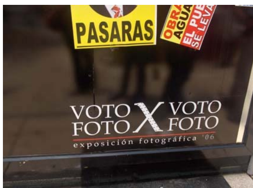
Exposición fotográfica Voto x voto, foto x foto .