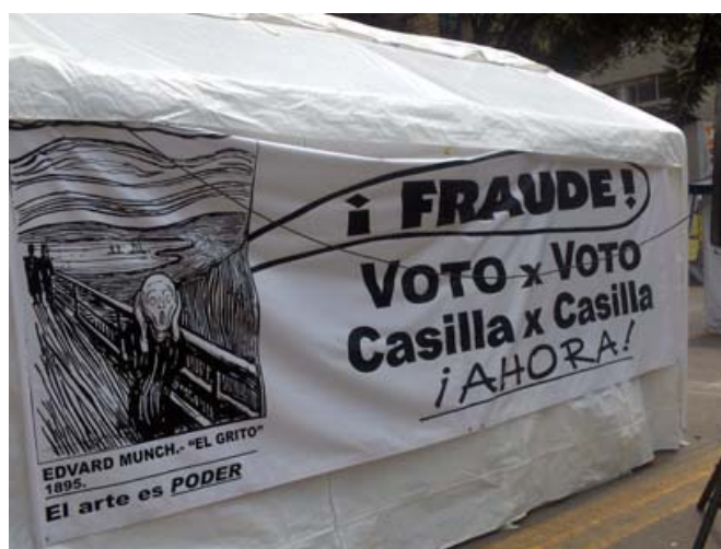
Pancarta fija. Avda. Juárez.