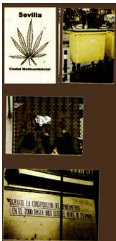
Acciones en 1999 de diversos colectivos. Modificación de los logos ( Sevilla, ciudad medioambiental y NO8DO ), con adhesión a superficies inusuales (contenedores de basura... zonas de drogodependencia...). Placa conmemorativa del nivel de escombros de las obras.

Pues bien, intentando superar este impasse , tratando de responder a la pregunta del ‘para qué pintar’, me planteé conocer lo que otros podrían estar realizando en este mismo sentido. Conocía la labor de colectivos tanto en España como en Latinoamérica. Habría que aprender de ellos. Por eso, primero me dediqué a contactar con colectivos de mi entorno. En Sevilla tenía bastante cercano el ejemplo de El Tinglao del Gran Pollo de la Alameda . El colectivo estaba a punto de publicar un libro que registraba la acción político-artística en el intento de preservar las señas de identidad en el barrio de la Alameda de Hércules a pesar de las ayudas de la Comunidad Europea a través del Plan Urban. Este colectivo acababa de exponer su trabajo en el CAS (Centro de Arte de Sevilla, en el Convento de San Clemente, del mismo barrio de la Alameda). Era curioso que simultáneamente expusiera allí Antoni Muntadas, con una retrospectiva sobre sus proyectos urbanos. Las preocupaciones sobre la representación de la ciudad eran paralelas.