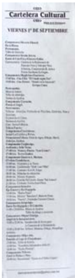
Cartelera del 1 de septiembre de Diario de la resistencia (aglutinadora de las carteleras por delegaciones).