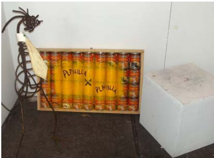
Detalle de la exposición de Faro de Oriente en la zona de Diana Cazadora, Paseo de Reforma ('Planilla x planilla').