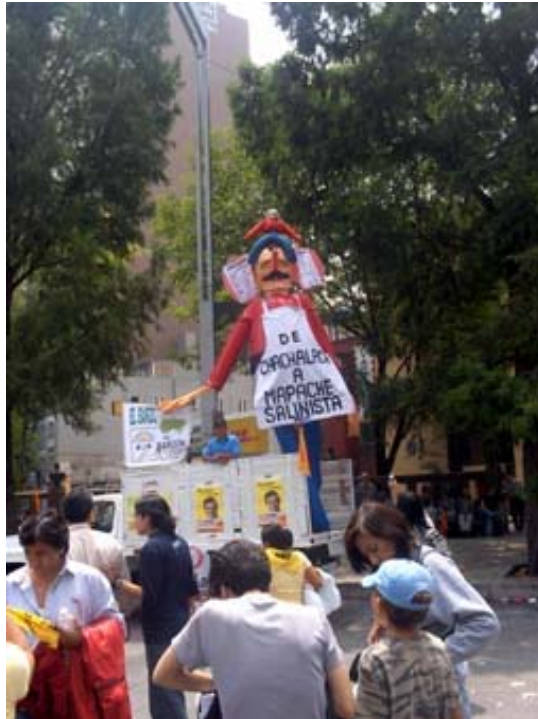
Vista de la manifestación del 30 de julio. Inmediaciones del Paseo de Reforma.