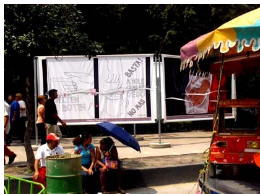
Avda. Juárez con fondo de un panel rajado, en la exposición De las obligaciones de la razón .