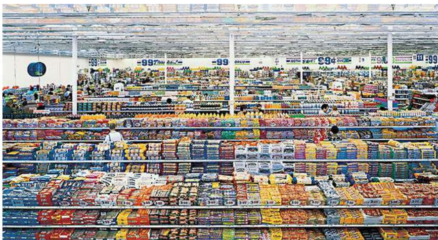
Andreas Gursky. 99 Cent II Diptchon . 2001.

En la era de la globalización tecnocultural, se pasa de unas relaciones de producción laboral o “dictadura del trabajo” a las relaciones de producción del consumo o “dictadura del mercado”. En estas circunstancias, algunos artistas no encuentran el placer en permanecer ante su obra durante horas enteras. Por el contrario, el goce lo encuentran en la glorificación de su artefacto artístico por el mercado. De modo que toda pulsión estética ha ido trasladándose del culto al trabajo como virtud, a la veneración del consumo como goce 14 . De ahí que el consumo social se convierta en un acto de cotidianidad inevitable, debido a la constante relación que mantenemos con el mundo de los objetos y las imágenes. Estos abundan sobremanera en el paisaje contemporáneo, escapando una gran parte, de la lógica de nuestro entendimiento. Nuestra capacidad de reacción se ve mermada, por la dificultad que conlleva procesar demasiada información visual latente.