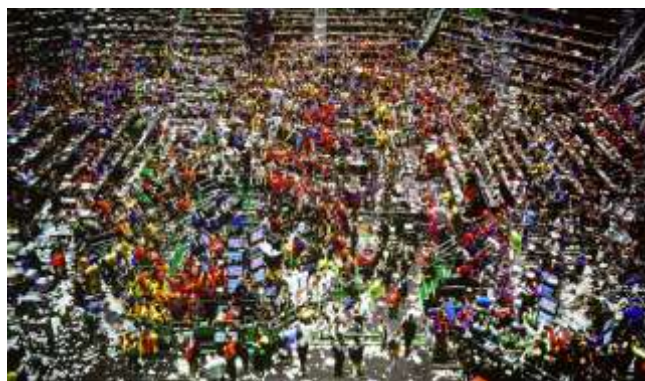
Andreas Gursky. Chicago, Board of Trade . 1999. Photograph on paper unconfirmed: 2070 mm. x 3360 mm. on paper, print

El hecho al que nos hemos referido anteriormente lo identificamos en ciertas fotografías de Andreas Gursky. Por ejemplo en su obra Chicago board of Trade II , de 1999, en la que el comerciante individual se convierte en un pequeño elemento, situado dentro de un vasto y enorme patrón concéntrico de conductas humanas compartidas. Dicha imagen simboliza un concepto abstracto: una sensación de velocidad en el comercio se observa en un momento casi religioso, congelado, como “la dimensión primal, la fuerza Ecuménica de la unidad metafísica” 23 . La rapidez, la prisa, el tiempo atropellado, son valores instaurados en la condición humana contemporánea, siempre acompañada por el poder del dinero como eje central que determina la imagen de nuestra propia vida. Con este pensamiento nos introducimos en una actitud abstracta que define las circunstancias que vivimos, donde todo fluye y se interrelaciona mediante códigos, líneas, sonidos o imágenes mentales inducidas. Hablamos del poder abstracto de la imagen, y del poder de la sociedad como conducta colectiva que crea las imágenes que consumimos.