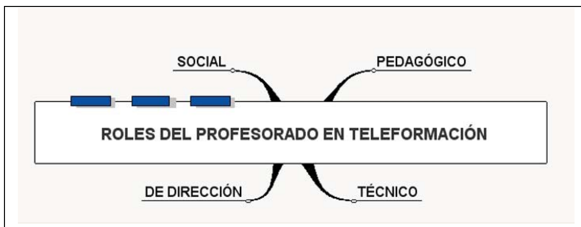
Figura nº 1: Roles básicos del profesorado (Ryan y otros, 2000).

En este sentido, podemos encontrarnos una primera clasificación sobre cuatro tipos de roles básicos a desarrollar por el profesorado (Ryan y otros, 2000, p.110):