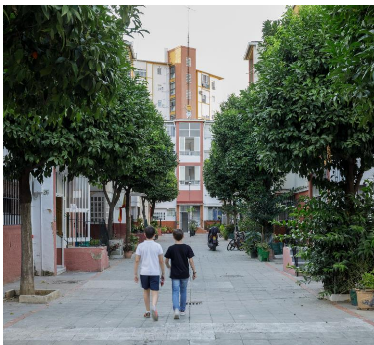
Figura 7. Calle interior del Conjunto Residencial Nuestra Señora del Carmen