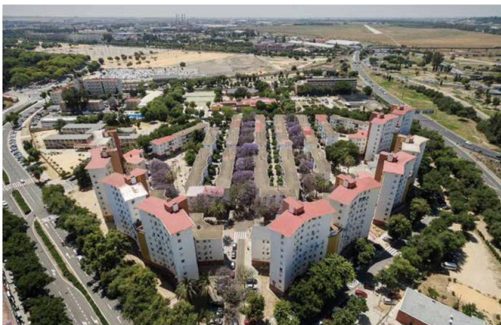
Figura 1. Vista aérea del Conjunto Residencial Nuestra Señora del Carmen