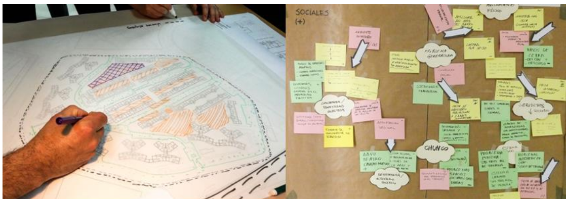
Figura 5. Taller de investigación participativa: definición de límites y caracterización patrimonial

Son numerosos los autores que han definido el patrimonio como sistema (González-Varas, 2016; Fouseki, 2022) tratando de dar respuesta a la consideración de lo patrimonial como “objeto complejo” en el que tan importante son los elementos que lo conforman, sus cualidades materiales e inmateriales, como las dinámicas y relaciones que se generan entre ellos y que están en constante evolución. El patrimonio es significación, es percepción e identidad, en un tiempo y en un lugar. Una definición que cuestiona la posibilidad de delimitar lo patrimonial, ya que la idea de sistema trasciende esta consideración.