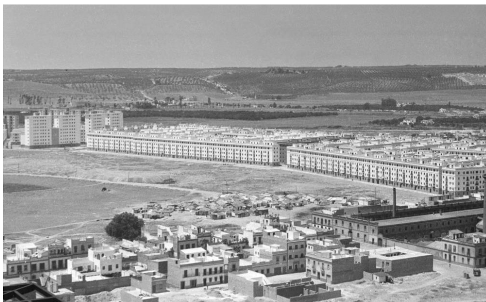
Figura 4. Barriadas del Tardón y del Carmen, con algunos asentamientos de infravivienda en el plano medio y el barrio Voluntad en construcción en primer plano