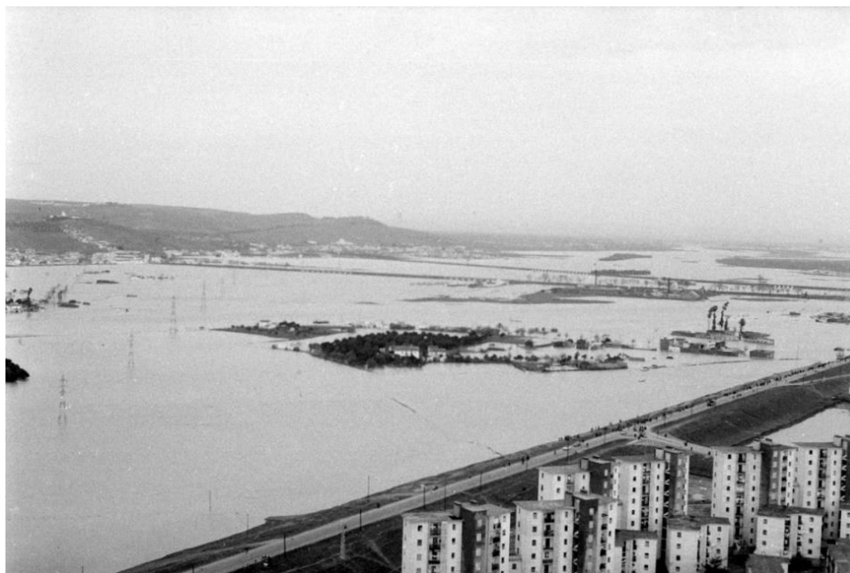
Figura 3. Inundaciones en el entorno de la barriada del Carmen, 1961