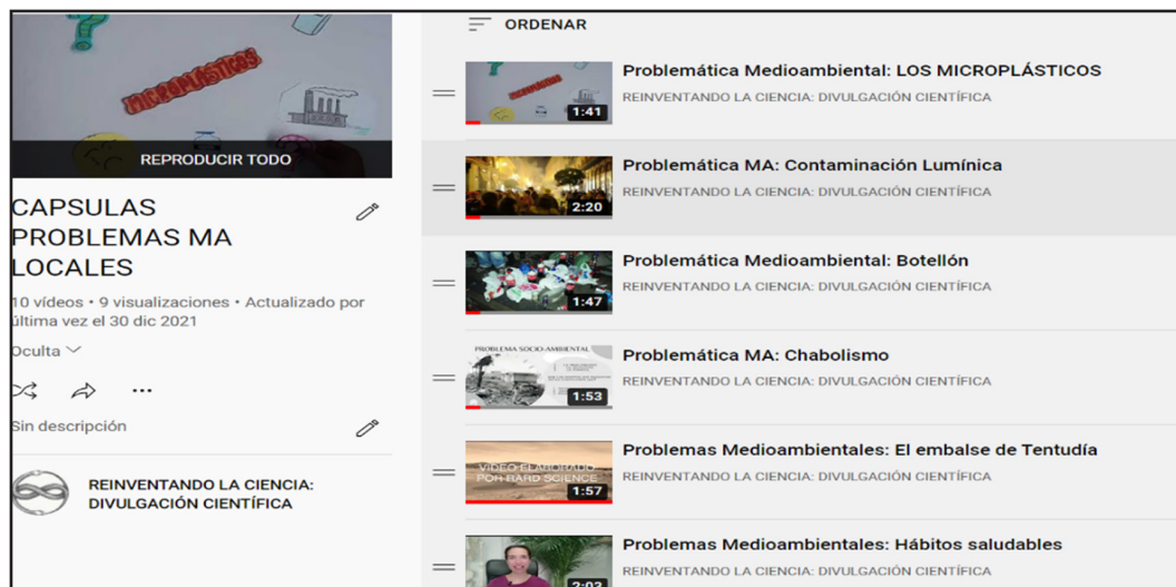
Figura 3. Ejemplo del listado de vídeos diseñados y compartidos en YouTube ( https://youtube.com/playlist?list=PLWxKM2V6GN-_JkDRgwMjSQfmNivmiWfCR ; https://www.youtube.com/playlist?list=PLWxKM2V6GN-85ZDbRCz_vj5MQT3d6HK_1 ; https://www.youtube.com/playlist?list=PLWxKM2V6GN-9FiXsZGp6rP4vzNAX2gKkL )

vídeos fueron subidos a la plataforma de YouTube, tal y como se ilustra en la figura 3, para poder ser compartidos con todos los grupos. En clase se visionaron algunos donde se debatió sobre el problema socioambiental que habían identificado, sus causas y consecuencias, así como los contenidos que se podrían tratar desde la enseñanza de las ciencias en Educación Primaria.