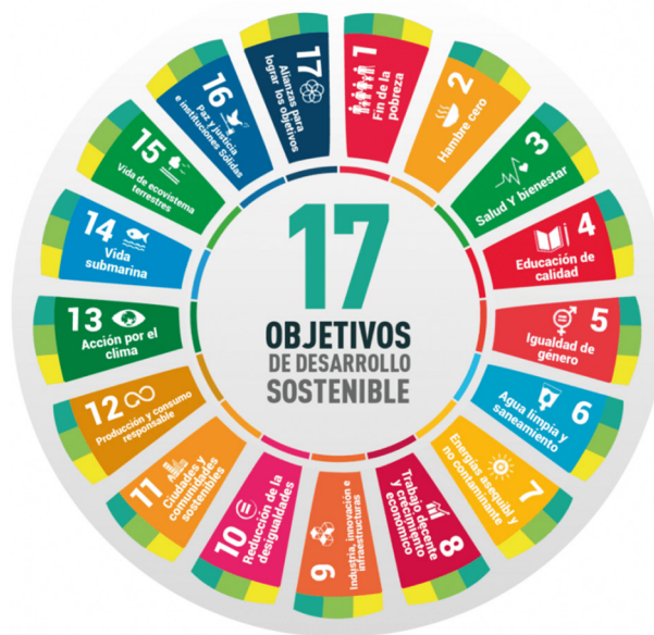
Figura 1. Objetivos de Desarrollo Sostenible

La sociedad actual además de afrontar a la crisis sanitaria por el SARS-CoV-2, se enfrenta a grandes desafíos globales como son la crisis económica, medioambiental, el cambio climático, las desigualdades sociales, las guerras, etc. En este contexto global, el fomento de un Desarrollo Sostenible ha ganado un amplio reconocimiento internacional para garantizar la calidad de vida, la equidad entre las generaciones presentes y futuras, y la salud ambiental (Naciones Unidas, 2012; UNESCO 2015). Ligado a esto, en el año 2000 se definieron 17 objetivos para el desarrollo sostenible (ODS) de distinta índole social (pobreza, hambre, salud y bienestar, educación de calidad, etc.) y ambiental (acción por el clima, vida submarina y ecosistemas terrestres, etc.) que podemos ver recogidas en la figura 1.