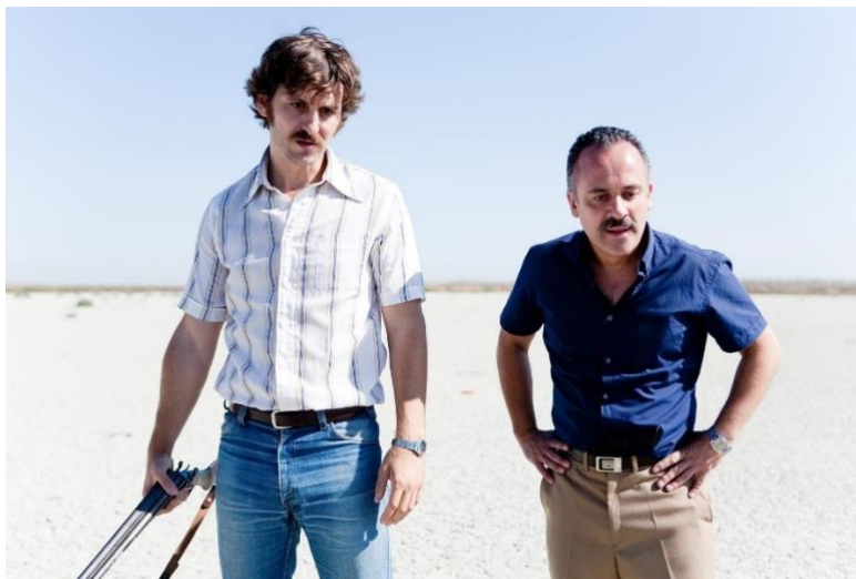
Figura 2. Protagonistas de la película La isla mínima . Pedro (izquierda) y Juan (derecha).