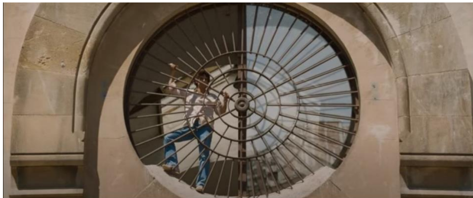
Figura 7: Plano de la cárcel Modelo de Barcelona en Modelo 77 .