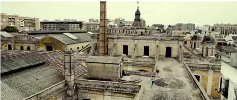
Figura 5. Calles de Sevilla en Grupo 7 .