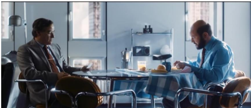
Figura 3. Personajes de la película El hombre de las mil caras .

Fuente: Zeta Cinema, Atresmedia Cine, Atípica Films, Sacromonte Films, Canal Sur, Movistar+, Zeta Audiovisual.