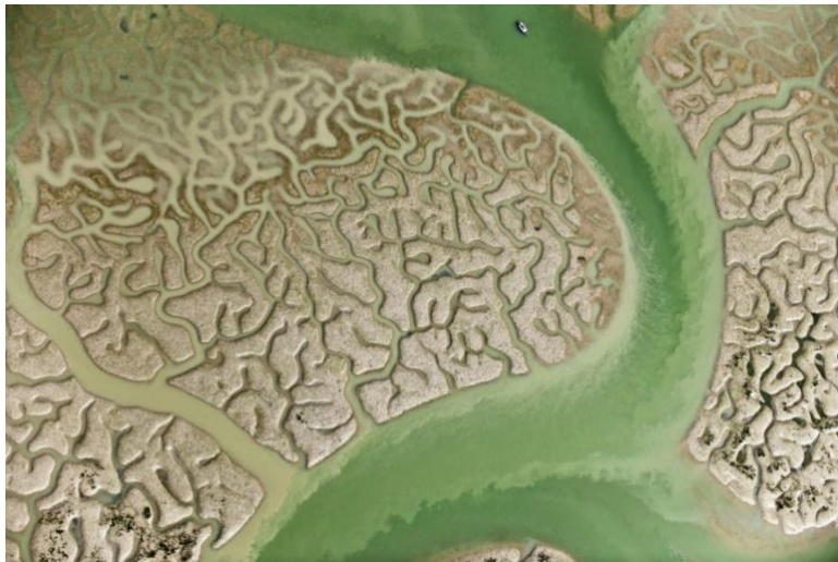
Figura 6. Marismas del Guadalquivir de La isla mínima .