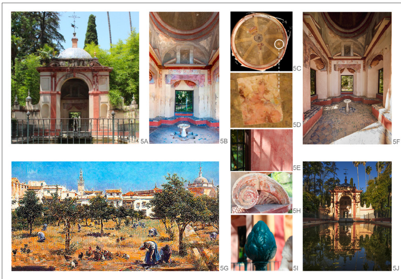
Figura 5. En busca del color y pinturas del Cenador del León. 5A) Fotografía del estado antes de la intervención. Consecuencia de acciones destructivas ocasionadas por los efectos del agua y de anteriores intervenciones, solo quedaban vistos unos pocos restos de revestimiento original. 5B) Fotografía del estado antes de la intervención. En el interior del cenador la humedad por capilaridad había deteriorado las partes bajas de los revestimientos. 5C y 5D) Los estudios científicos y las catas depararon sorprendentes pinturas al fresco originales ocultas, con bellos dibujos y delicados colores, como el maravilloso ángel niño que había sido cubierto por otras pinturas, probablemente neoclásicas, del siglo XIX. En el archivo del Real Alcázar se localizó la memoria del pintor Juan de Medina presentada el 11 de enero de 1646 y la certificación del veedor Esteban de Mendoza. Estos dos documentos analizados por la profesora Marín Fidalgo permitieron datar las pinturas entre noviembre de 1644 y enero de 1646 y conocer los temas de la ornamentación, dedicados al amor y protagonizados por dioses, cupidos y ninfas. En el interior están a la vista algunos restos originales, otros están cubiertos por pinturas posteriores y los demás no se conservan. La decoración pictórica del exterior ha desaparecido por completo. 5E) En el interior, donde se perdieron las pinturas, se aplicó mortero de cal y estuco, con un acabado muy sutil con pigmentos minerales en el que se utilizó, para la reintegración cromática, el criterio de abstracción con los colores usados por Juan de Medina. 5F) Estado de las pinturas del interior después de la restauración. 5G) En el óleo de José Villegas Cordero, 1895 [colección particular, Madrid], los colores del cenador coinciden con los descritos por Juan de Medina y con las pinturas de las enjutas de los arcos interiores. 5H) Restos de estucos en el frontón curvo abierto. 5I y 5J) Fotografías después de la intervención. La restauración del pabellón consiguió devolver al Cenador del León la atmósfera otorgada por Juan de Medina, con lo que se logró la armonía cromática con los demás elementos del jardín. La restauración se realizó en 2017 y 2018.