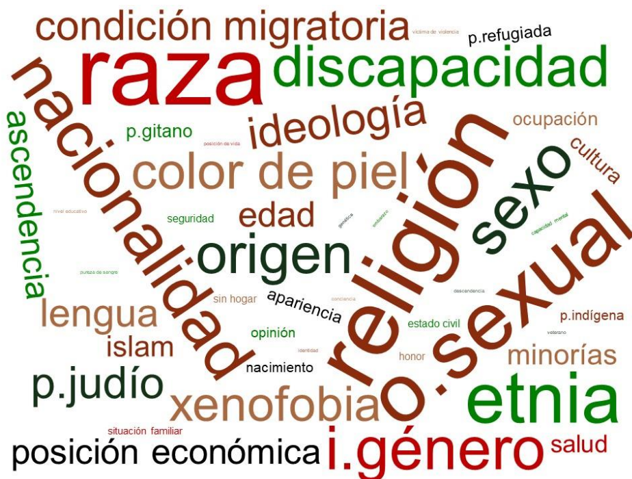
Figura 2: Condiciones Asociadas a Recibir Discursos de Odio

Nota: Nube de palabras de elaboración propia a partir de análisis de contenido. El tamaño de cada palabra está asociado a la frecuencia con la que el término aparece en la literatura revisada.