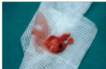
Fig. 12. Pieza anatómica.