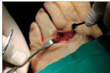
Fig. 6. Planos profundos.