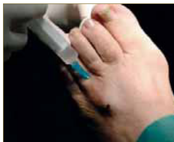
Fig. 1. Bloqueo anestésico.

Se procede según protocolo de Cirugía podológica y con la previa autorización del paciente mediante el consentimiento informado. Se realiza lavado quirúrgico y preparación de la zona y se procede con la anestesia troncular con Mepivacaina al 2 % y Betametasona (fig.1). Se realiza isquemia de la zona a nivel supramaleolar. Diseñamos la incisión (fig.2) y se inicia la secuencia de gestos quirúrgicos con una incisión dorsal (fig.3) extendida distalmente de la zona, respetando la fascia superficial que se encuentra muy vascularizada, y continuamos con la liberación de la fascia, respetando el arco venoso superficial, para ello es conveniente lateralizarlo (fig.4).