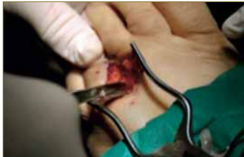
Fig. 7. Fibrosis perineural.