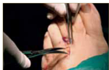
Fig. 4. Abordaje de la lesión.

Si no es posible, se procederá a su corte y posterior ligado y cauterización. A continuación, ya podemos observar el tejido celular subcutáneo (fig.5) y planos profundos (fig.6). Se debe realizar una presión plantar en el tercer espacio intermetatarsal para favorecer la exposición de la fibrosis perineural (fig.7).