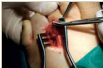
Fig. 11. Extirpación de la lesión (IV).