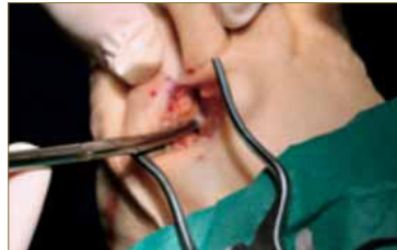
Fig. 8. Extirpación de la lesión (I).

Se continúa con la disección del ligamento intermetatarsal transverso profundo y se realiza la neurotomía de las ramas digitales (fig.8-11). Se debe de sujetar muy bien la pieza definitiva y se secciona lo más distal posible a ésta. Siguiendo protocolo se realizó una remisión de la pieza anatómica (fig.12) a laboratorio para su confirmación diagnóstica.