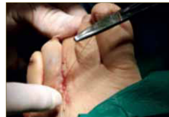
Fig. 15. Cierre de la herida.