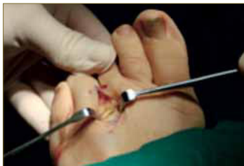
Fig. 5. Tejido subcutáneo.