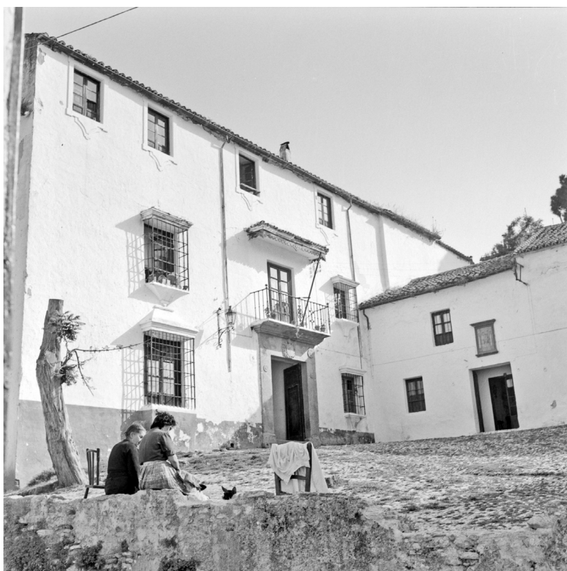
Figura 2. Málaga, Ronda. Autor: Juan Miguel Pando Barrero (1963).

En los dos casos acaecidos en los años veinte la Guardia Civil abrió el oportuno expediente para tratar de obtener un inmueble alternativo, pero sin querer asumir subidas en el precio del alquiler. A pesar del recelo que esta repetida situación generaba en los mandos del Cuerpo, de nuevo, la falta de alternativas obligó al Estado a asumir las condiciones de la propiedad y a continuar en el mismo edificio.