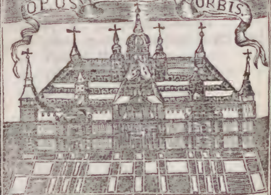
VISTA DEL REAL MONASTERIO DEL ESCORIAL