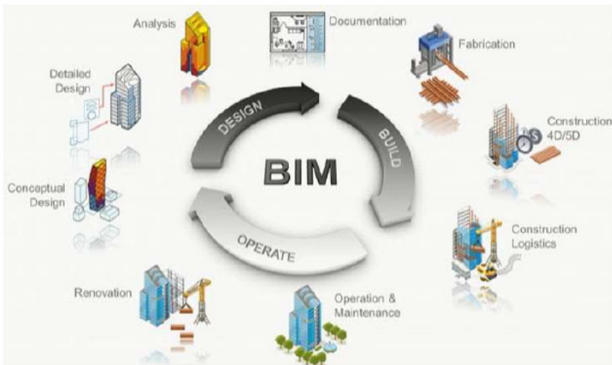
FIGURA 1: Gráfico funcional modelo BIM