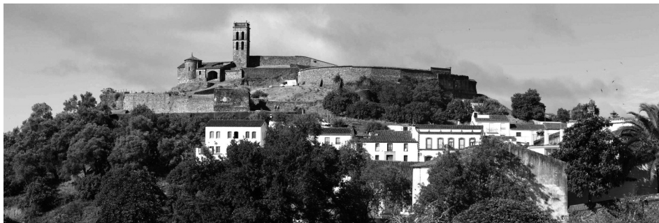
FIGURA 5 MEZQUITA DE ALMONASTER LA REAL