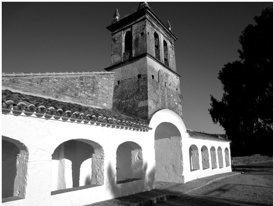
FIGURA 4 ERMITA DE SAN MAMÉS