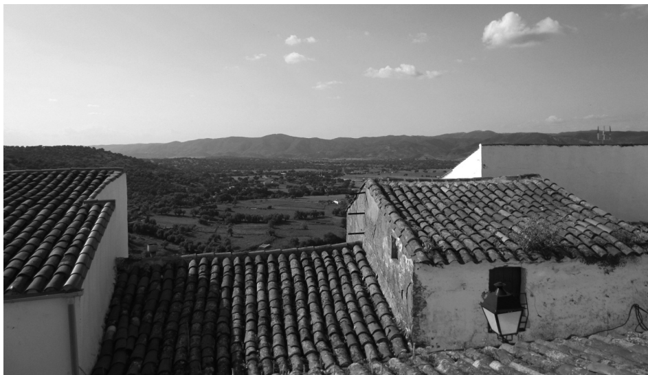
FIGURA 6 VISTAS DE LOS LLANOS DE LA BELLEZA DESDE AROCHE