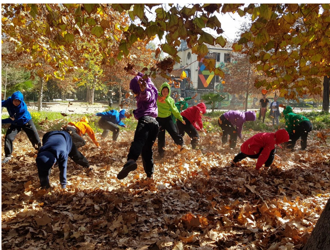
Figura 4. Estudiantes de un liceo artístico en un acto poético en la Quinta Normal.

Las comunidades educativas, por su parte, compartieron sus reflexiones y propuestas para un cambio en nuestra conducta en pro de mejorar las condiciones del planeta que en un hito denominado “Conciencia en acción” que, entre otros desafíos, tenía el de utilizar solo material reciclado para no generar basura.