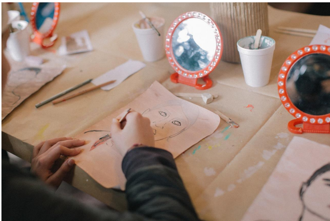
Figura 3. “Lo que he aprendido hoy en que no todas las personas son iguales, tienen distintos colores y que no necesariamente tienes que pintar a todas las personas con el mismo color”.