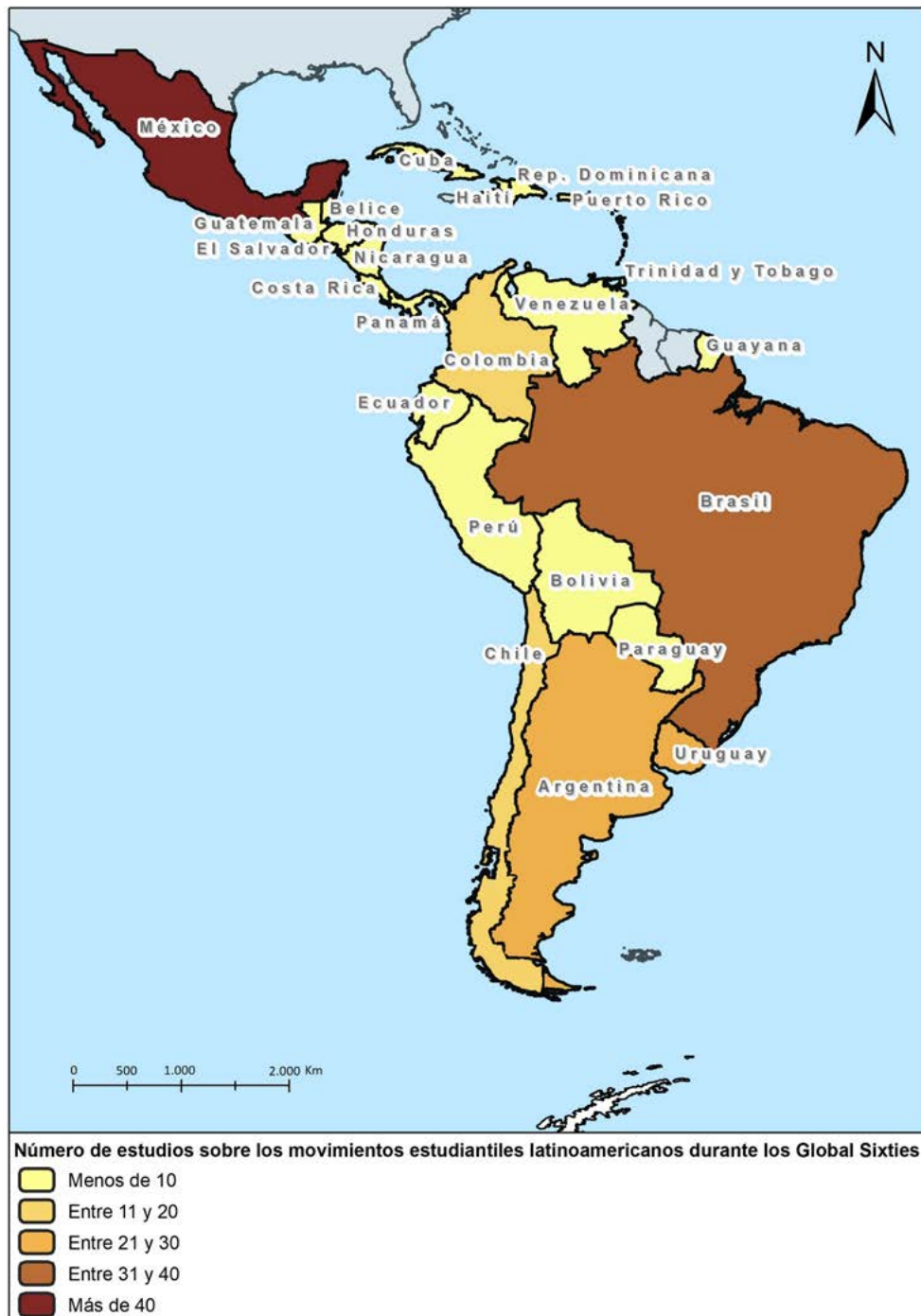
Figura 2. Distribución espacial de los estudios sobre los movimientos estudiantiles durante los Global Sixties .