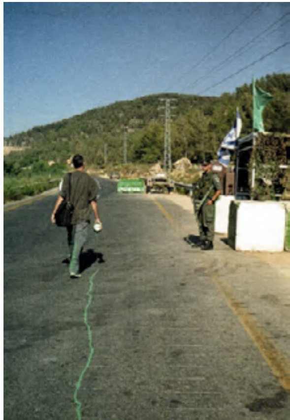
Figura 4. Francis Alÿs (2007). The Green Line .

Hoy en día artistas como Francis Alÿs (Amberes, 1959) fundamentan una parte muy importante de su vida y su obra en estos paseos, paseos en principio sin rumbo, que sirven para idear y observar, pero que en muchas ocasiones desembocan en una acción artística con claras connotaciones políticas y un aura poética, como ejemplifica el subtítulo de su obra La línea verde : "A veces, hacer algo poético puede convertirse en algo político y, a veces, hacer algo político puede convertirse en algo poético".