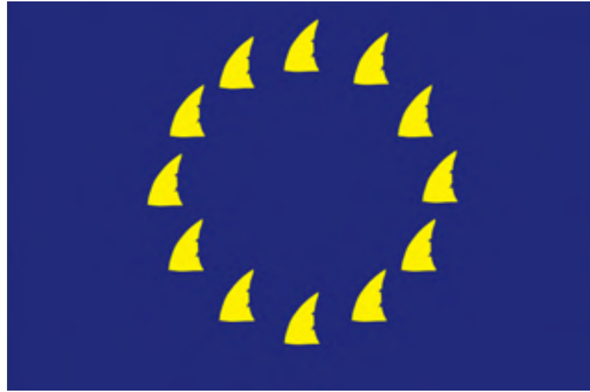
Detalles de la obra MTG_10

Aquí se plantea un juego de lo sutil pero útil con lo macizo pero inútil. Se presenta la unión de una colchoneta delicada con un flotador cubierto de cemento y que esconden una obra gráfica que muestra la bandera de la Comunidad Europea, pero donde las estrellas han sido sustituidas por aletas de tiburón.