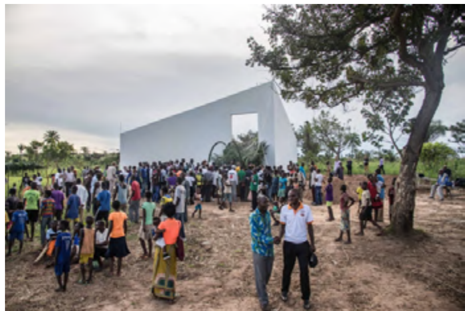
Figura 5. Renzo Martens (2021). The White Cube

Con los ingresos obtenidos, los trabajadores no solo han podido recomprar sus tierras a la empresa que las poseía desde la década de 1920, sino que también han tenido los medios para trabajar con el estudio de arquitectura OMA y hacer que diseñen y construyan una galería de arte en funcionamiento dentro de la plantación.