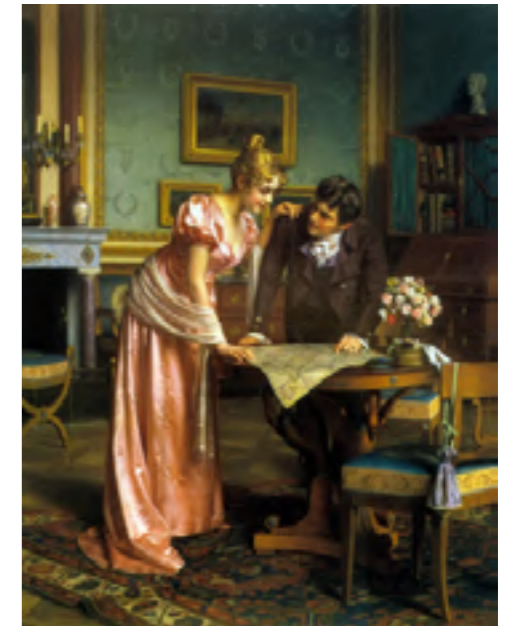
Figura 3. Emil Brack (2021). Planing the Grand Tour

incluso más de una vez. Este tutor servía además para constatar la veracidad del viaje. El itinerario más común incluía París, el norte de Italia, Florencia, Roma, Nápoles, Suiza y en ocasiones Alemania. Este recorrido solía durar entre dos y tres años, pero los jóvenes no estudiaban en las universidades de los lugares de destino, sino que perseguían el conocimiento; aprender, entender, observar las costumbres de otros lugares y compararlas con las propias. Posteriormente, apareció el Petit Tour , con precios más asequibles, y se creó el primer "paquete turístico" de la historia, que comprendía París, Bruselas y Ámsterdam.