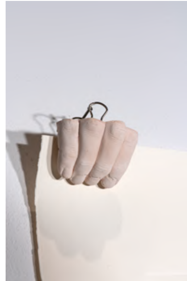
Detalle de la obra MTG_6

Este tríptico geométrico y a simple vista difícil de descifrar, está en conexión con algunas de las obras expuestas en la muestra. Estamos ante gofrados que registran el fraccionamiento de las piezas que componen las maquetas en madera de las obras Ataúd , Horca (finalmente no expuesta) y Desigual_2 .