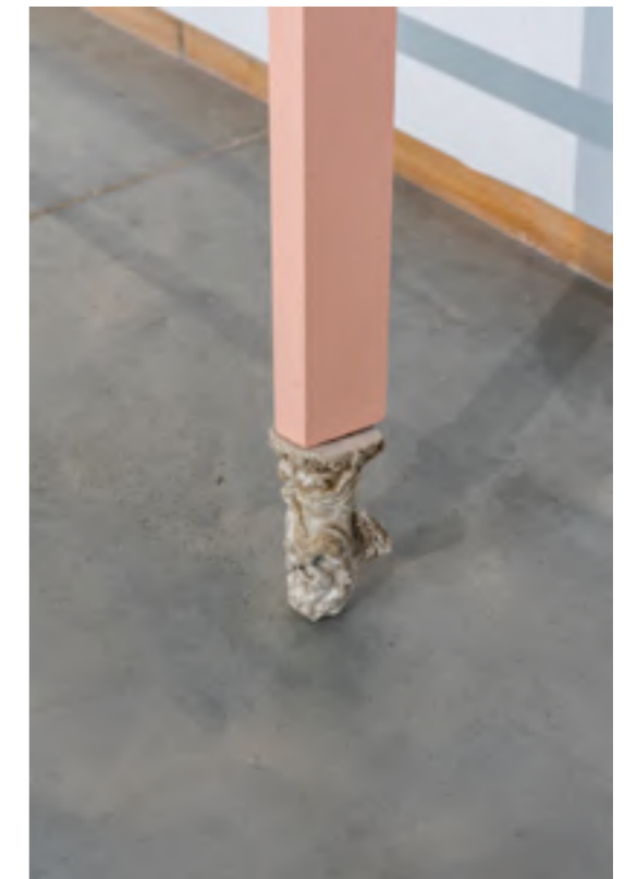
Detalle de la obra MTG_4

MTG_4 nos describe las dificultades en el camino hacia una mejora en la calidad de vida, un proceso complejo que está en muchos casos marcado por donde se nace, entendiendo esto como un conjunto amplio de parámetros tales como el lugar, el tipo de familia, incluso el momento histórico. Esta obra se hace especial hincapié en el lugar. Se presentan dos escaleras de madera que no discurren paralelas y que tienen exactamente la misma estructura exterior.