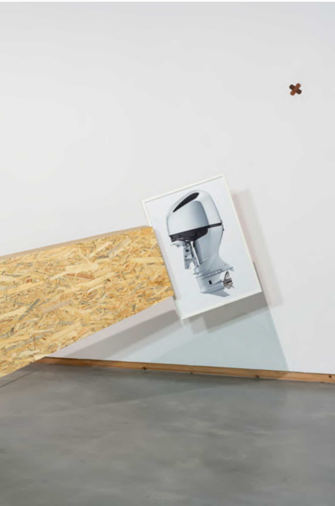
Detalle de la obra MTG_5

Esta obra abre un espacio para la reflexión sobre que significa el Mar Mediterráneo, qué connotaciones tiene para los que vivimos cerca de él o para los turistas que disfrutan sus vacaciones en sus cosas; y lo que significa para un inmigrante que decide dejar atrás su patria, su hogar y su familia para arriesgar su vida en sus aguas. Es por ello que se presenta un ataúd de madera unido a una fotografía digital enmarcada de un motor fueraborda.