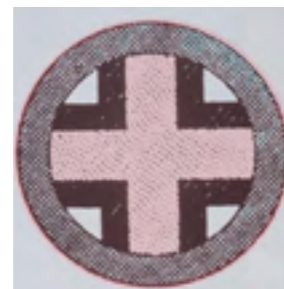
Figura 7. Stanley Tigerman (1988). Jeroglífico egipcio para ciudad

Tal y como indica David Frye: “En una fecha tan temprana como el décimo milenio a. C., los constructores de Jericó -la primera ciudad del mundo- la rodearon con una muralla”. Muros. La civilización a través de sus fronteras. (Frye, 2020: 20).