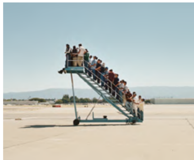
Figura 8. Adrian Paci (2007). Centro di Permanenza Temporanea .

A pesar de que la caída del Muro de Berlín parecía anunciar el comienzo de una nueva época de libertad, poco ha tenido esto de realidad. Antes de 1991, los marroquíes provistos de pasaporte