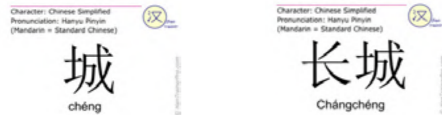
Figura 6. Han Trainer (2022). Carácter chino para ciudad y muralla.

Los muros surgieron paralelamente a la fundación de las primeras ciudades, se podría decir que de una forma generalizada son dos cosas casi indivisibles. Si observamos, por ejemplo, el carácter chino para “ciudad” y para “muro” son exactamente el mismo; y si nos fijamos en el jeroglífico que simbolizaba “ciudad” en el antiguo Egipto, podemos ver dos calles que se cruzan y rodeadas por un muro.