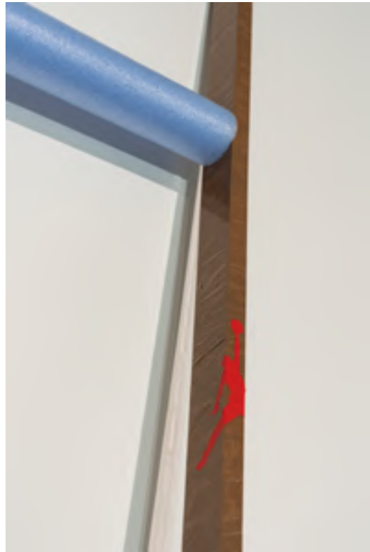
Detalle de la obra MTG_4

MTG_4 nos describe las dificultades en el camino hacia una mejora en la calidad de vida, un proceso complejo que está en muchos casos marcado por donde se nace, entendiendo esto como un conjunto amplio de parámetros tales como el lugar, el tipo de familia, incluso el momento histórico. Esta obra se hace especial hincapié en el lugar. Se presentan dos escaleras de madera que no discurren paralelas y que tienen exactamente la misma estructura exterior.