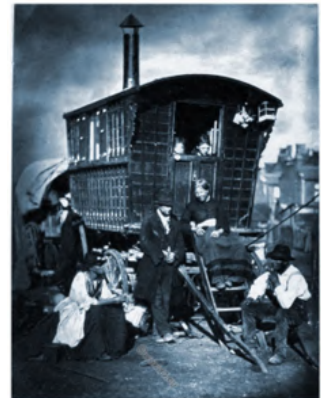
Figura 2. John Thomson (1976). Nómadas en Londres. Caravana gitana.

Quizás los más grandes y sutiles practicantes del arte de viajar fueron los Sufís, los místicos del islam. Antes de la época de los pasaportes, vacunaciones, aerolíneas y otros impedimentos para viajar libremente, los sufís deambulaban descalzos en un mundo donde las fronteras tendían a ser más permeables que hoy en día. Eran una clase de viajeros que no era comerciante ni guerrero ni un peregrino al uso, sino que representaba la espiritualización del puro nomadismo. (Bey, 1999:1).