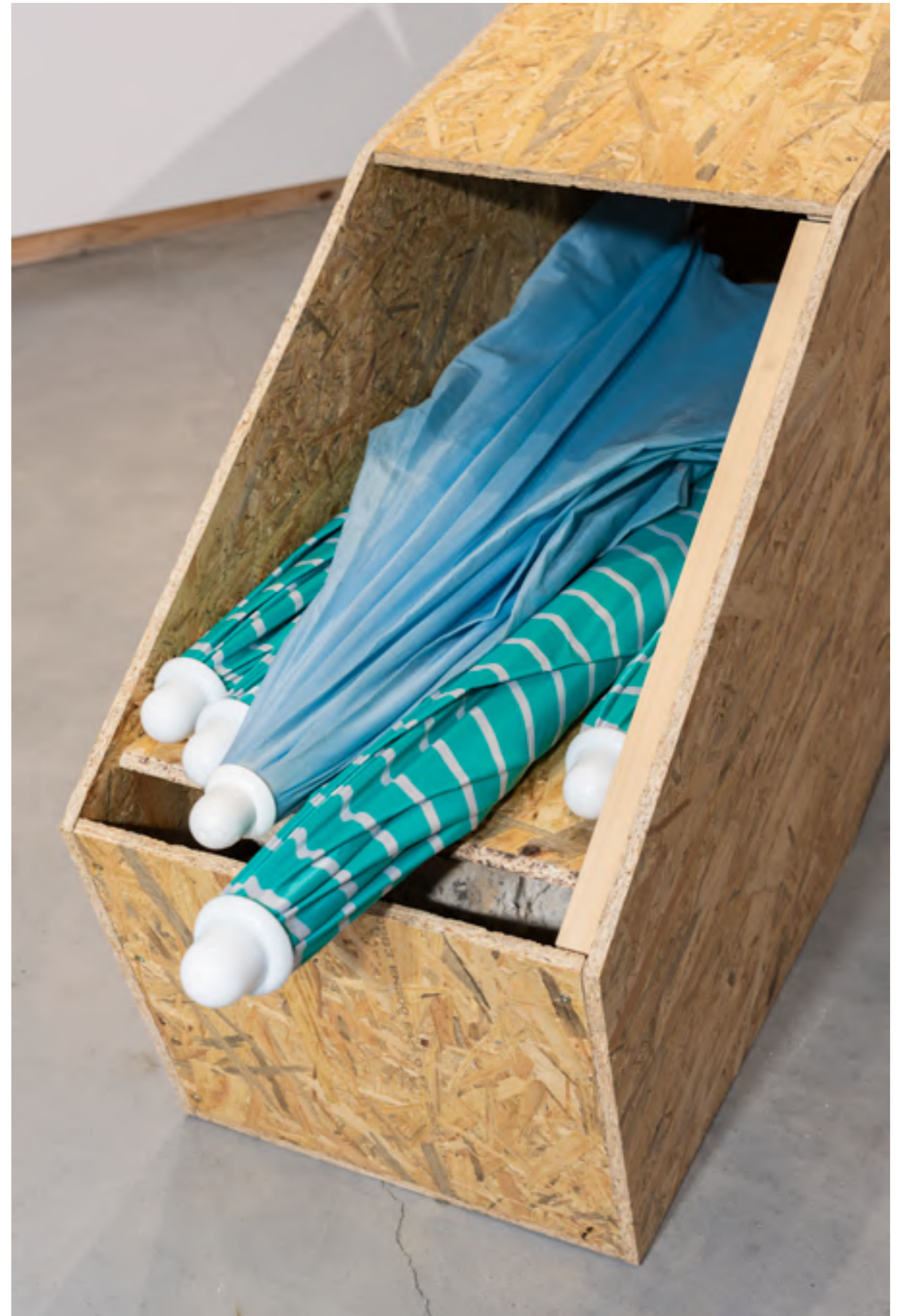
Detalle de la obra MTG_5