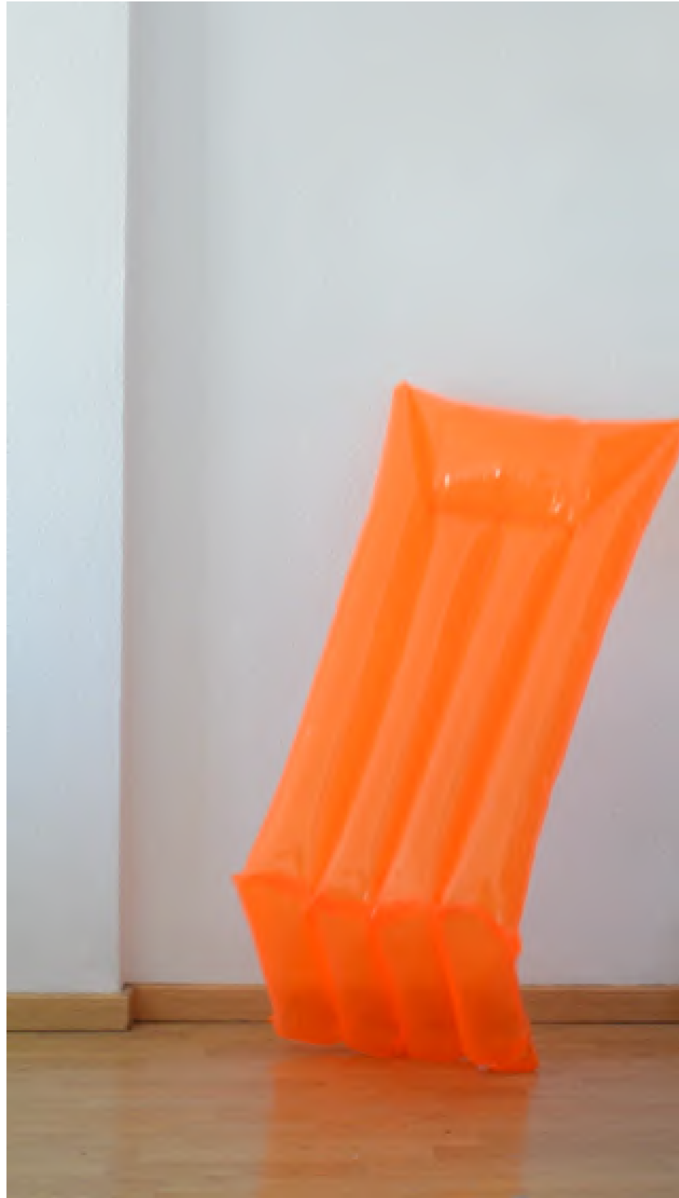
Fotograma de la obra MTG_8

MTG_8 es un claro ejemplo de la importancia del azar y de la necesidad de estar abierto al mundo que nos rodea. Esta obra surge del accidente. Mientras fotografiaba la colchoneta y gracias a la pérdida de aire de la misma, esta cayó desplomada, dando la impresión de haber caído de rodillas, como un ser macizo, plano, que queda sometido.