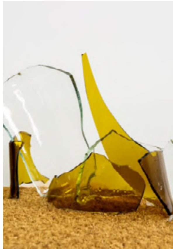
Detalle de la obra MTG_3

Un felpudo es un objeto que da la bienvenida a las viviendas y que a su vez sirve para limpiarse la suciedad de los zapatos. Aquí hago de uso de uno para reflejar la falsa invitación que se hace al de fuera en el primer mundo, es una bienvenida propagandística y que decora nuestras "democráticas" conciencias. Es por ello, que se ha colocado un muro de vidrio cortante y amenazante como el que se dispone en los ya altos muros de ciertas propiedades privadas. Esto contrasta con el elemento invitador que es el felpudo. Se crea así la yuxtaposición ente un espacio abierto y que incita a pisar, a dejar atrás la suciedad, los problemas, el pasado, pero que está rodeado por un muro semicircular de elementos peligrosos que acorralan y defienden su perímetro.