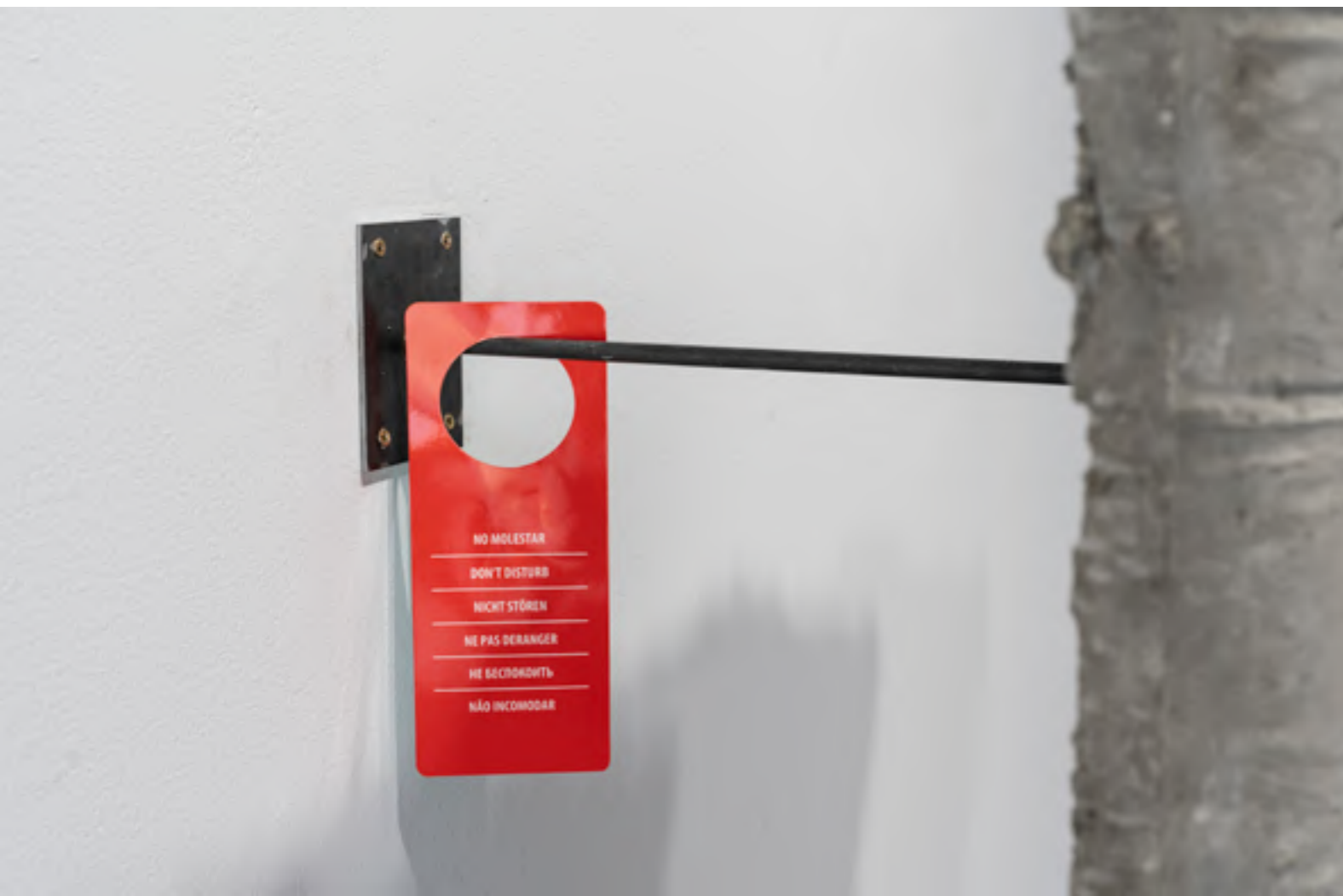
Detalle de la obra MTG_11

El material elegido fue el cemento, un material pesado, pero resistente y que se presentara erguido verticalmente, también en oposición a la posición lógica de su uso. En la varilla metálica que separa la obra de la pared vemos una señal de no molestar , como la que encontramos en las puertas de las habitaciones de hotel y manifiesta un rechazo generalizado del primer mundo a ser molestado por problemas ajenos.