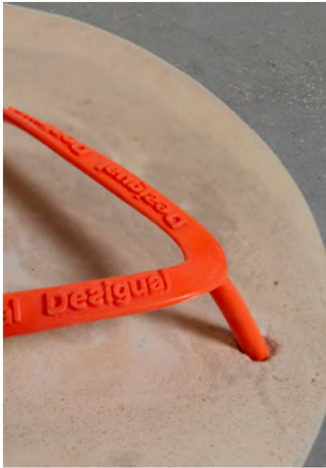
Detalla de la obra MTG_1

MTG_1, compuesta de dos bloques macizos de escayola que dan cuerpo a un par de chanclas de goma, simboliza la pesadez, la incomodidad, el esfuerzo heroico que para algunos supone dar un paso hacia delante, un paso no solo entendido como desplazamiento físico sino también como un atrevimiento, una necesidad de elevar la calidad de vida. Para ello se presenta el calzado más barato y quizás el más usado para recorrer el suelo africano: unas chanclas de goma, pero son unas elegidas con intencionalidad, ya que son unas chanclas de la marca Desigual , lo cual pone aún más de manifiesto si cabe la diferencia, el distinto ritmo al que evolucionan las cosas en Europa y en África.