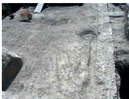
Fig. 5. Avda. de los Emigrantes nº25 y 27 y calle Rosales nº36 [286]. Infraestructura lineal y mejora del terreno en su cara oriental. Doreste y Romero, 2004.

Las estructuras excavadas, que se situaron cronológicamente a mediados del siglo I d. C., en una cota situada a 102,47 m s.n.m., fueron preliminarmente puestas en relación con las de características similares documentadas en el