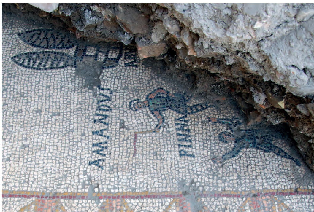
Fig. 3. Calle Elvira nº3 y calle Fernández Pintado nº5 [531]. Mosaico del circo (detalle). S. García-Dils 2010.