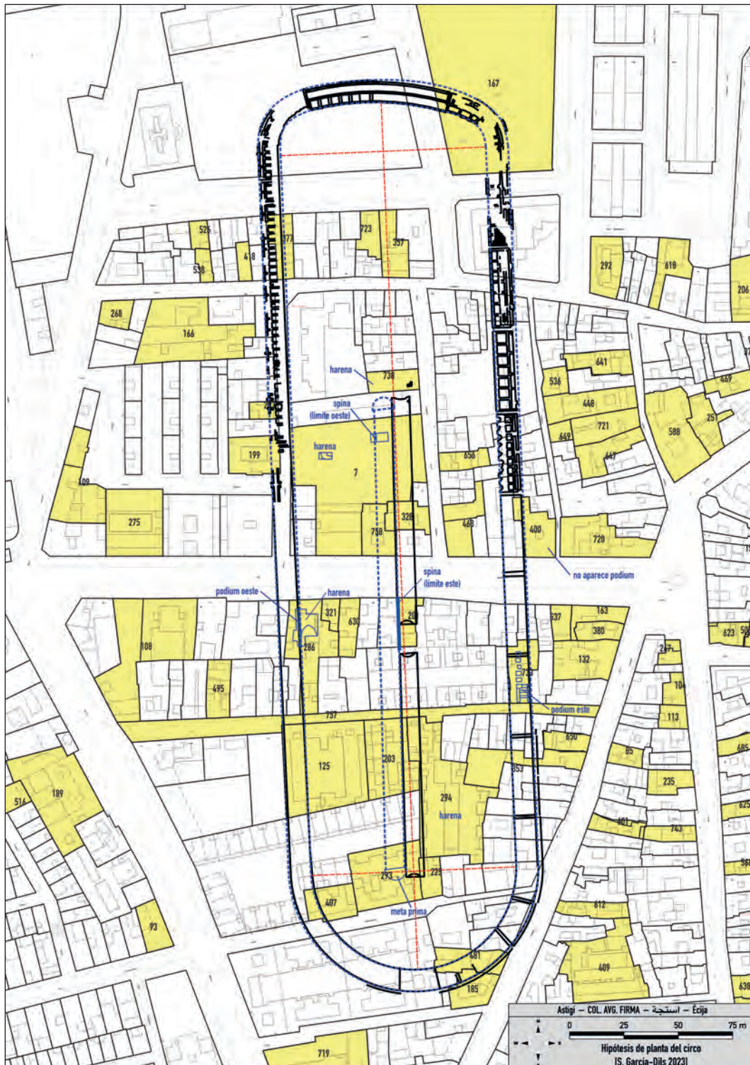
Fig. 14. Comparativa entre la planta del circo de colonia Augusta Emerita y la hipótesis que se presenta en estas líneas, ambas representadas a escala real. S. García-Dils 2023.

En lo que se refiere al callejero histórico en la zona, que se remonta por lo menos al siglo XVI (Martín Ojeda, 2007: 59 y 149), vemos cómo el límite este de la mitad septentrional de la calle Losa no solamente se ajusta a la orientación del circo, sino que coincide exactamente con el límite del graderío. Por su parte, la ya mencionada