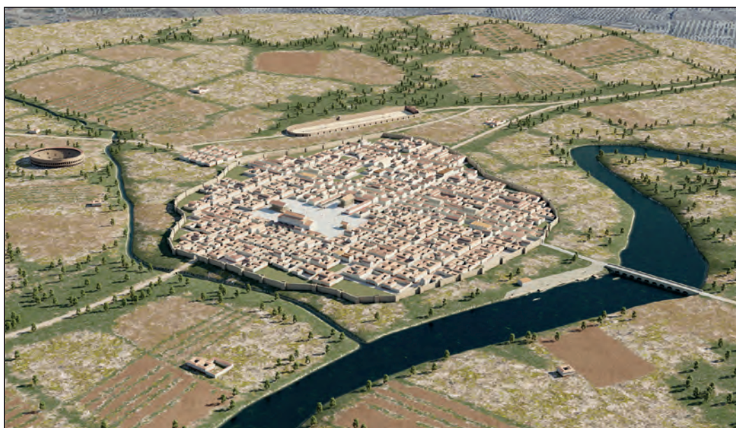
Fig. 12. Propuesta general de representación tridimensional de la trama urbana de colonia Augusta Firma ca. s. II d. C. VirTimePlace y S. García-Dils 2023.

Por su parte, la localización del graderío occidental vendría marcada por las estructuras localizadas en la avda. de los Emigrantes nº25 y 27 y calle Rosales nº36 [286], mientras que las del oriental se corresponderían con las zapatas de cimentación que salieron a la luz en la calle Rosales nº6 [733], lo que supone que la orientación del eje central del edificio circense sería de 356,3^\circ NG.