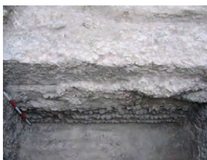
Fig. 6. Avda. de los Emigrantes nº25 y 27 y calle Rosales nº36 [286]. Sección longitudinal de la infraestructura. Doreste y Romero, 2004.