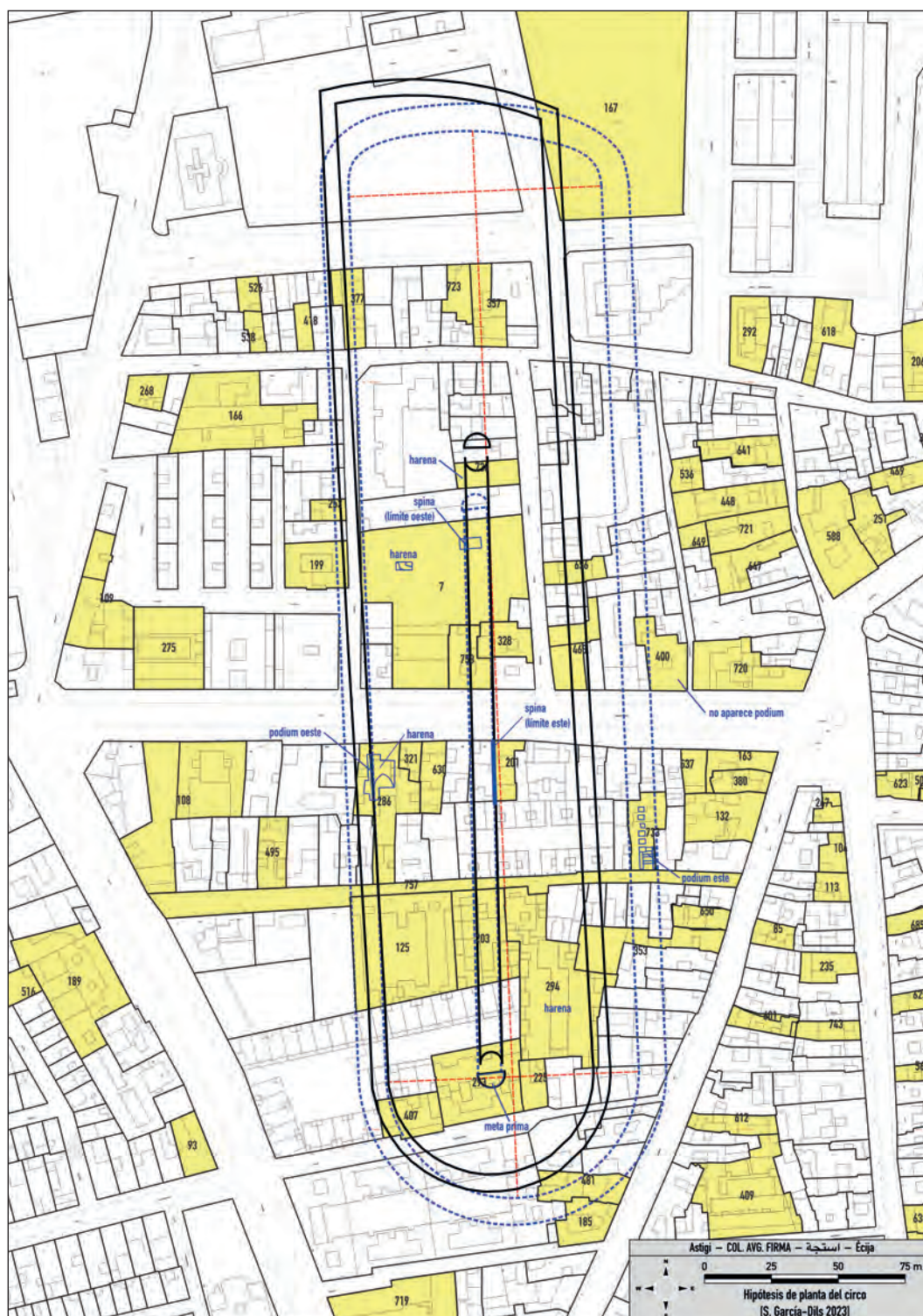
Fig. 13. Comparativa entre la anterior propuesta de restitución de la planta del circo (Carrasco y Jiménez, 2008) y la que se presenta en estas líneas. S. García-Diés 2023.

de 51,3 m a la altura de la meta prima (g). El contraste de estos datos con los conocidos en otros circos del imperio romano (Fauquet, 2002: 140-145, 162) nos hace ser conscientes de la excepcional anchura que presentaría la pista oriental del circo astigitano, que además sería la de retorno o reditus , circunstancia inusual que