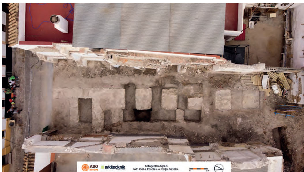
Fig. 9. Calle Rosales nº6 [733]. Estructuras documentadas (vista general). Arqinnova 2022.

En el sector norte del solar, se localizaba la primera infraestructura registrada de este conjunto constructivo [UE-38], con unas dimensiones de 2,10 x 1,80 m. A continuación, se situaba [UE-40], con 2,30 x 1,75 m. Después, [UE-14], parcialmente afectada por la