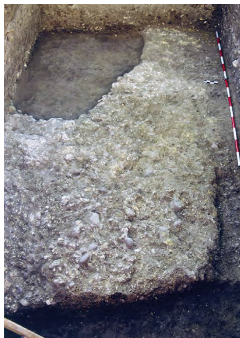
Fig. 4. Calle Losa nº6 a avenida de los Emigrantes nº16 [007]. Mejora del terreno asociada a la infraestructura [UE-71]. Romero et alii , 2002.

En la intervención arqueológica desarrollada en este solar se documentaron estructuras de cronología romana de las que se pueden relacionar con el circo las siguientes (Carrasco et alii , 2002; Romero et alii , 2002; García-Dils, 2015: 274-276) 11 . En la denominada Cuadrícula 1, sobre el sustrato geológico natural [UE-36], se detectó una capa de tierra de relleno y nivelación [UE-35], con unas cotas superiores comprendidas entre 101,00 y 101,21 m s.n.m.; a continuación, un nivel de grava de en torno a 0,10 m de potencia [UE-34], con unas cotas entre 99,95 y 101,28 m s.n.m.; por fin, una capa de unos 0,10 m de potencia media, compuesta por pequeños fragmentos de piedra caliza [UE-33], con unas cotas entre 101,00 y 101,30 m s.n.m. (Fig. 4). Por su parte, en la Cuadrícula 3, también sobre nivel natural [UE-36], se localizó una infraestructura lineal de opus