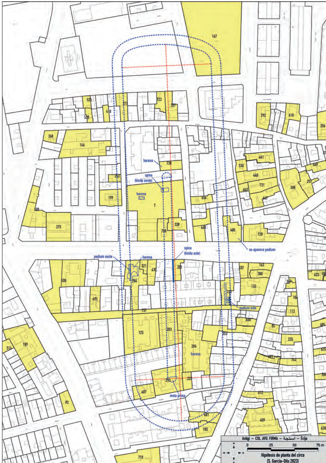
Fig. 11. Nueva hipótesis de restitución de la planta del circo. S. García-Díls 2023.

correspondería claramente con la harena del circo, pudiéndose relacionar su escasa potencia con la cota del sustrato geológico, que no hizo necesarios mayores aportes de rellenos para la nivelación de la pista.