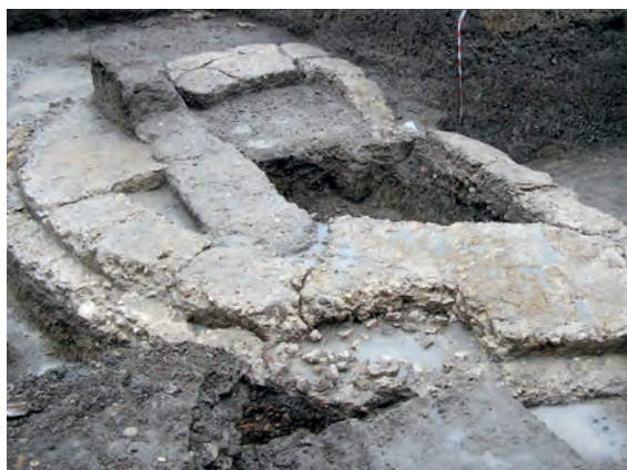
Fig. 7. Calle Antequera nº10 y 12 [293]. Estructura semicircular [UE-102]. J. M. Huecas 2007.

Intervención arqueológica en la que se practicaron cinco sondeos estratigráficos, a los que siguió el vaciado completo del solar (Huecas, 2007; García-Dils, 2015: 278-279). A las estructuras exhumadas se les asignó genéricamente cronología romana sin plantear propuestas sobre su funcionalidad. Destaca en primer lugar la cimentación de una estructura de planta semicircular [UE-102], construida en opus caementicium , con un diámetro de 9,45 m y huellas de sillares de calcarenita con los que contaría en alzado; sus cotas relativas se situaron entre -1,40 y -1,70 m (Fig. 7). La infraestructura se levantó sobre un nivel de preparación constituido por dos tongadas de cantos rodados [UE-105]. Además, se localizaron niveles de pavimentaciones constituidas por cantos rodados y cal [UE-208], a una cota relativa de -1,68 m. Estas estructuras serán después reconocidas respectivamente como la meta prima [UE-102] y un sector de la harena [UE-208].