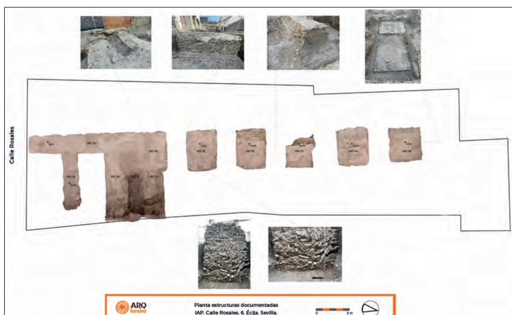
Fig. 10. Calle Rosales n°6 [733]. Estructuras documentadas (detalle). Arqinnova 2022.

La técnica edilicia en todos los casos partió de la excavación de fosas en el sustrato geológico, sin que se hayan registrado huellas de encofrado, con un relleno de opus caementicium compuesto por mampuestos calizos, cementados con mortero rico en cal, sobre una base de cantos rodados. Bajo este nivel se registraba a su vez una capa compuesta por limos, arena y cal de 0,10 m de potencia, correspondiente al