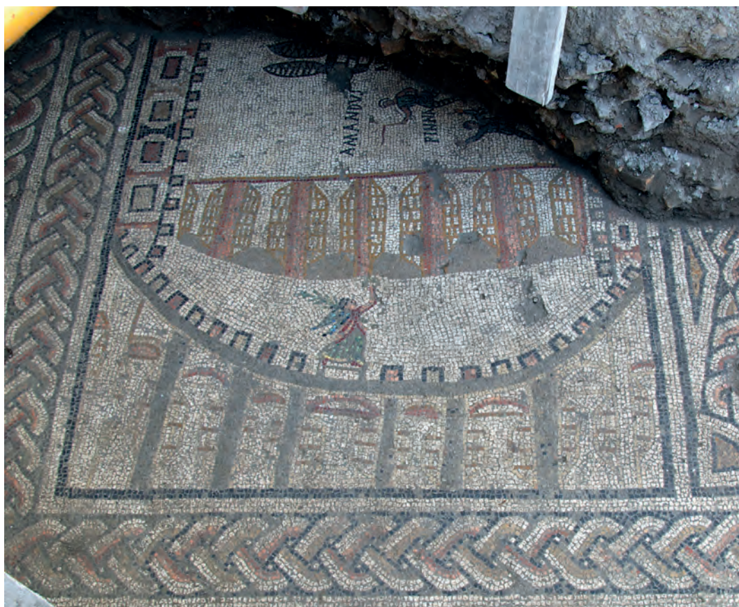
Fig. 2. Calle Elvira nº3 y calle Fernández Pintado nº5 [531]. Mosaico del circo (vista general). S. García-Dils 2010.