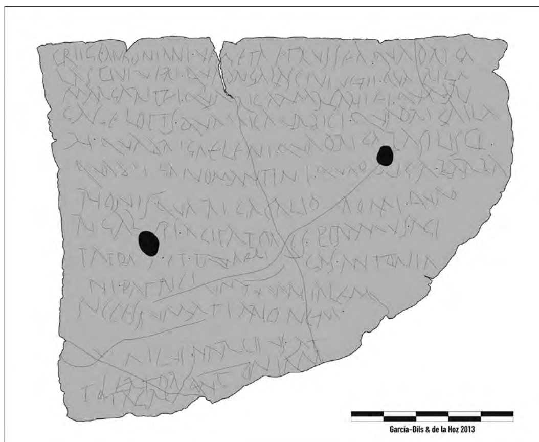
Fig. 1. Calle Bellidos nº18 [107]. Defixio circense. S. García-Dils y J. de la Hoz 2013.

A este reducido elenco de inscripciones se sumó hace una decena de años una tercera, de gran trascendencia para la comprensión del funcionamiento de los ludi circenses en colonia Augusta Firma (García-Dils y de la Hoz, 2013; Thuillier, 2013: 210-214 y 218; Sánchez Natalías, 2022: 212-213 n.º132, 537) (Fig. 1). Se trata de una tabella defixionis circense, el primer caso conocido de este tipo en Hispania , puesto que solo se han documentado por el momento en la propia Vrbs , Judea, Siria y África. La pieza fue hallada en la necrópolis occidental de la colonia , en el transcurso de las excavaciones arqueológicas desarrolladas en un solar situado en la calle Bellidos nº18 [107] 8 , a menos de 200 m al suroeste del hipotético límite meridional del edificio circense. En esta parcela se documentaron 118 estructuras funerarias, tanto de incineración como de inhumación, fechadas entre los últimos años del s. I a. C. y finales del s. I d. C. La pieza epigráfica que nos ocupa apareció asociada a una tumba de incineración –enterramiento nº 36 / [UE-67]–, en cuyo interior se registró también un as de Augusto acuñado en colonia Iulia Traducta (Tinoco y López, 2001; Tinoco, 2002; López Flores y Tinoco, 2007; García-Dils, 2015: 465-466). Así, su hallazgo se adecúa al modelo que se observa en las defixiones circenses norteafricanas de procedencia de ámbitos funerarios cercanos al mismo circo. El