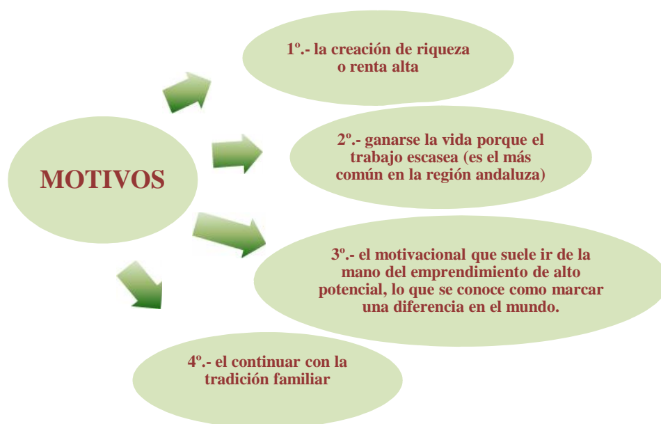
Figura 5. Motivos para ser emprendedor.

Así mismo señala el citado informe que los motivos que llevan al emprendedor a iniciar una actividad son: