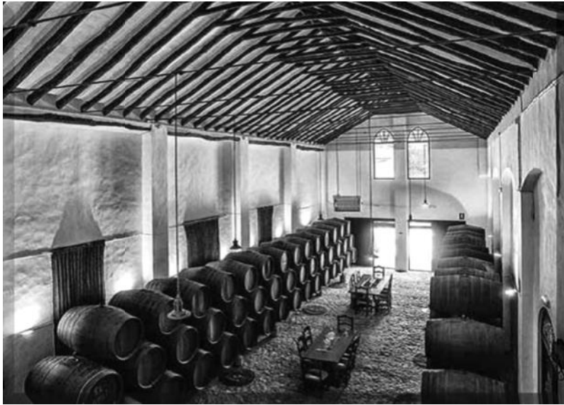
Figura 9. Vista de la bodega "Alfolí".