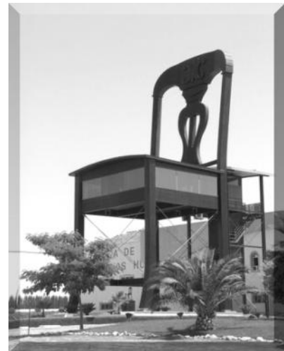
Figura 6. Museo del mueble. Fuente: internet. Adaptación propia.

Pero la Lucena emprendedora no se quedó pasiva y su industria continuó creciendo y evolucionando hasta el punto de que a pesar de ser una población principalmente agrícola también se convirtió en una población industrial, pues a la madera se le añadió el sector del frío industrial. Esta evolución que comenzó en los años noventa define la economía actual lucentina del siglo XIX.