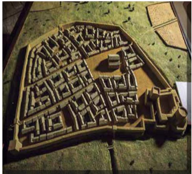
Figura 4. Plano de la Lucena judía.

Una de las definiciones que mejor se adaptan a la Lucena judía fue la del geógrafo Xerif al-Idrisi (n. 1099) 6 : “la ciudad de los judíos, indicando que en el arrabal, carente de cerca, vivían los musulmanes y algunos judíos, y en él se encontraba la mezquita mayor; en la ciudad moraban ricos judíos que no dejaban a los musulmanes penetrar en ella; la ciudad se rodeaba de buenas murallas y de un hondo foso al que iban a parar las aguas de las acequias” (Figura 4).