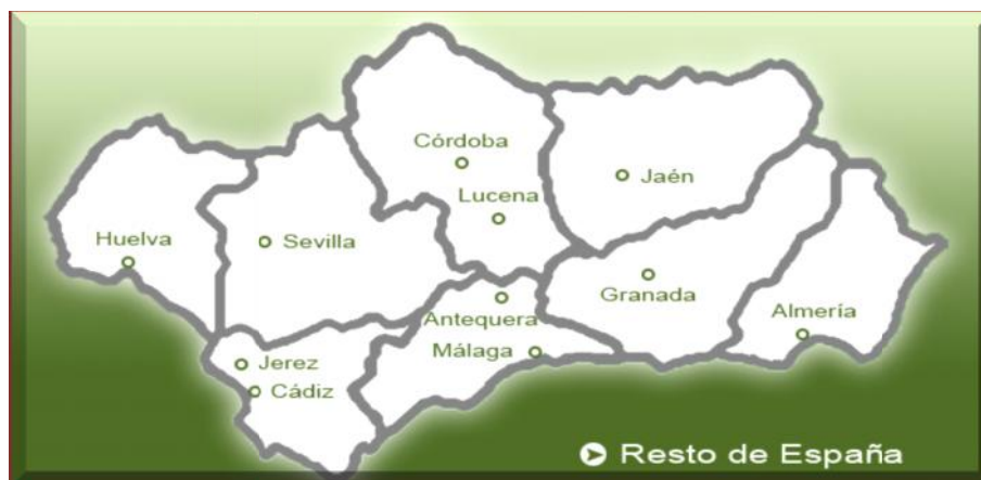
Figura 1. Localización de Lucena.