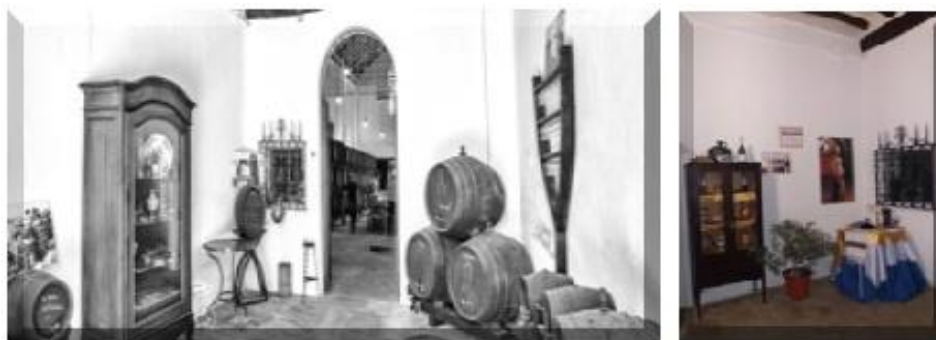
Figura 10. Vistas del "Rincón Sefardí"

Algunos de nuestros cachones han sido minuciosamente preparados para almacenar el vino Kosher 35 .