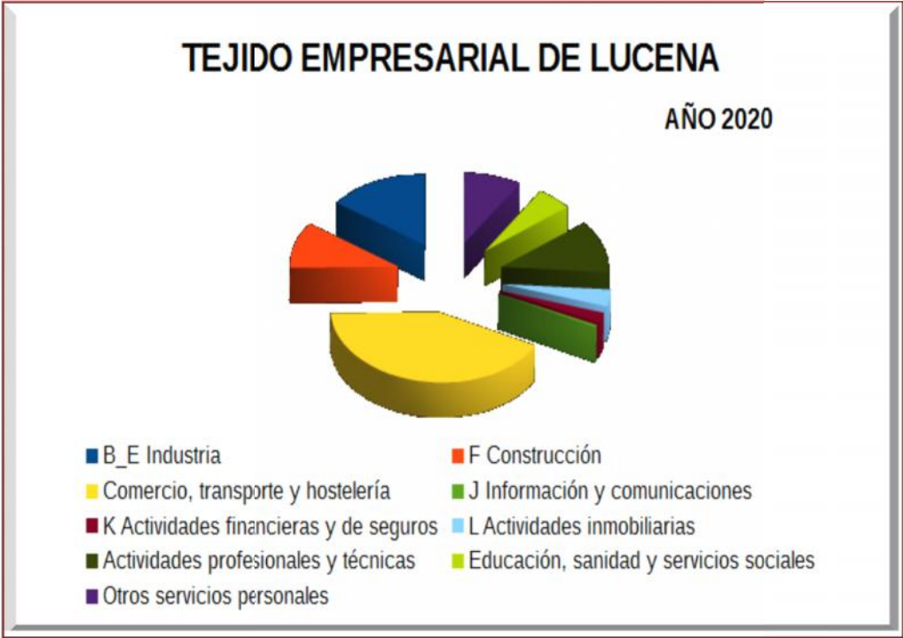
Figura 7. Tejido empresarial de Lucena 2020.

El tejido empresarial lucentino, según los datos facilitados por el Instituto Nacional de Estadística para el año 2020, está formado por un total de 2.923 empresas, de las que 445 pertenecen al sector industrial con una alta representación del frío industrial. El alto porcentaje de empresas que pertenecen al sector comercio, transporte y turismo, es debido a que muchos de los lucentinos que han perdido sus puestos de trabajo han optado por convertirse en emprendedores y crear sus propios negocios. Su ya mencionado dicho “ser mi propio jefe” (Figura 7).