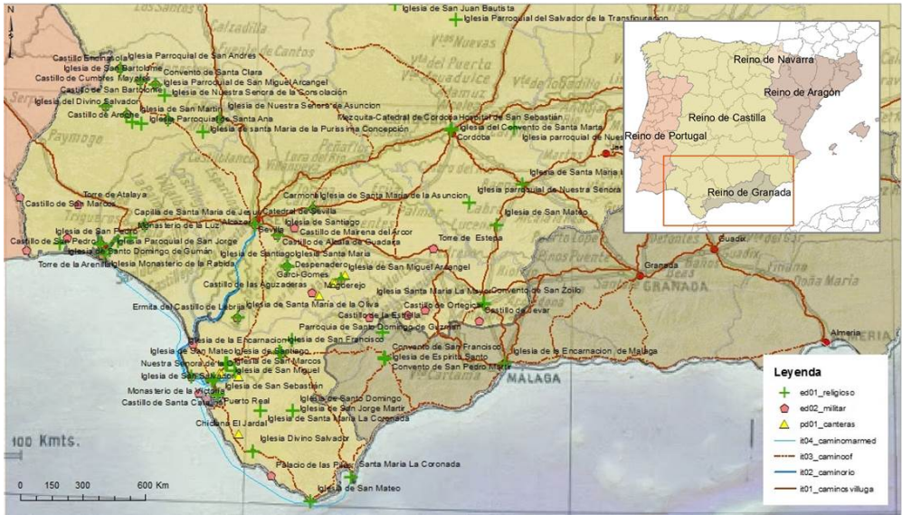
Figura 1: Mapa de las canteras, caminos y edificios religiosos, militares y civiles que fueron o tienen elementos construidos en este periodo - finales del S.XV y principios del S.XVI. El fondo de la imagen se yuxtapone a la cartografía de Repertorio de los Caminos de Villuga por Gonzalo Menéndez Pidal.