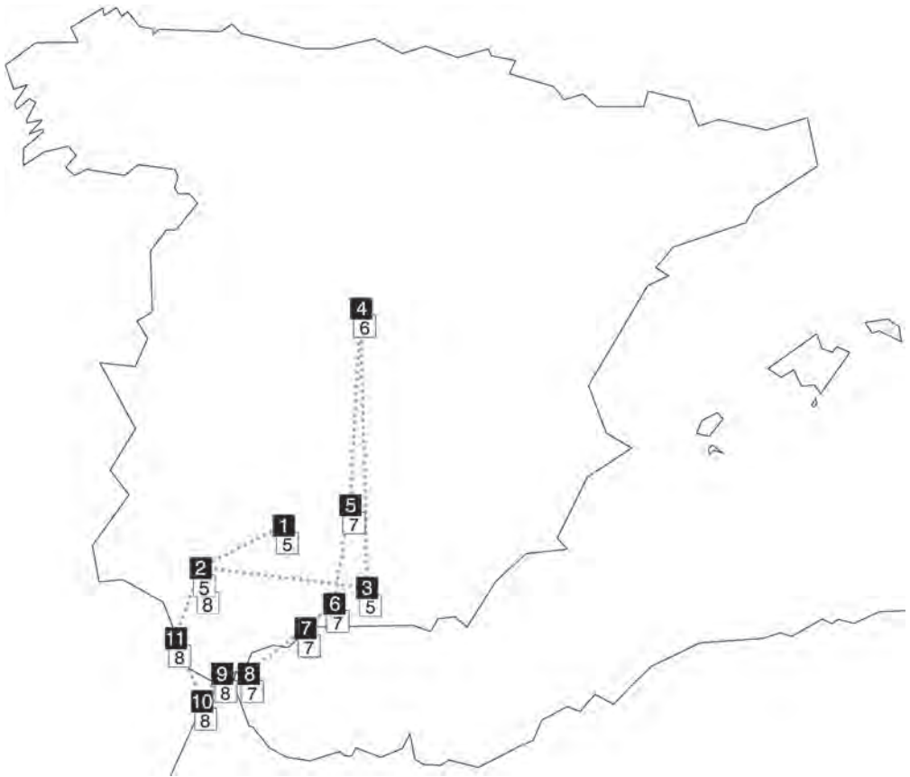
FIG. 2. Localidades visitadas por Clifford en Andalucía, Gibraltar y norte de Marruecos. Mayo y agosto de 1859. Gráfico realizado por el investigador.