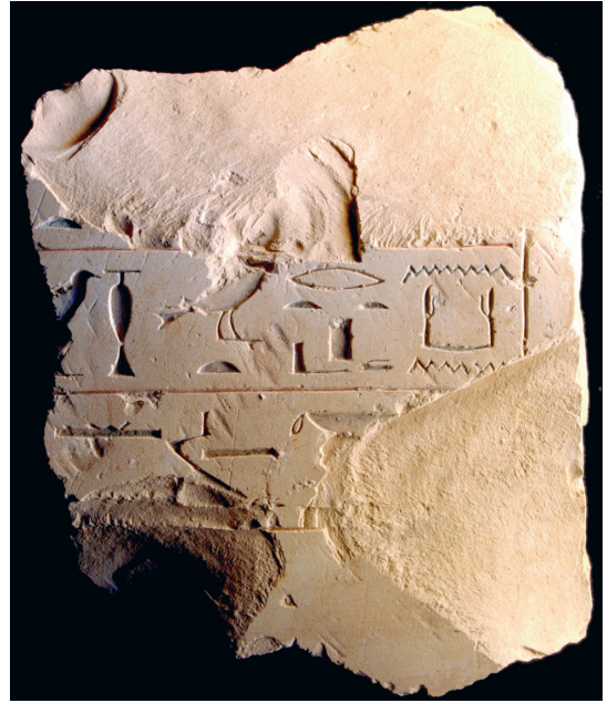
FIG. 6. Fragment E.