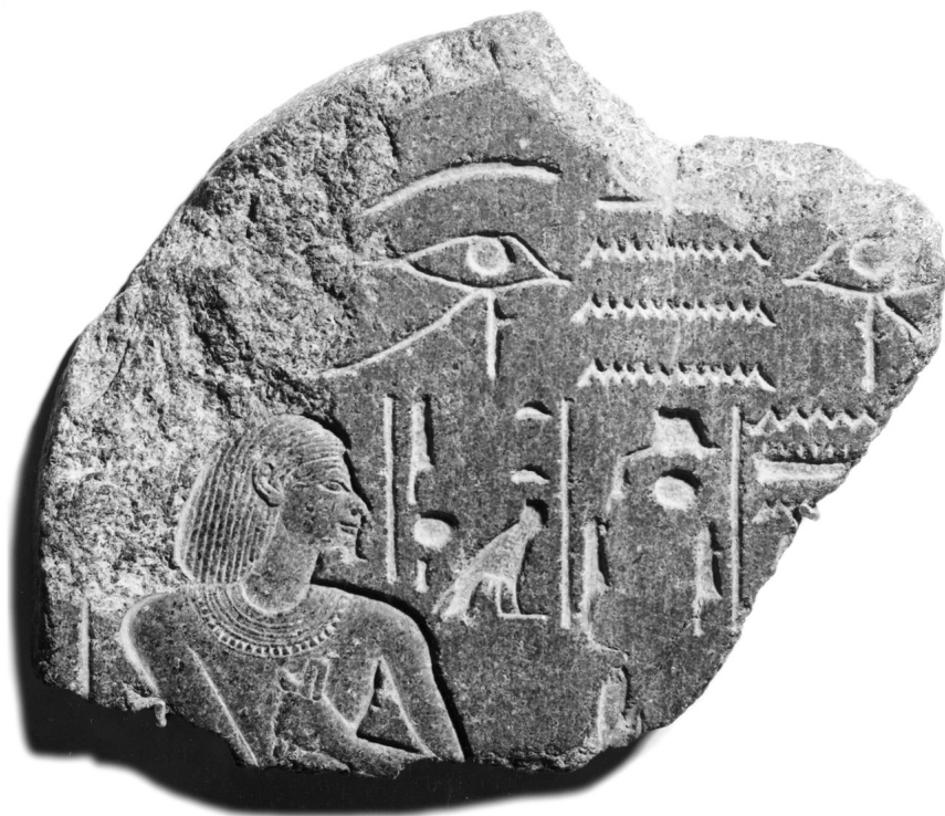
FIG. 2. Fragment C.