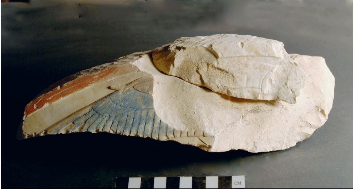
FIG. 9. Fragment G.