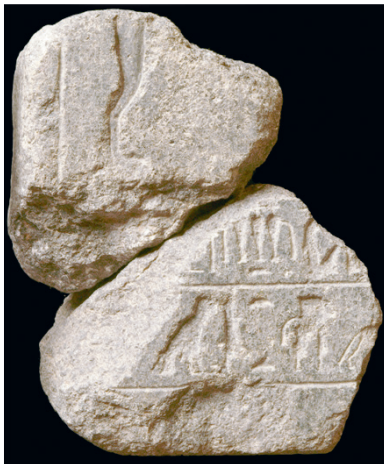
FIG. 3. Stèle de Têti-em-Rê.