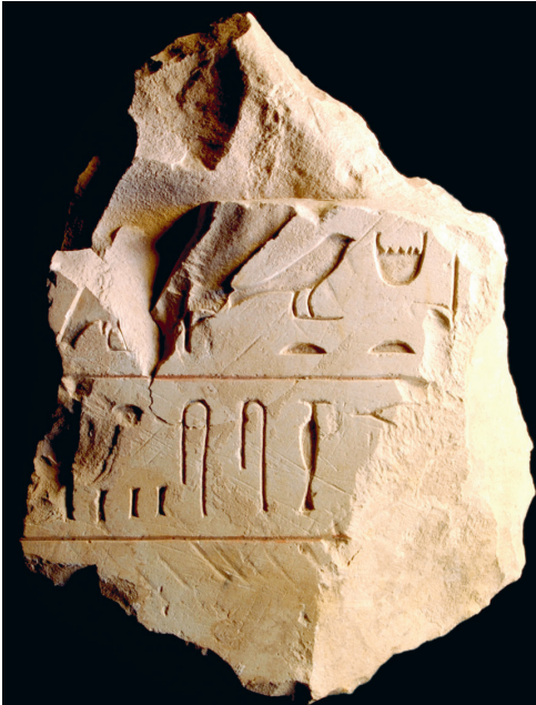
FIG. 5. Fragment D.