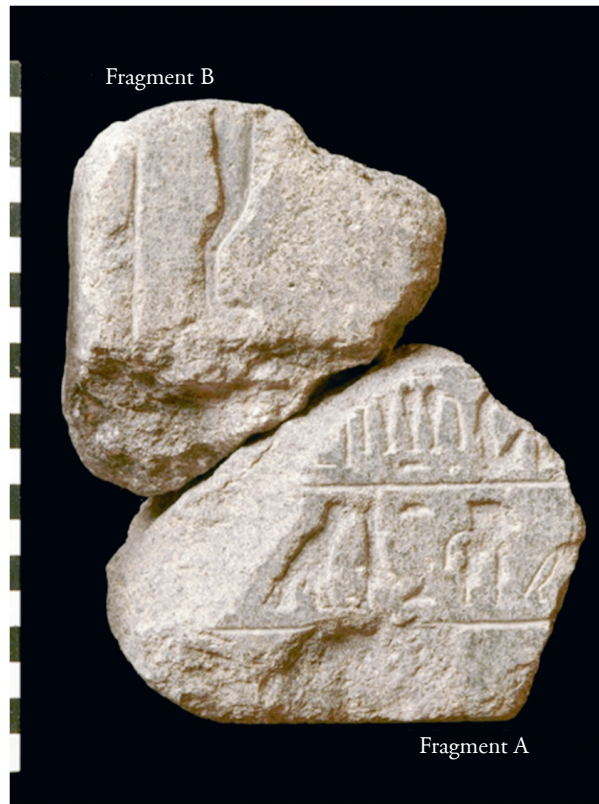
FIG. 1. Fragments A et B.