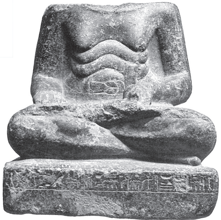
FIG. 4. Statue de Têti-em-Rê au Caire (CG 42042).