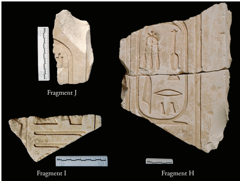
FIG. 10. Fragments H, I et J.