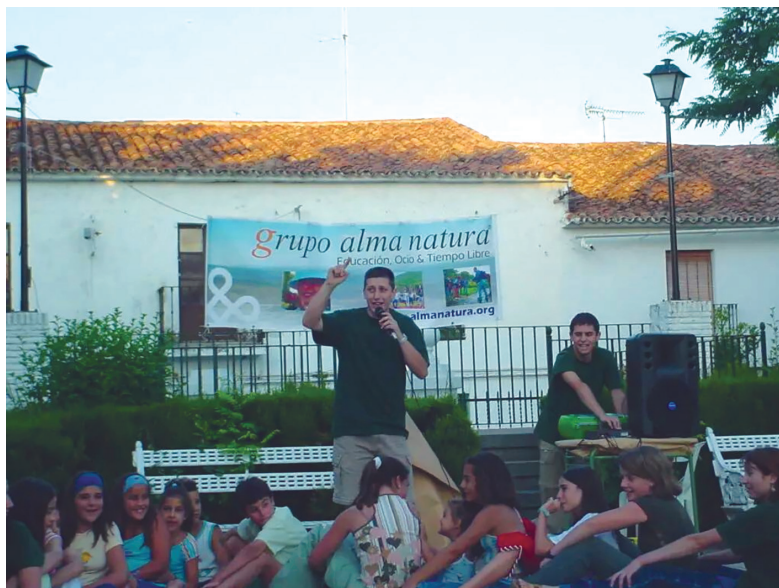
Figura 1.1. Dinamización social participativa (Santa Olalla del Cala).

AlmaNatura fue fulminante. En aquel tiempo, muy pocos hablaban de la importancia del mundo rural y sus servicios comenzaron a pasar inadvertidos entre los pequeños ayuntamientos a los que atendían.