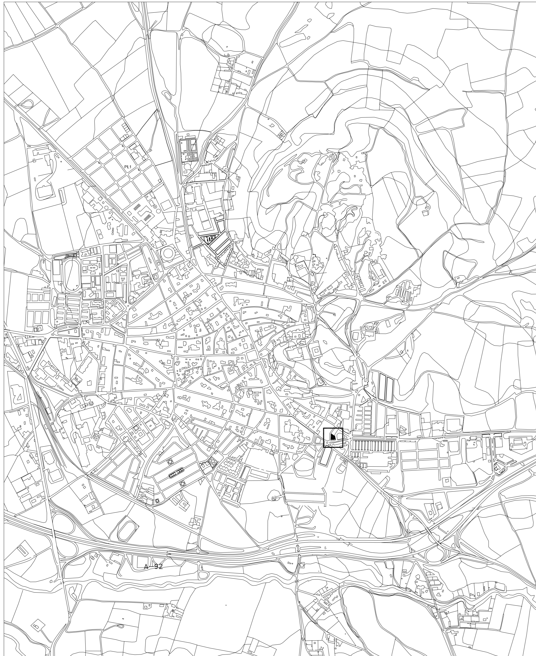
PLANO OSUNA_E 1/10.000