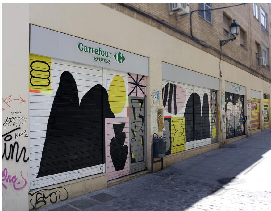
FIGURA 1. Fotografía de la Calle Mano de Hierro con las intervenciones murales de FADBB 2023

que decida intervenir espacios interiores en sus correspondientes proyectos. A pesar de ser una sala privada, ha estado libremente abierta al público. Otro espacio que ha participado en el festival ha sido el espacio Maneras Café, en el cual han tenido lugar intervenciones performativas, que también se encuentran incluidas en los contenidos de la asignatura para la que proponemos este estudio.