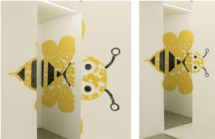
FIGURA 4. Fotografía de la instalación site-specific en Fuentenueva Espacio Arte. Dos tomas desde diferentes puntos de vista