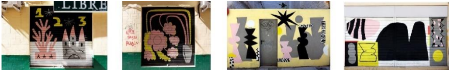
FIGURA 3. Algunas de las instalaciones murales de FADBB 2023