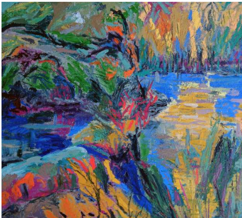
RIBERA DE GUADAÍRA.