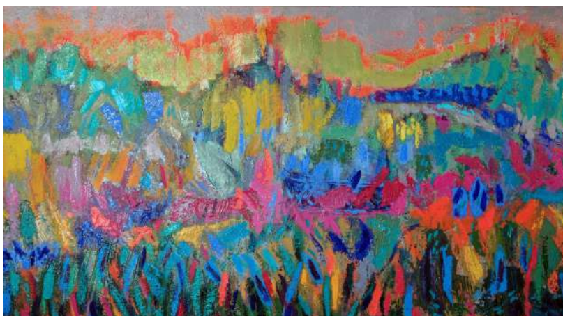
PAISAJE DE DOÑANA.