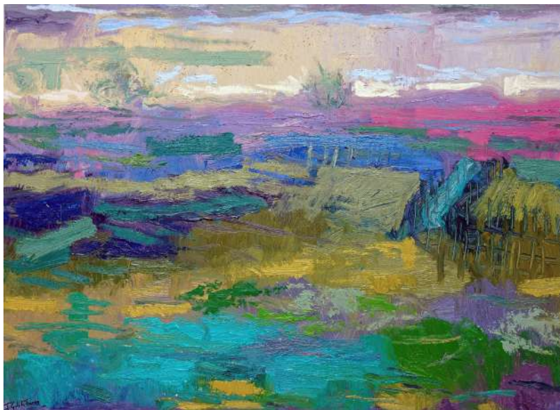
PAISAJE DE DOÑANA I.