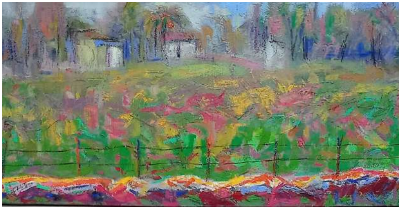
ALAMBRADAS Y CASAS.