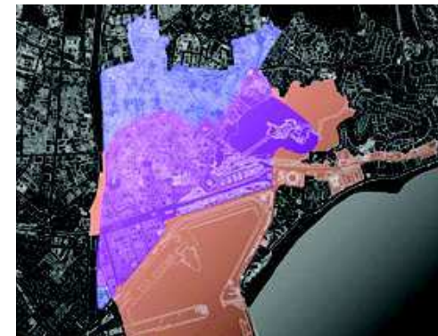
FOTO 1: Esquema de zonas comprendidas y excluidas de Conjunto Histórico y Plan Especial de Protección y Reforma Interior del Centro Histórico. Morado: Zona Protegida, Marrón: Zona Periférica, Azul: Zona de Cautela Urbanística.