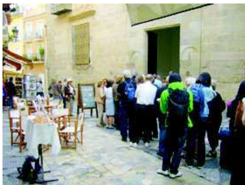
FOTO 3: Nota pie de imagen: Palacio de Buenavista convertido en recurso turístico. Fecha: 7 de noviembre de 2010.

Dos de estos bienes han sido protagonistas de un gran aumento de visitantes tras su rehabilitación, se trata del Palacio de Buenavista y del Teatro Romano. El Palacio de Buenavista alberga el Museo Picasso y ha pasado de llevar varios años cerrado a contar con 386.703 visitantes en 2004, año de su inauguración y momento de mayor afluencia. Por otra parte, el Teatro Romano no era accesible hasta el 2004, desde entonces han aumentado las visitas en cuatro años hasta llegar a 445.383 personas en 2008.