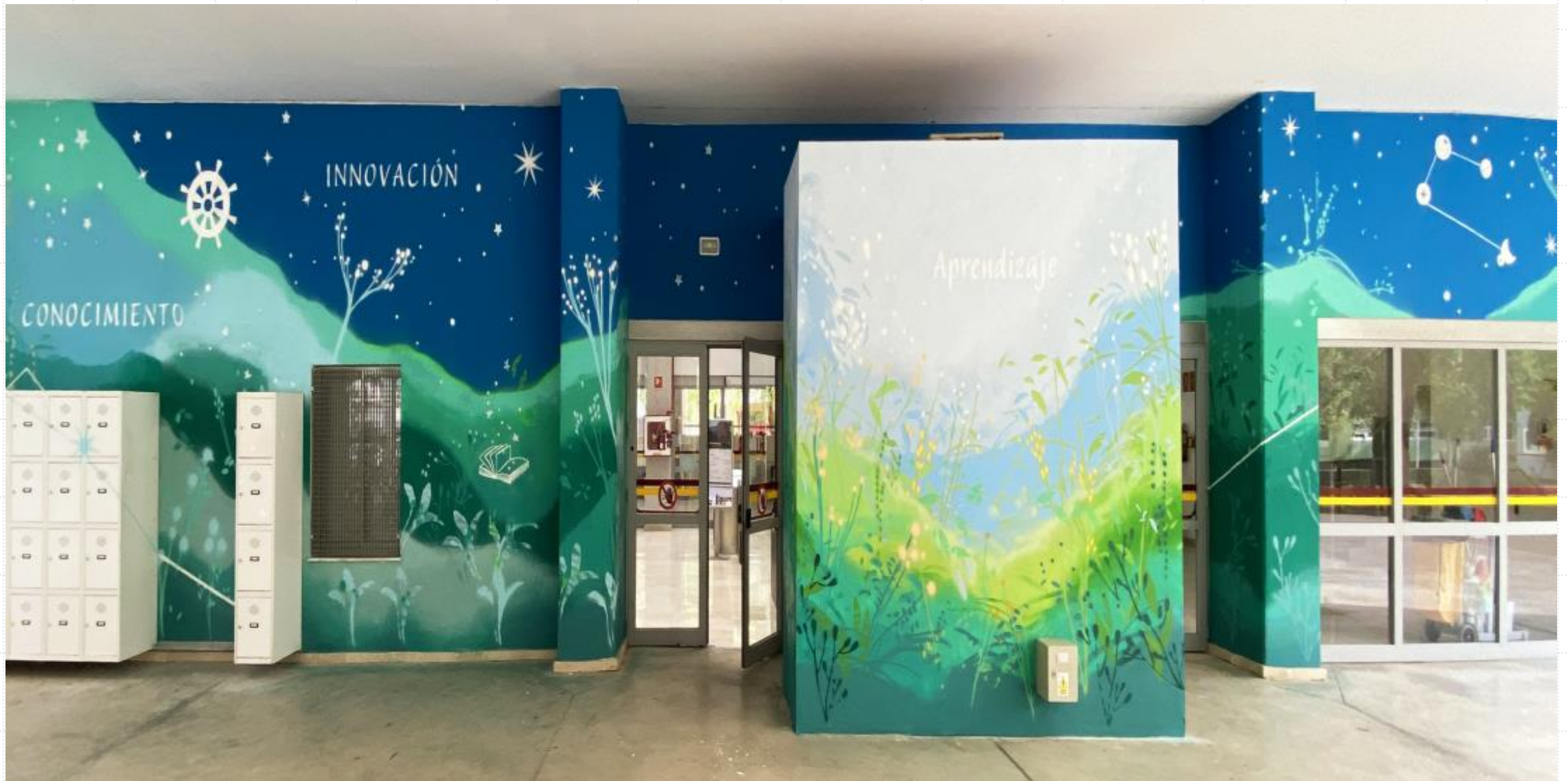
Mural realizado por María Ortega Estepa