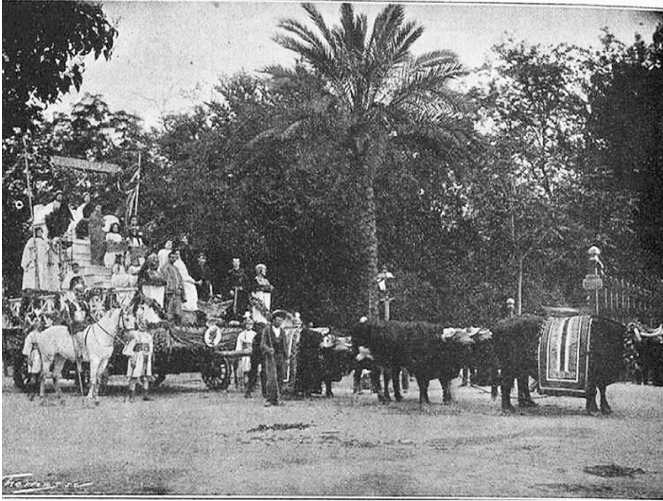
Figura 5. Carroza de los círculos y sociedades de recreo , “La Ilustración Artística”, número 961, 28 de mayo de 1900.

cultura y de las artes 32 . La carroza manifestaba el buen gusto de sus creadores y hacía juego con el lujo en las vestimentas del grupo de acompañantes: soldados vestidos a la tudesca de época del emperador Carlos, escuderos, pajes, trompeteros y heraldos portando banderas y estandartes.