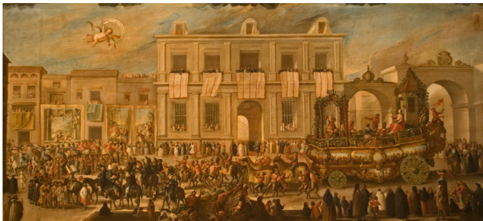
Figura 3. Domingo Martínez, El cuadro de la común alegría , Museo de Bellas Artes de Sevilla, © Wikipedia, Creative Commons.

tinentes representados por elegantes damiselas. Al parecer, la estética de esta carroza se inspiraba en una de las ocho que constituía el conjunto de representaciones de otros tantos carros alegóricos que desfilaron por las calles de la ciudad en 1747 con motivo de la exaltación al trono de España de Fernando VI y Bárbara de Braganza. Tales vehículos desfilaron en una mascarada organizada por la Real Fábrica de Tabacos. Tenemos referencia visual en uno de los cuadros del pintor Domingo Martínez (1688-1749) hecho para la ocasión llamado El cuadro de la común alegría (135 x 192 cm. Museo de Bellas Artes de Sevilla) (Figura 3).