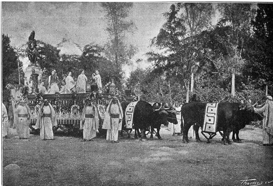
Figura 4. Carroza del gremio de vinateros , “La Ilustración Artística”, número 961, 28 de mayo de 1900.

siglo XIX y principios del novecientos 26 . Además, su habitual iconografía se inclina, entre otras, por las alegorías, tan del gusto de su tiempo, empleadas para ponderar los nuevos valores de la época: el progreso, la industria, el comercio y, en general, el desarrollo económico 27 . Como tal, acomete la ornamentación de la carroza al modo “moderno”; es decir, mostrando la actualidad de la moda con la intención de influir en el público con cierto tono propagandístico.