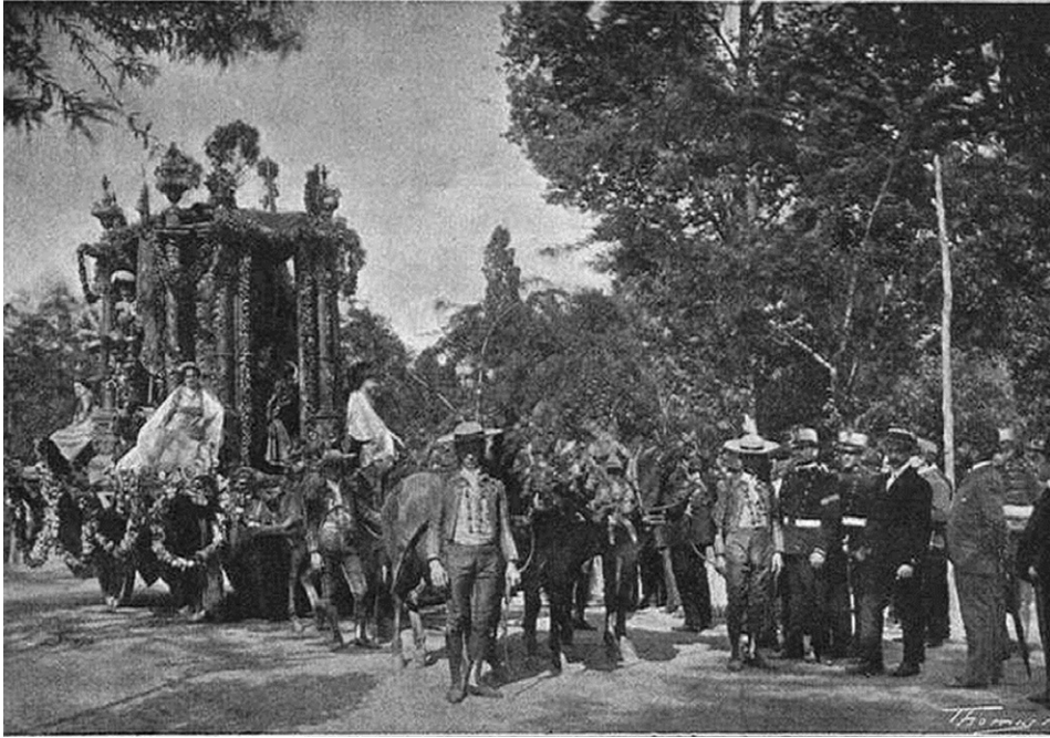
Figura 2. Carroza del Arte Antiguo , “La Ilustración Artística”, número 961, 28 de mayo de 1900.

un número considerable de industriales del ramo 25 . Unos años después, la actividad industrial y concretamente corchera se centraría en la sevillana avenida de Miraflores y sus alrededores.