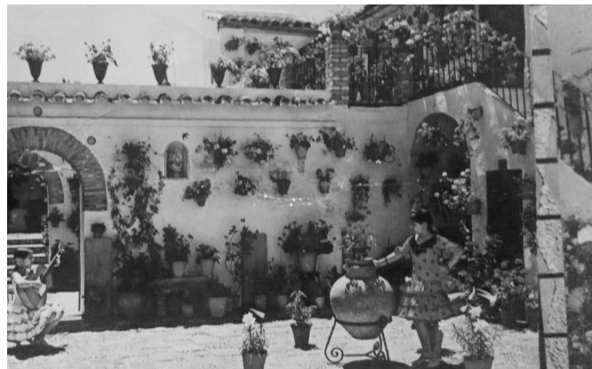
Imagen histórica de la primera casa recuperada por PAX

La necesidad de mantener un equilibrio entre estos valores, es decir entre forma física y forma social, a la vez que se actualiza la vida de los patios en clave contemporánea en el respeto a su valor patrimonial, ha motivado la creación de PAX –Patios de la Axerquía–, iniciativa pluridisciplinar que, junto a colectivos ciudadanos, estudia, analiza y fomenta la rehabilitación y recuperación de las casas de vecinos de la Axerquía con el fin de mantener su carácter residencial 2 . En la documentación publicada por Unesco, figura una de las extraordinarias casas-patio que esta iniciativa está rehabilitando 3 . La casa de vecinos del siglo XVIII de la calle Montero, en