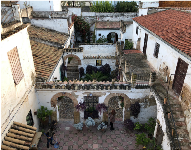
Primera casa recuperada por PAX