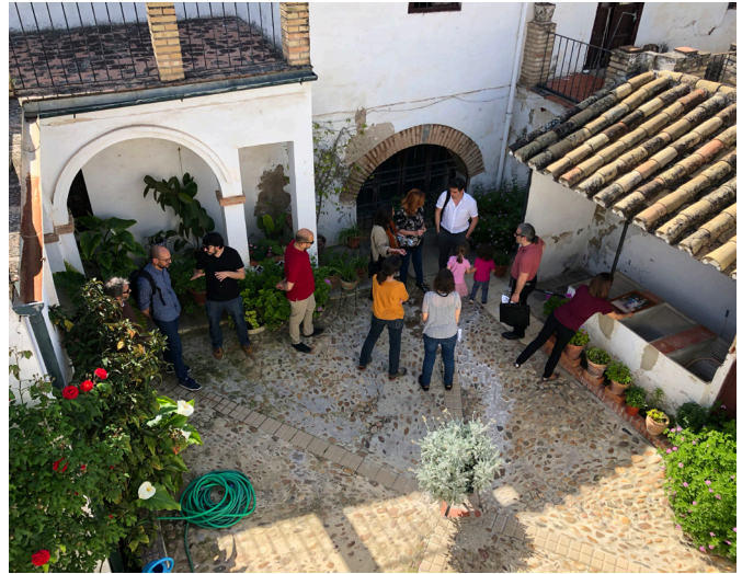
Visita del Consejo de Europa a PAX y sus partners